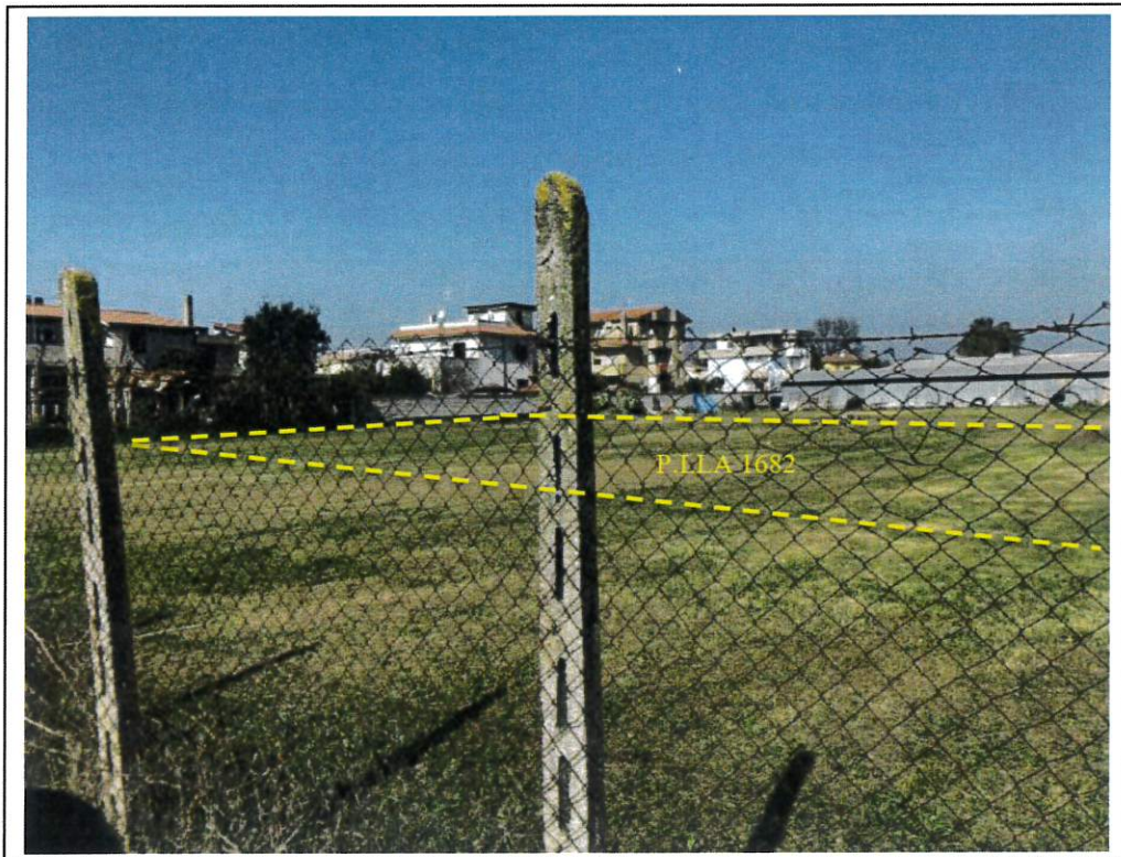
FOTO N.1_ P.LLA 1682