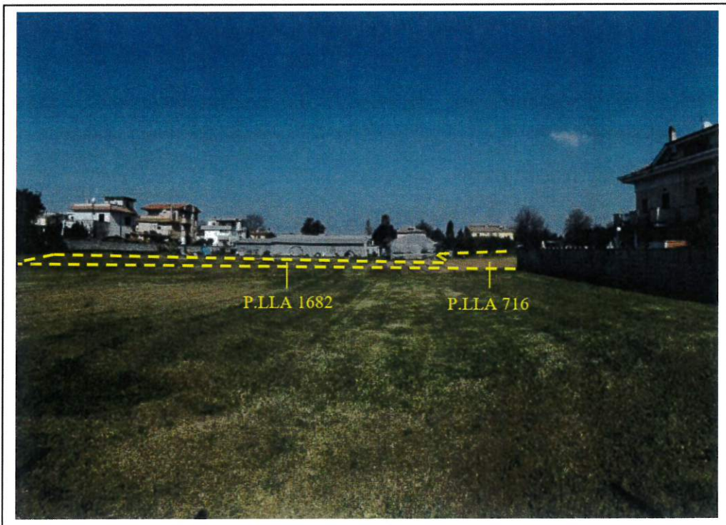
FOTO N.2_ P.LLA 1682 e 716