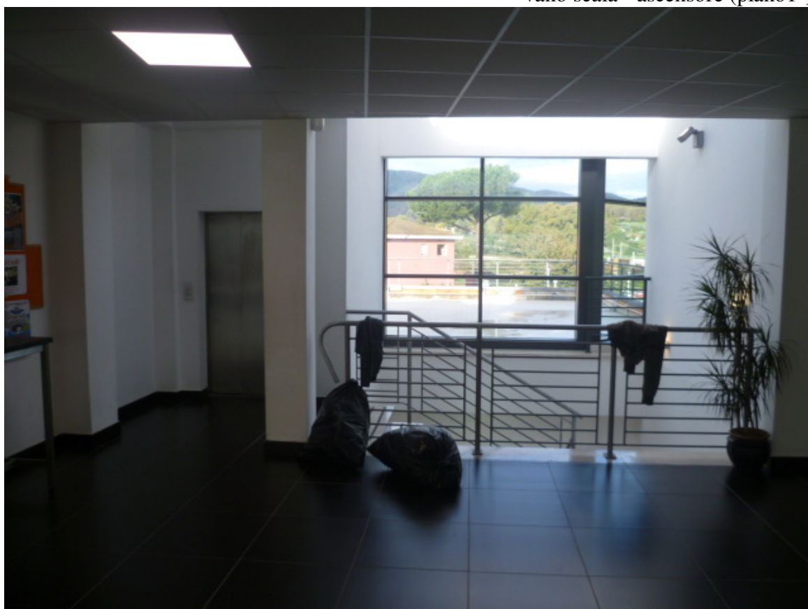
vano scala - ascensore (piano 1°)