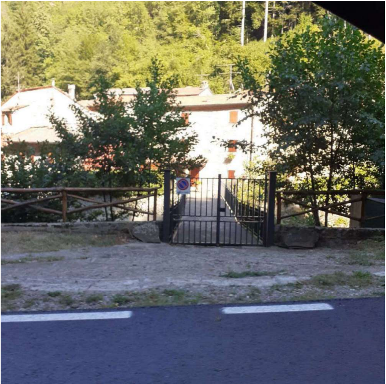
Il cancello (privato) tramite il quale è avvenuto l'accesso all'immobile durante il sopralluogo