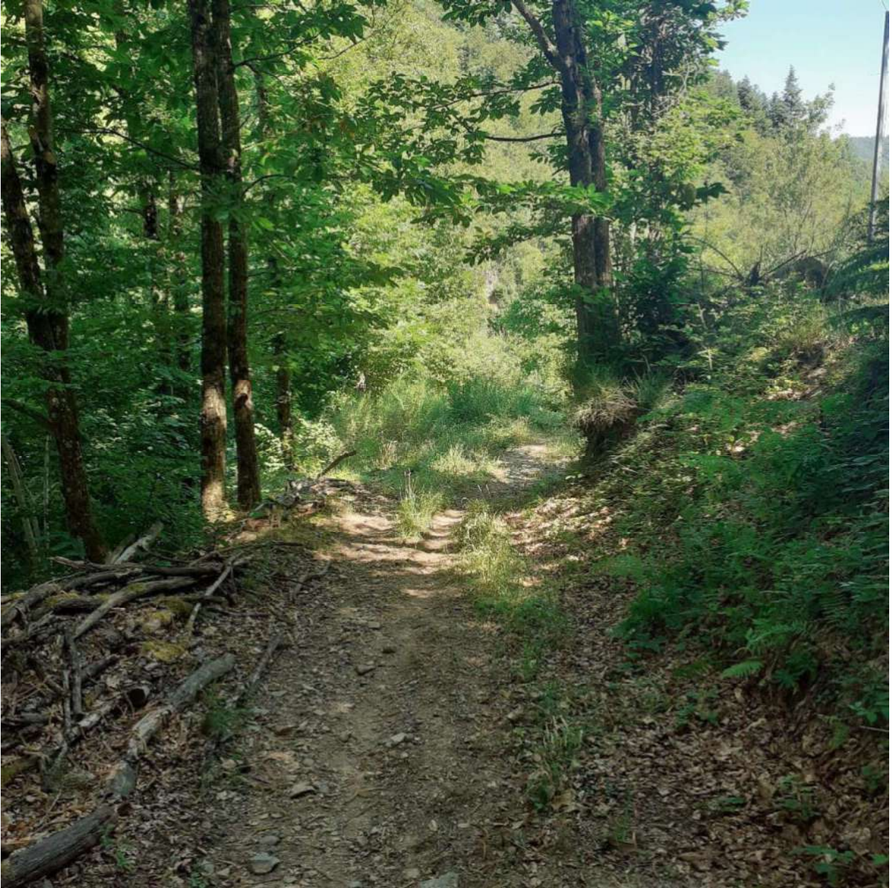
La strada di accesso all'abitazione