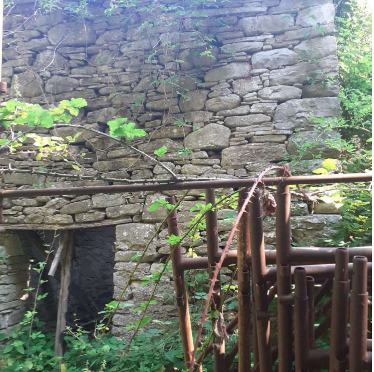
Il deposito, particella 356