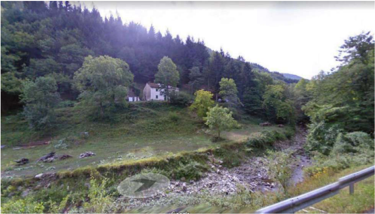
Foto dalla Strada Provinciale 24