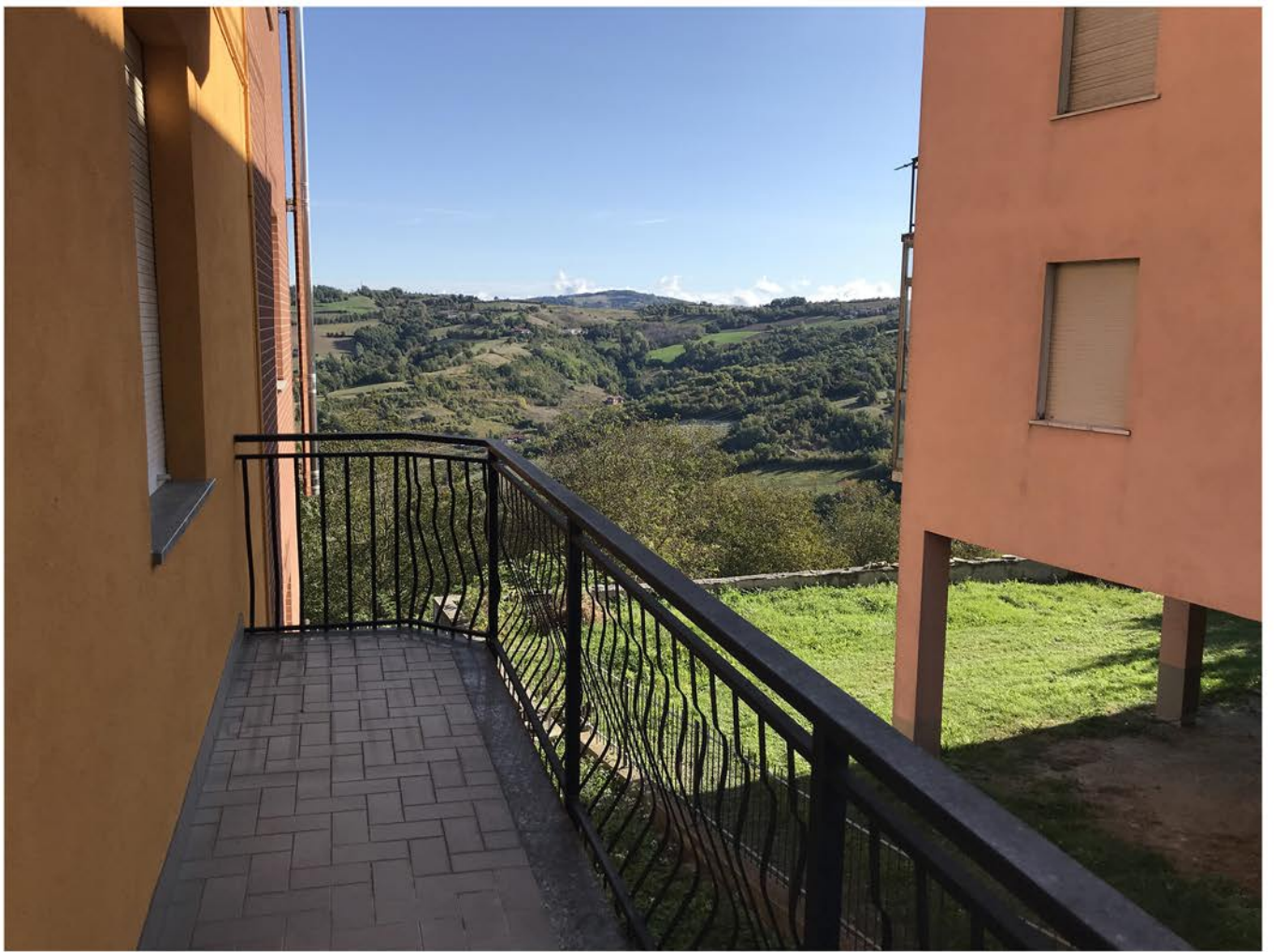
appartamento piano 1 (sub.7)