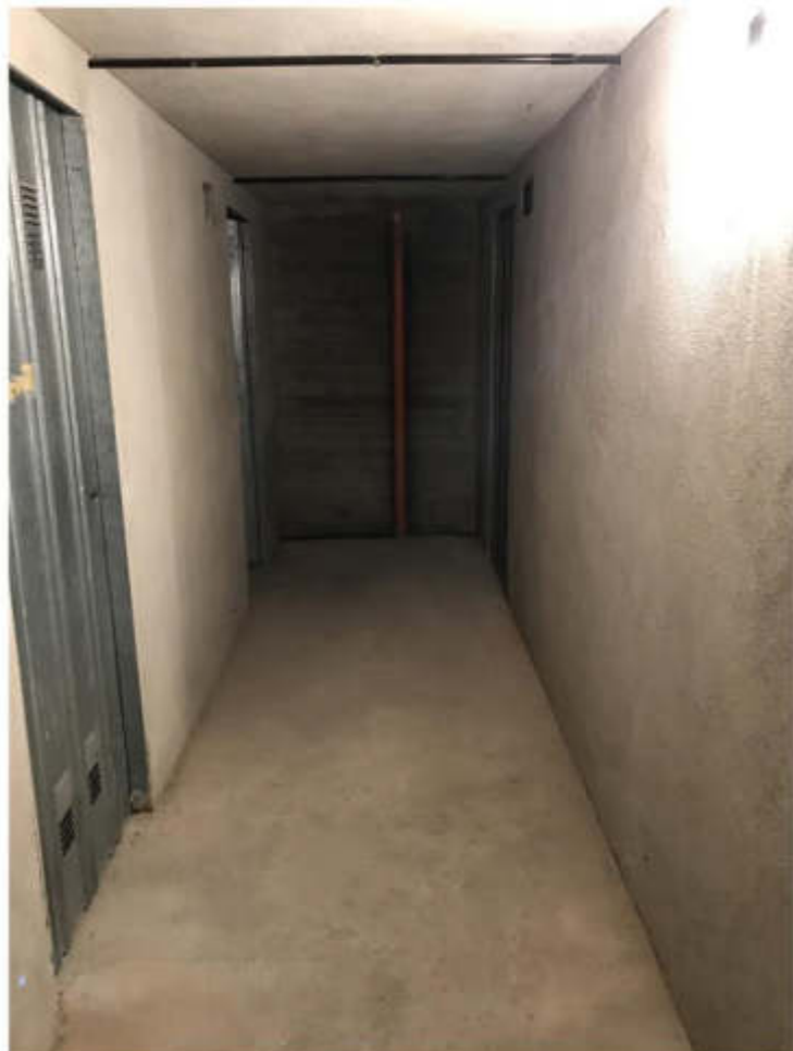
zona cantine e accesso alle cantine