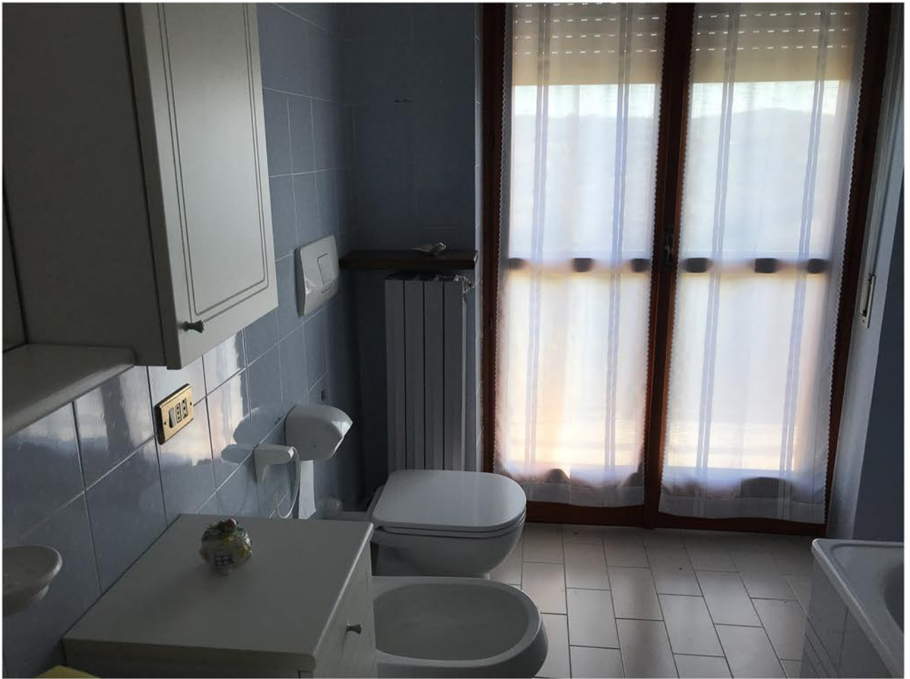
appartamento piano 1(sub.7)