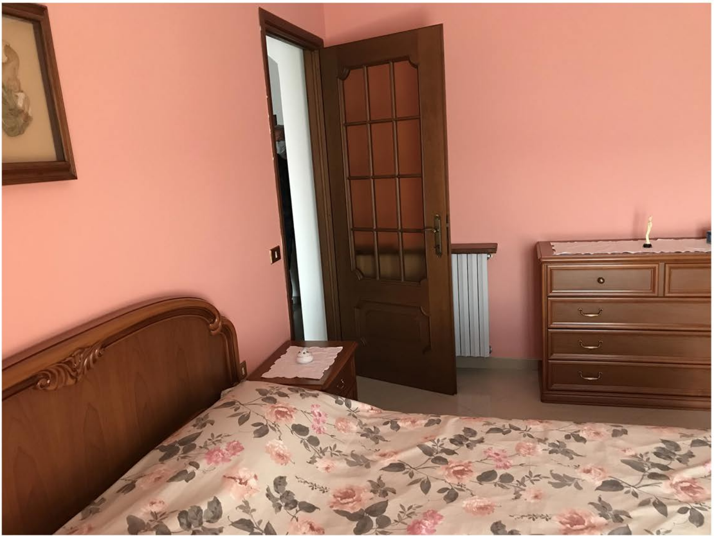
appartamento piano 1 (sub.7)