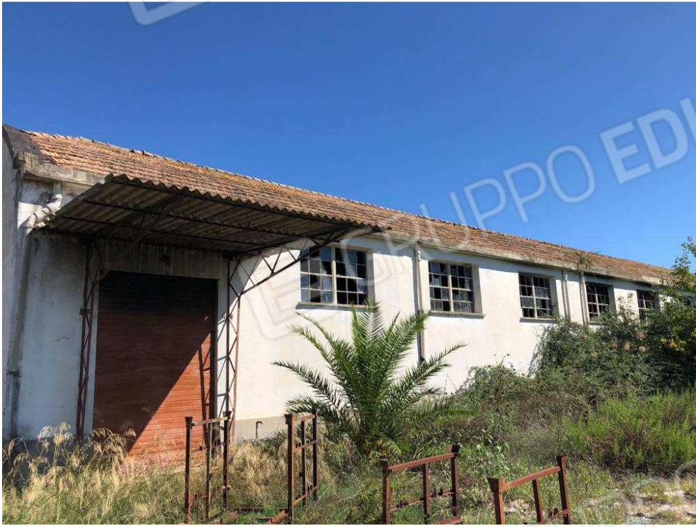
foto 19 – Metaponto, contrada Mercuragno - capannone - f. 43 ptc 181 – prospetto laterale