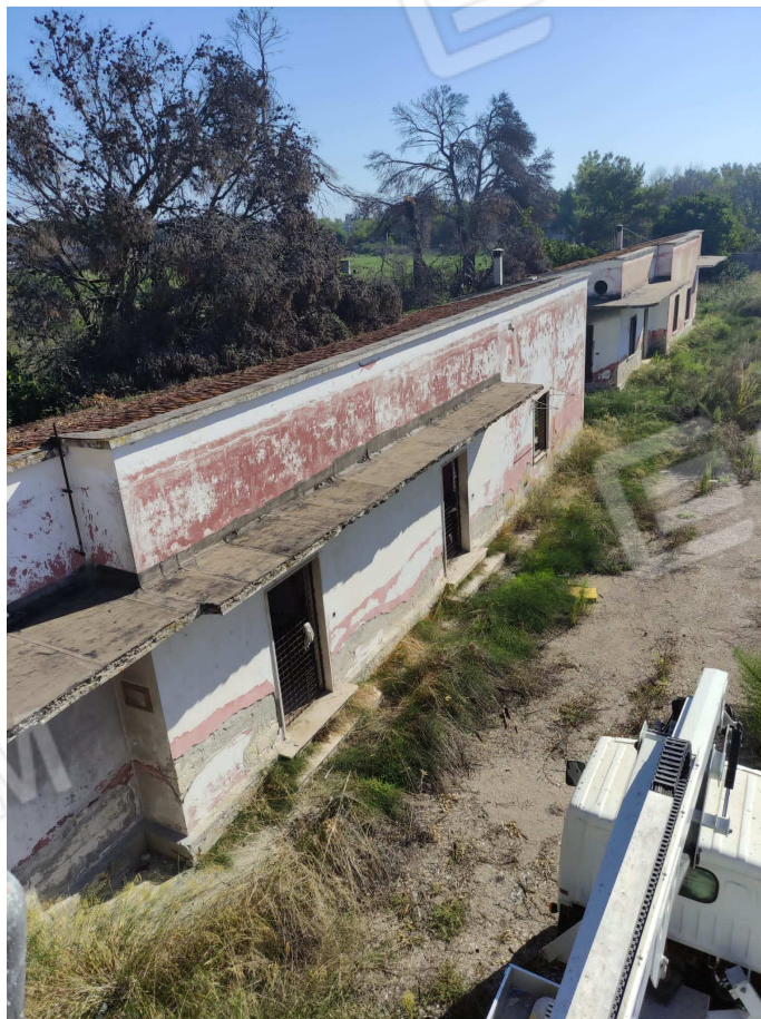
foto 8 – Metaponto, contrada Mercuragno – ex palazzina uffici e residenza f. 43 pct. 177 e 178