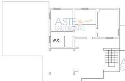
PIANO PRIMO H 2,77