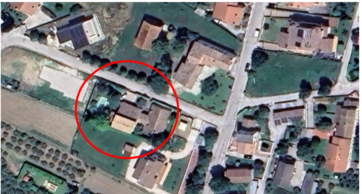
Inquadramento di dettaglio satellitare