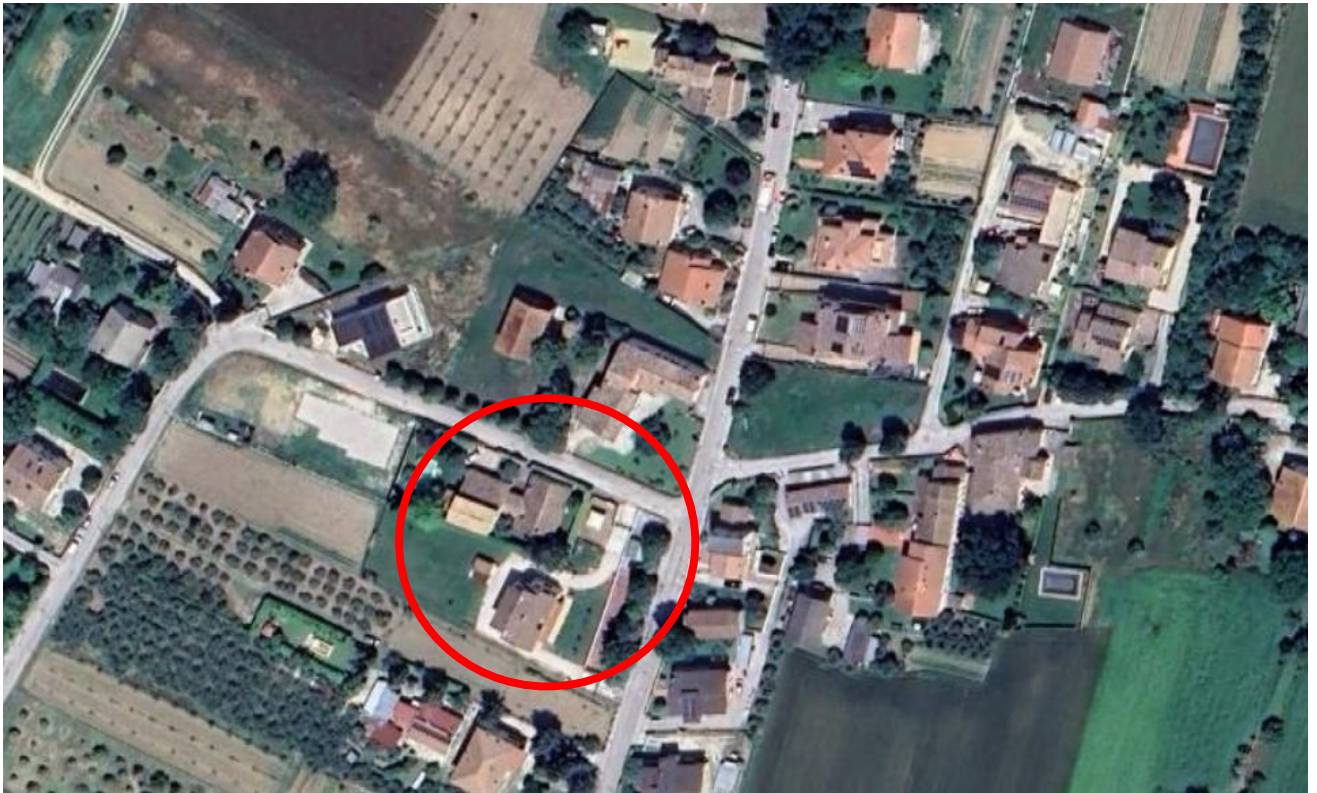
inquadramento generale satellitare