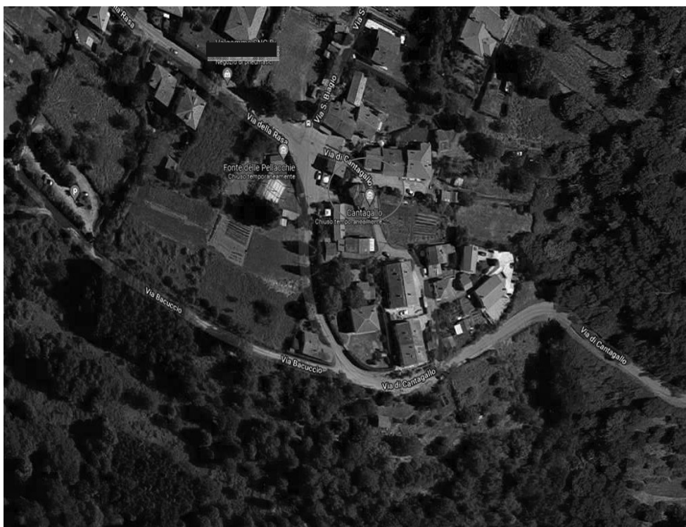
Vista Aerea del LOTTO