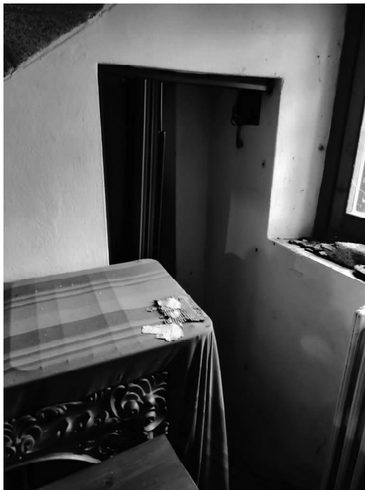
Foto 13 – Dettaglio vano scale di collegamento tra piano terra e seminterrato