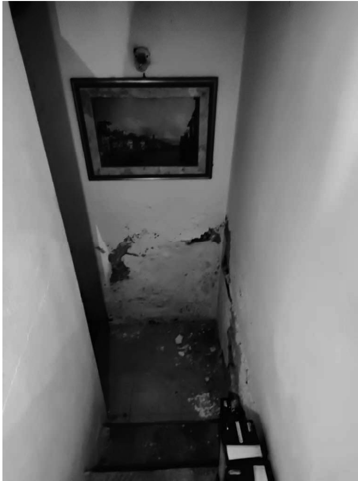
Foto 14 – Dettaglio vano scale di collegamento tra piano terra e seminterrato