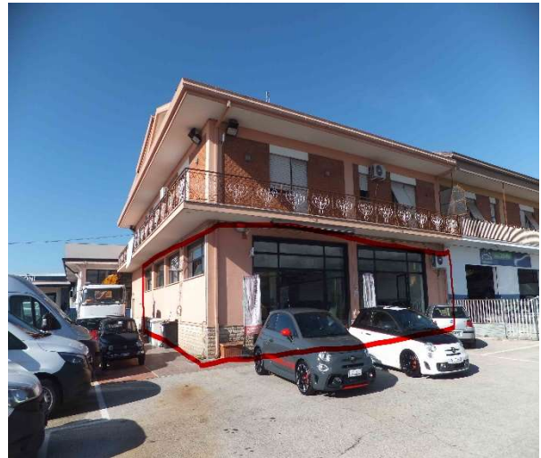
Foto 02, esterno fabbricato.