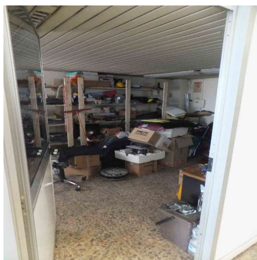
Foto 10, interno, deposito/ufficio.