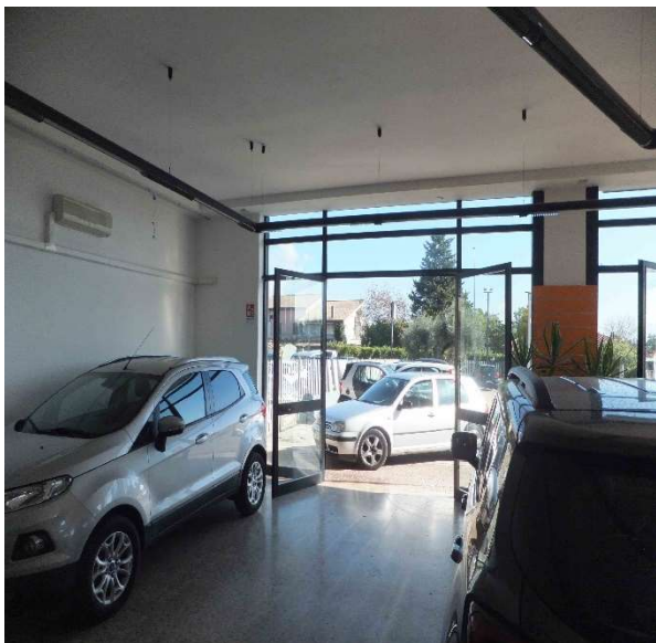
Foto 05, interno, locali.