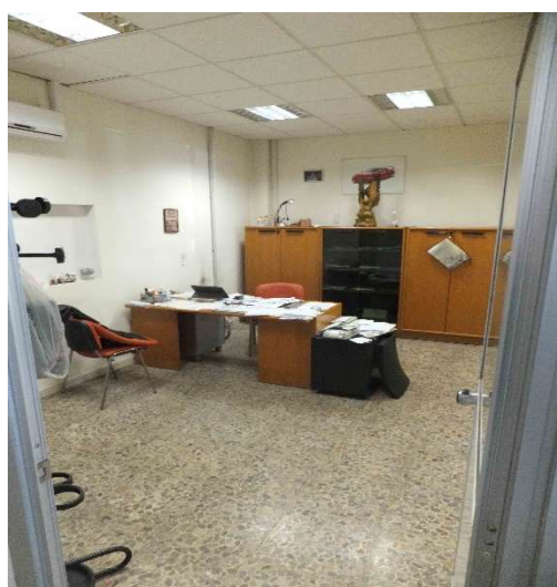
Foto 09, interno, ufficio 2.