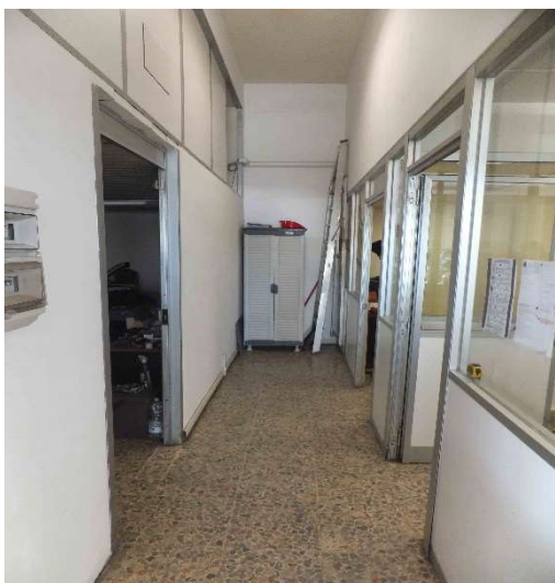
Foto 07, interno, disimpegno.