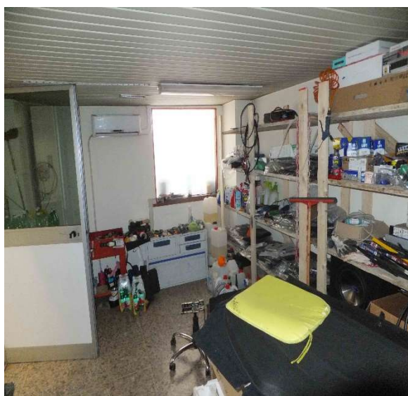
Foto 11, interno, deposito/ufficio.