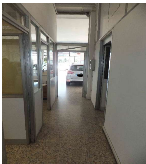
Foto 12, interno, disimpegno.