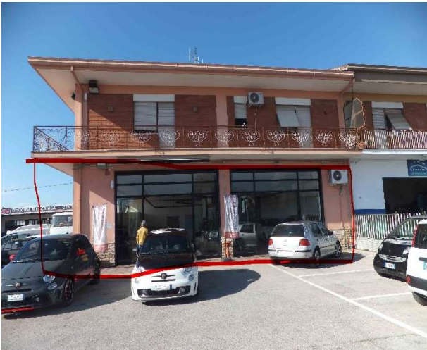
E.I. 73/2023. Foto 01, esterno fabbricato.