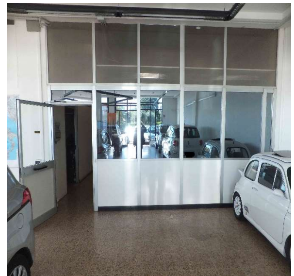
Foto 06, interno, locali.