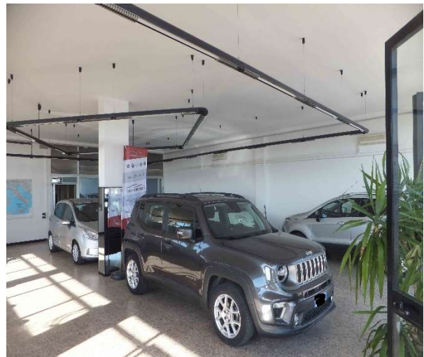
Foto 04, interno, locali.