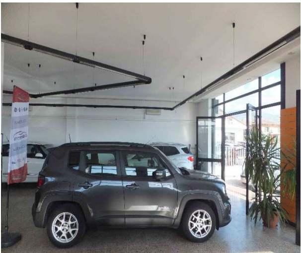
Foto 03, interno, locali.