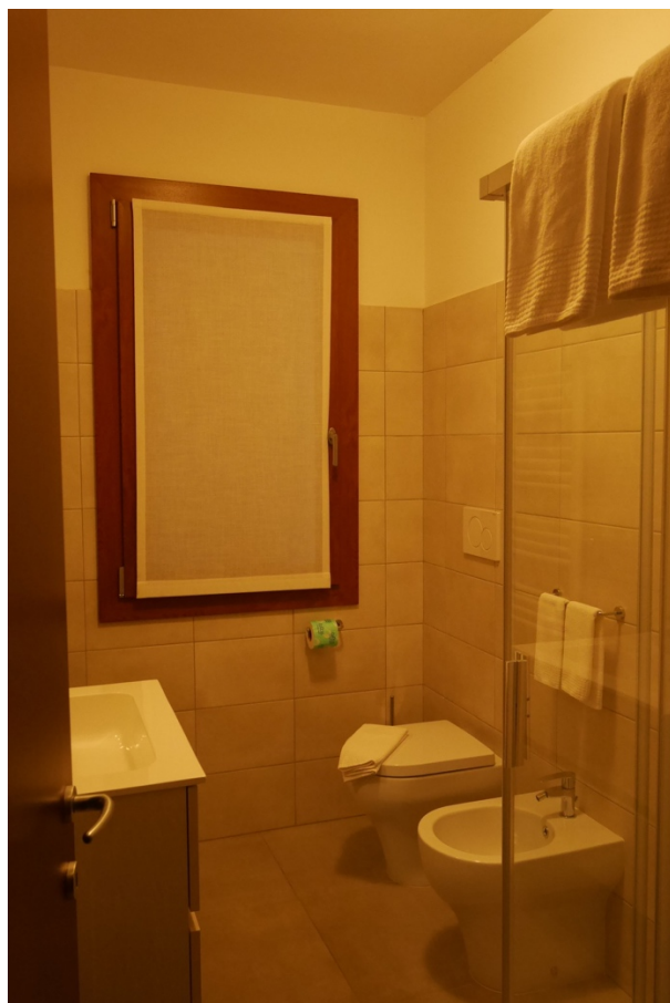
FOTO 9 - Edificio ad uso albergo. Piano primo. Uno dei bagni presenti nelle camere.