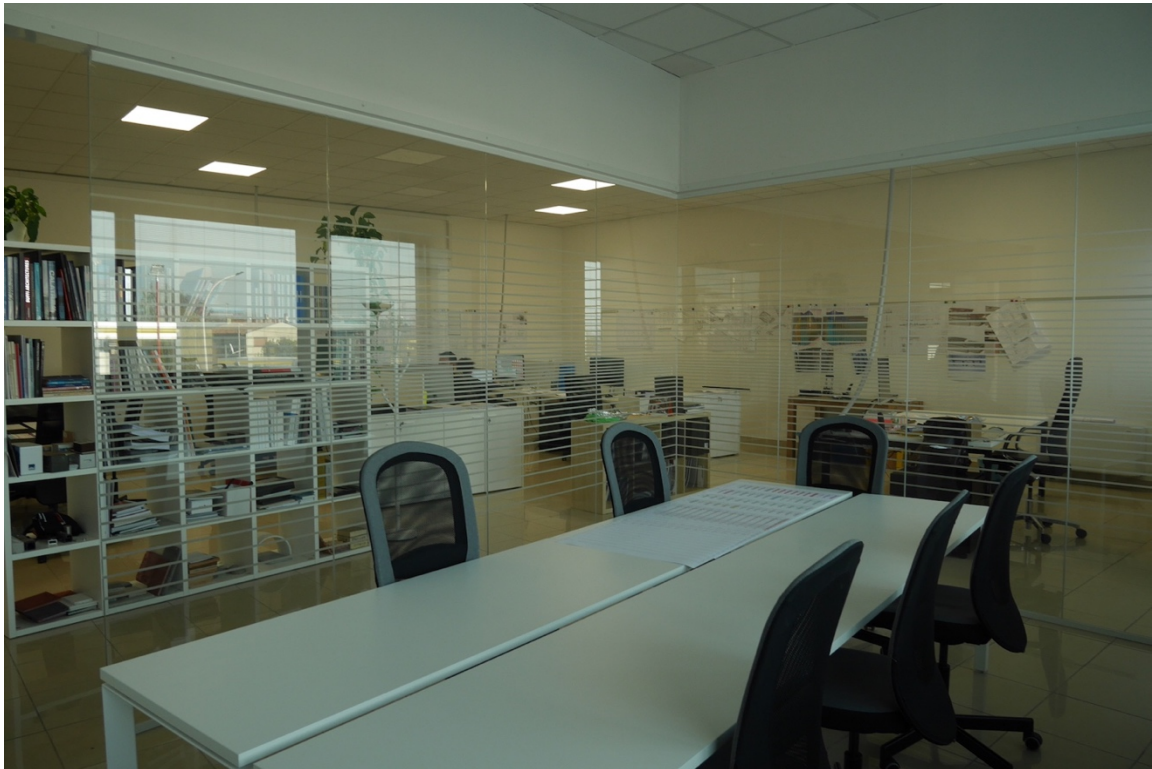
FOTO 18 - Porzione ad uso ufficio. Piano primo.