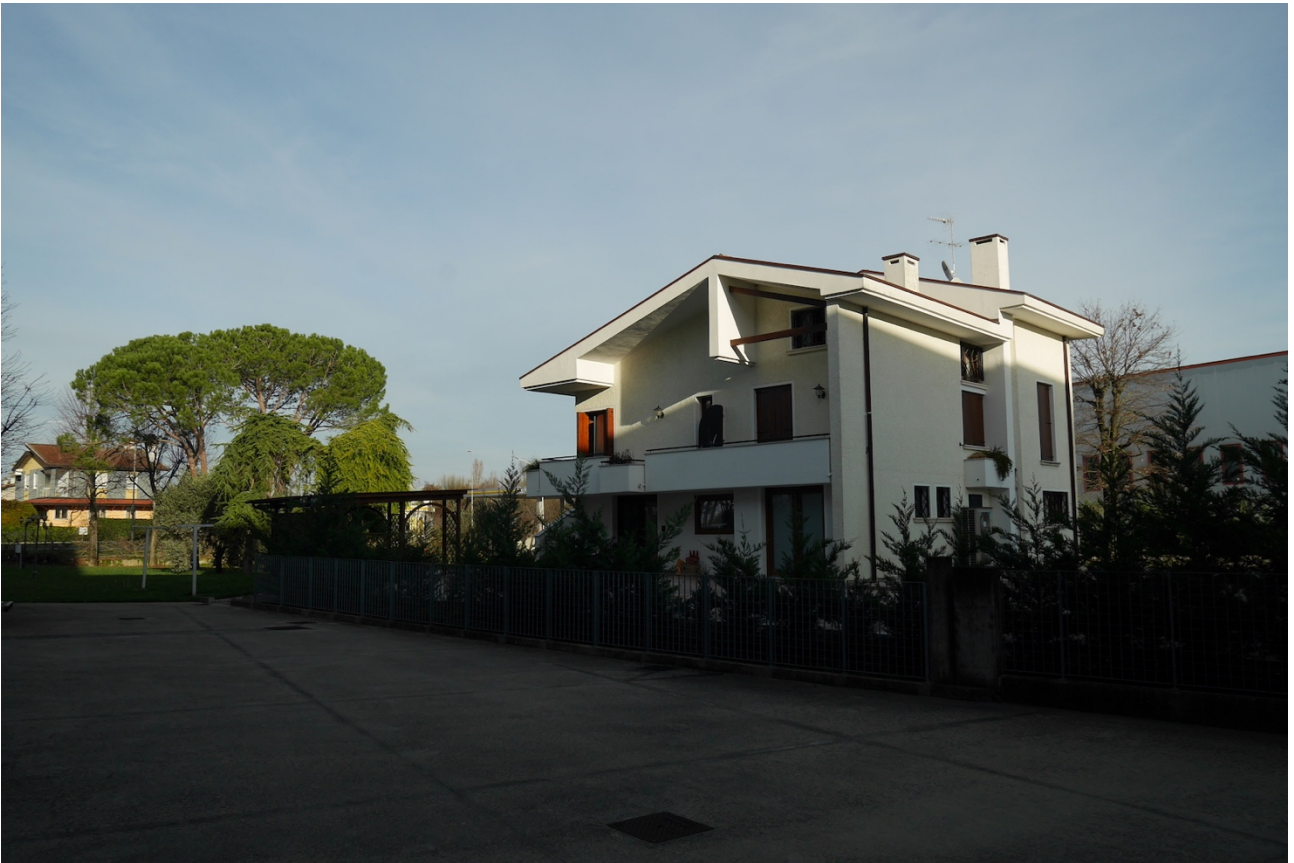
FOTO 7 - Edificio ad uso albergo.