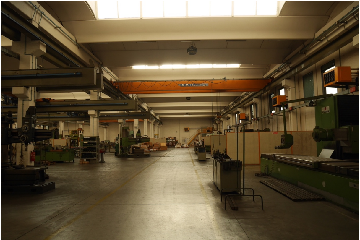
FOTO 4 - La porzione ad uso capannone.