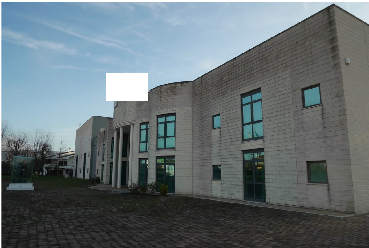
FOTO 1 - Il complesso di cui al mappale 792-883. La porzione ad uso uffici.