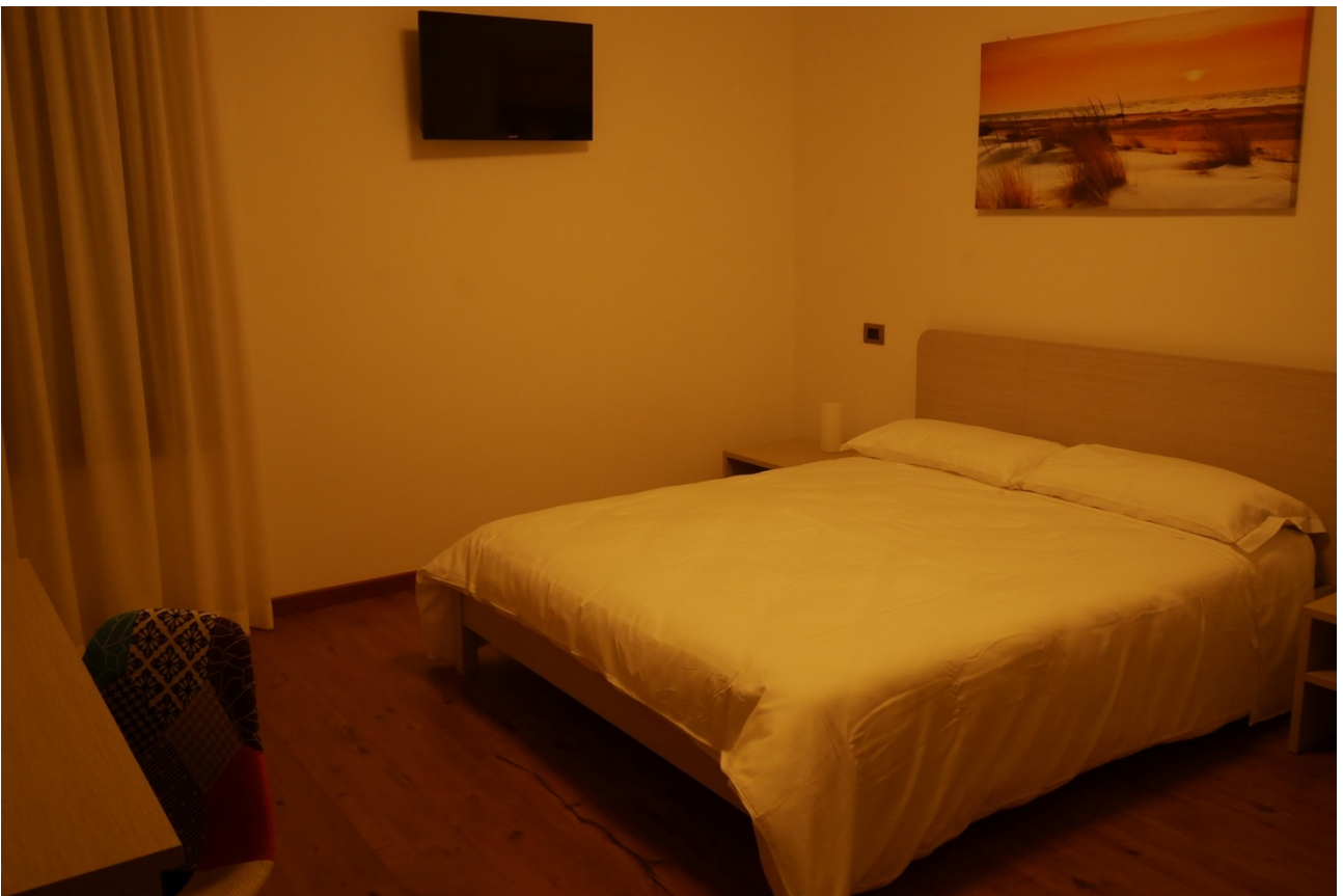
FOTO 8 - Edificio ad uso albergo. Piano primo. Una delle camere.