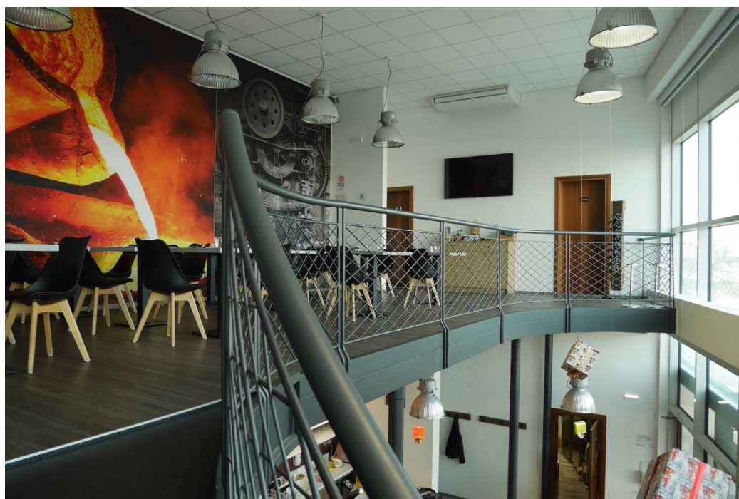
FOTO 16 - Porzione ad uso commerciale. Piano primo.