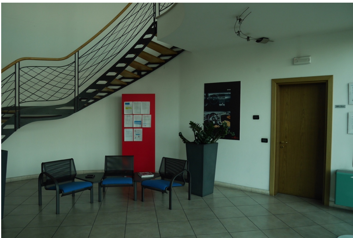
FOTO 2 - La porzione ad uso uffici. Piano terra. L'ingresso principale.