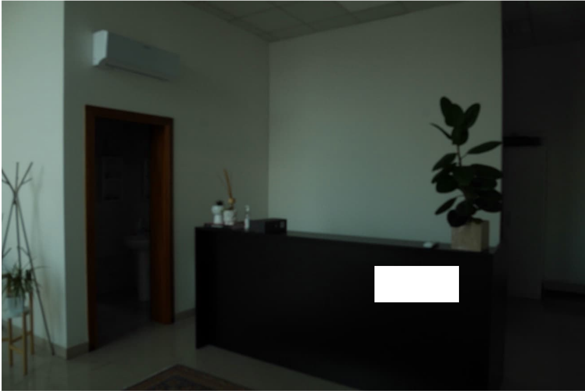
FOTO 17 - Porzione ad uso ufficio. Piano terra.