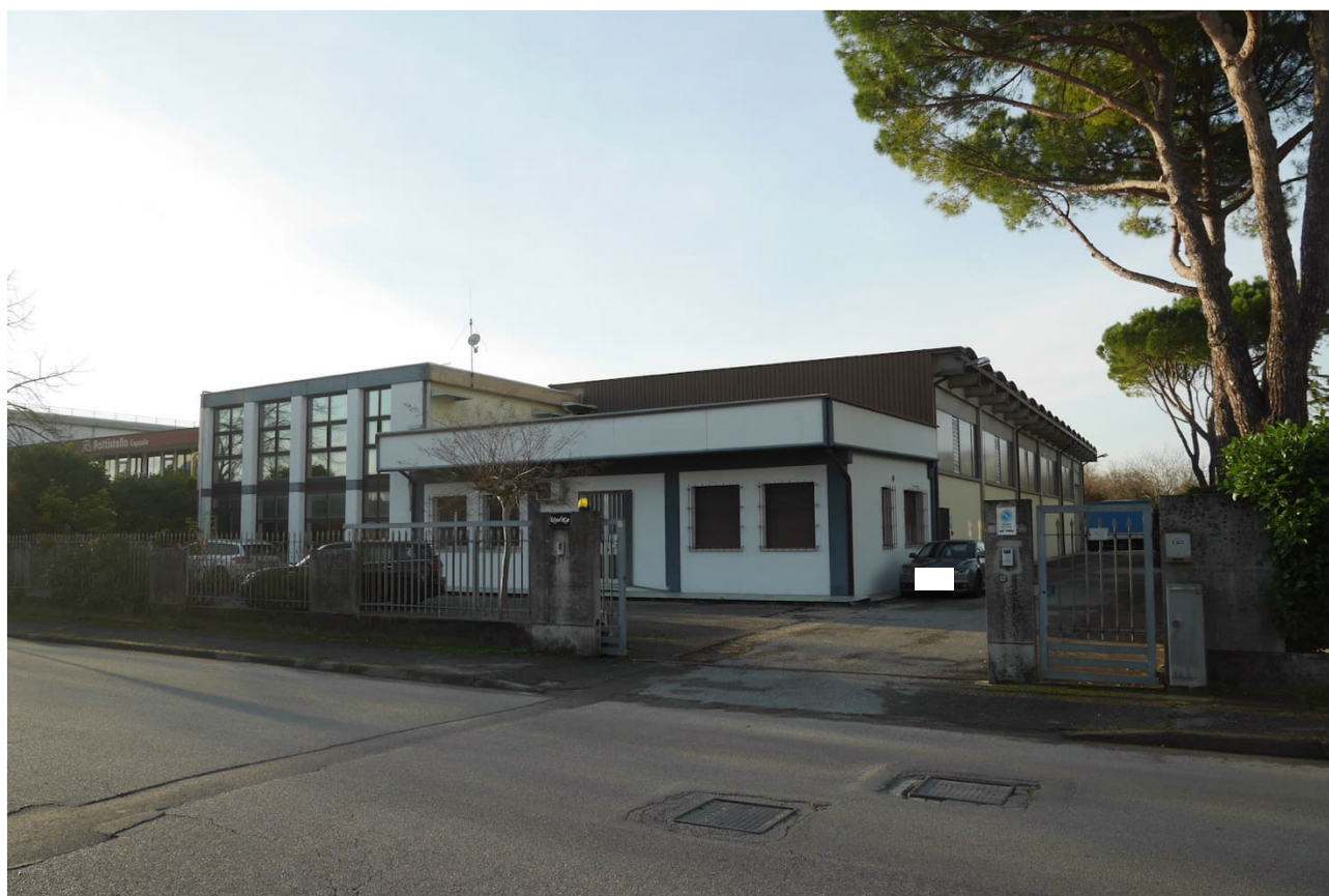
FOTO 10 - Il capannone industriale-laboratorio con relativi uffici di cui al mappale 432. L'accesso principale dalla Via 1° maggio.