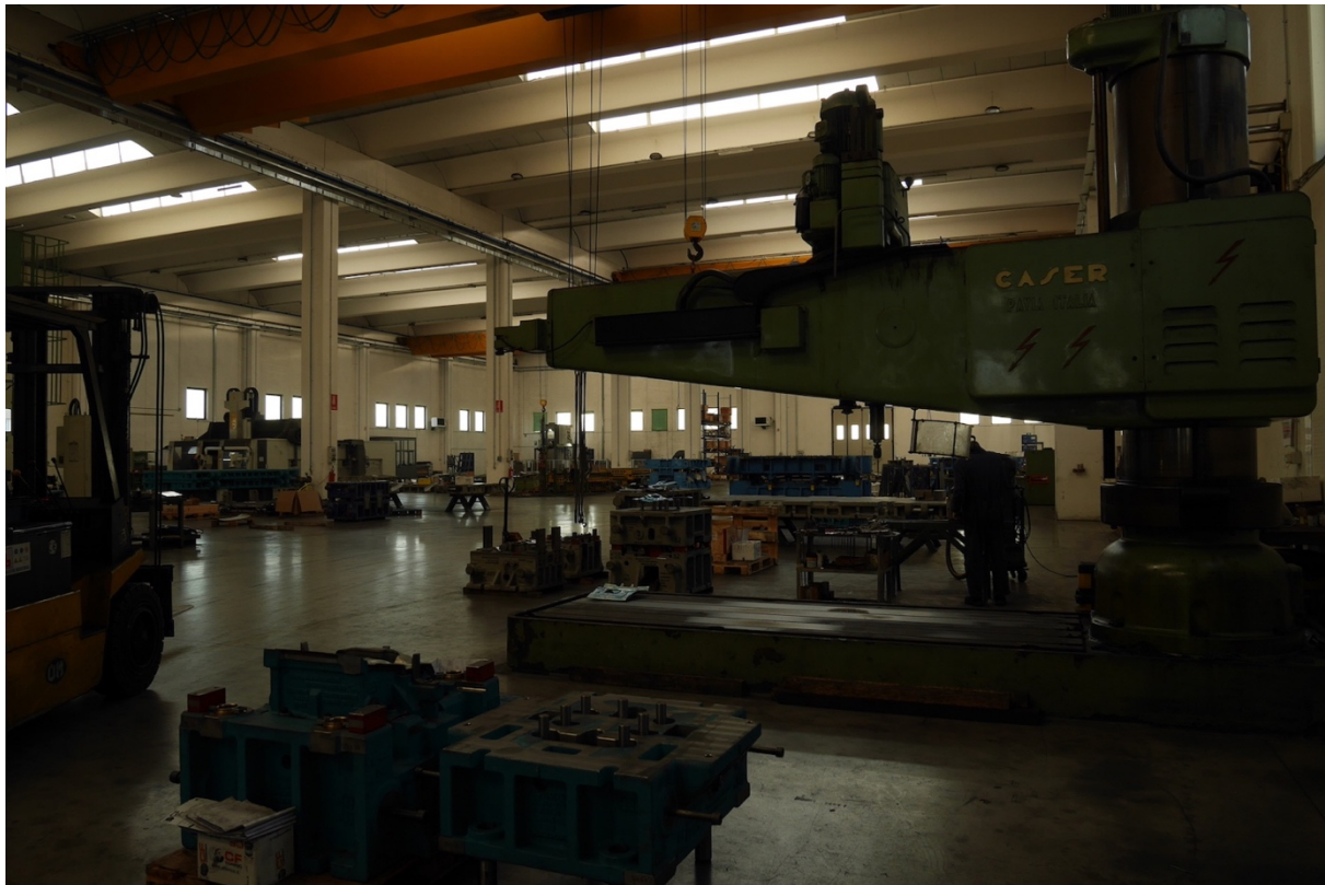
FOTO 5 - La porzione ad uso capannone.