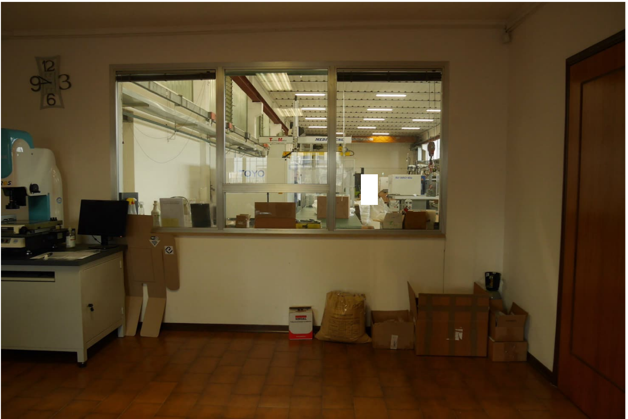
FOTO 11 - Piano terra. Locale ad uso ufficio.