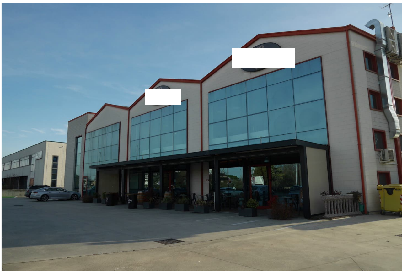
FOTO 13 - Il complesso costituito da porzione ad uso commerciale, uffici e capannone industriale di cui al mappale 833.