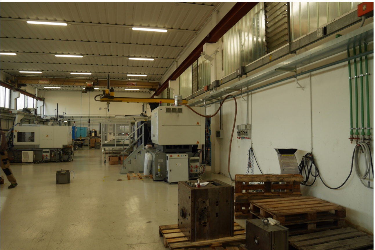
FOTO 12 - Il capannone-laboratorio.