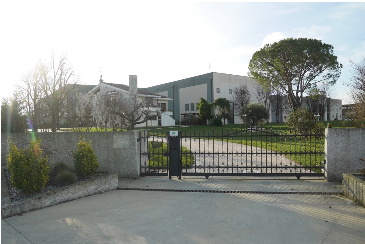
FOTO 6 - Edificio ad uso albergo di cui al mappale 655. L'accesso.