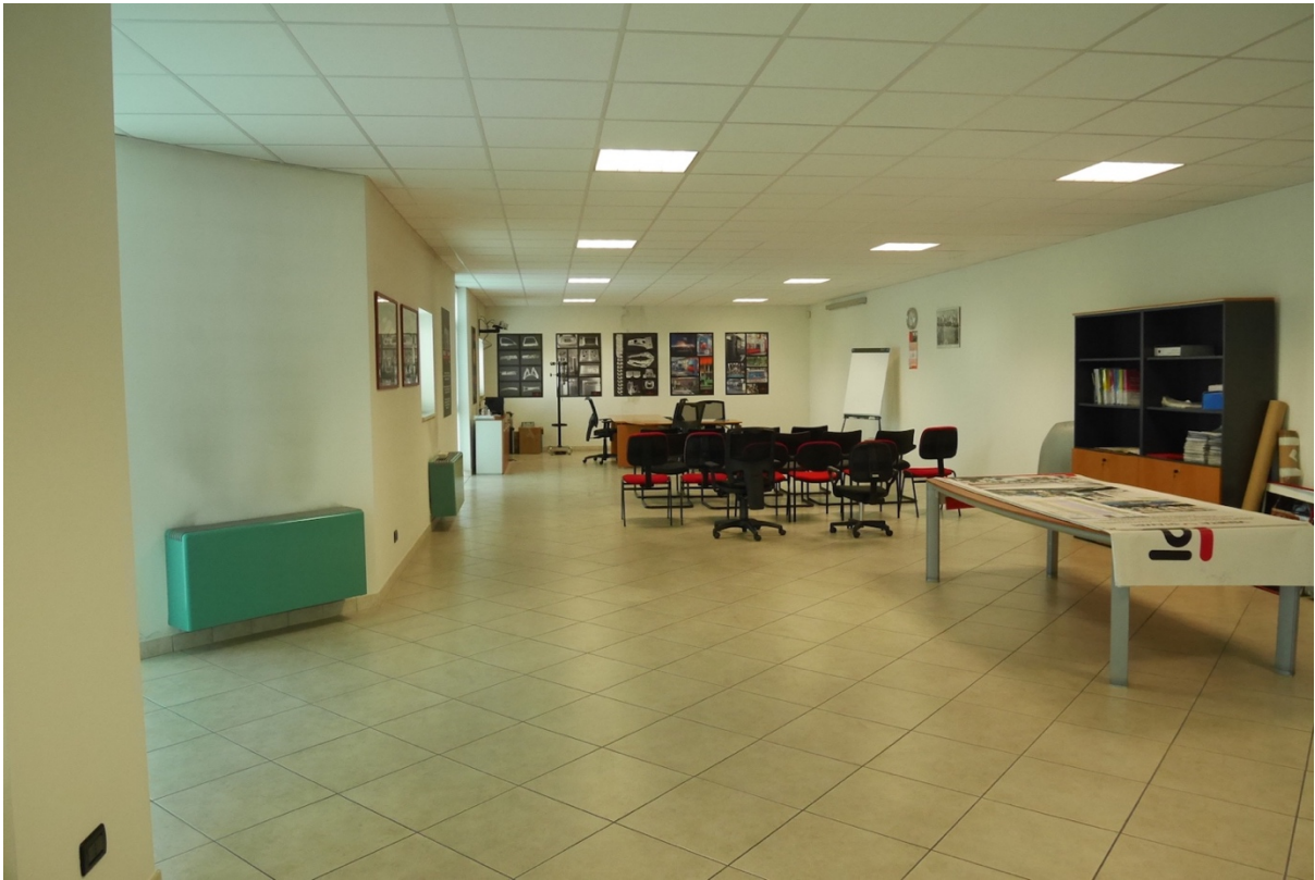
FOTO 3 - La porzione ad uso uffici. Piano primo. Sala riunioni.