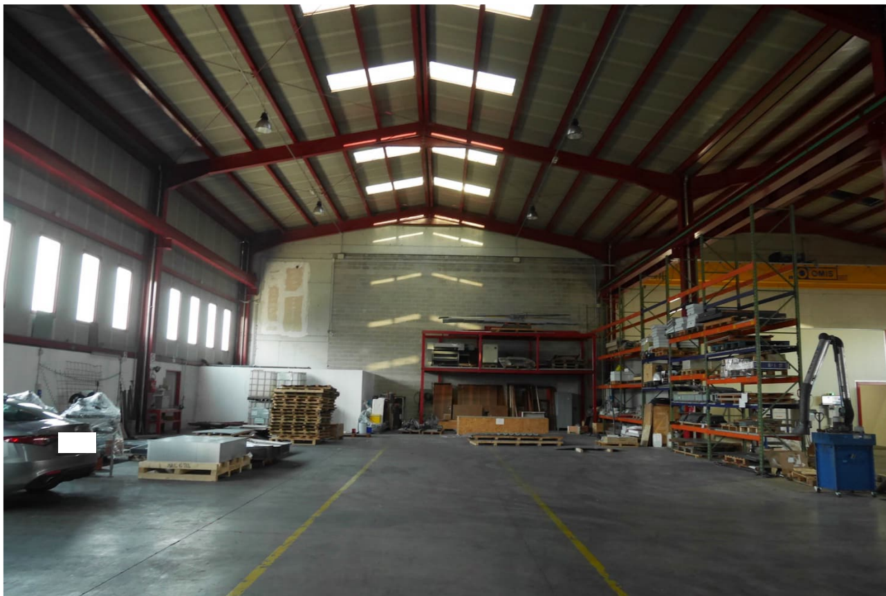
FOTO 14 - Porzione ad uso capannone industriale.