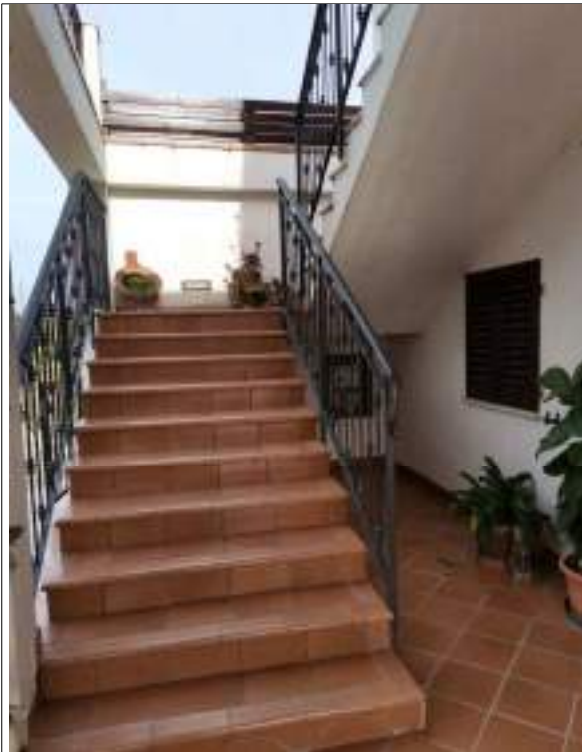
Scala accesso alla terrazza