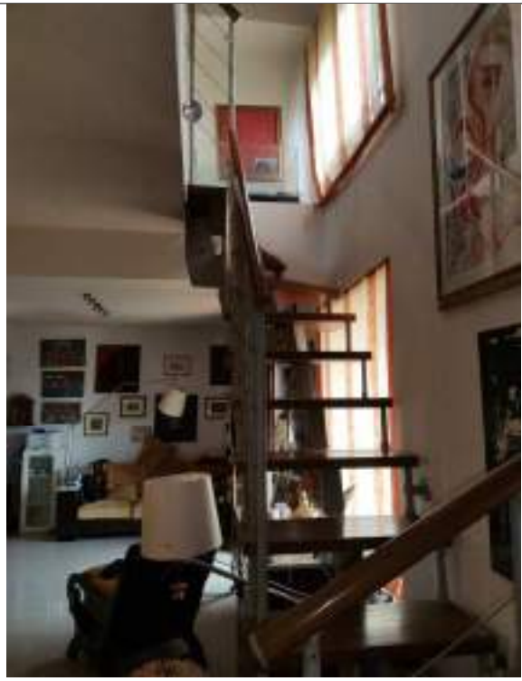
Scala di accesso al sottotetto (mansarda)