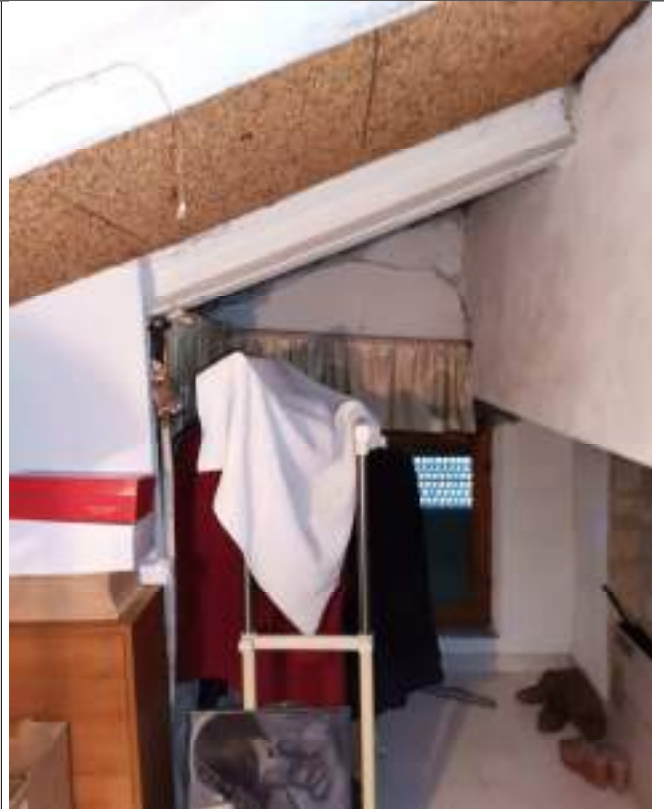
Locale sottotetto (mansarda)