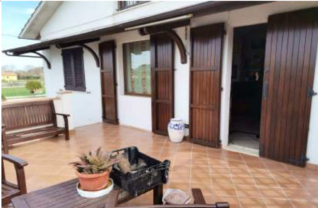
Prospetto terrazza d'ingresso