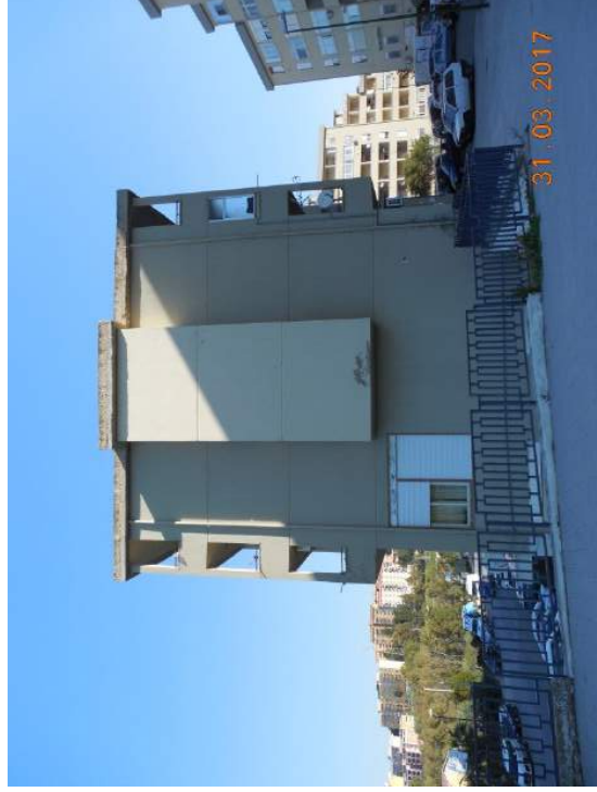
Figura 6. Prospetto sud

Firmato Da: CALAMITA ANGELO Emesso Da: ARUBAPEC S.P.A. NG CA 3 Serial#: 4a855500ae9d4b1f5e6c4ea77ec242ff