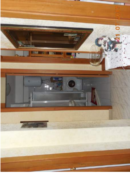
Figura 14. Zona corridoio. Notasi in fondo bagno di servizio