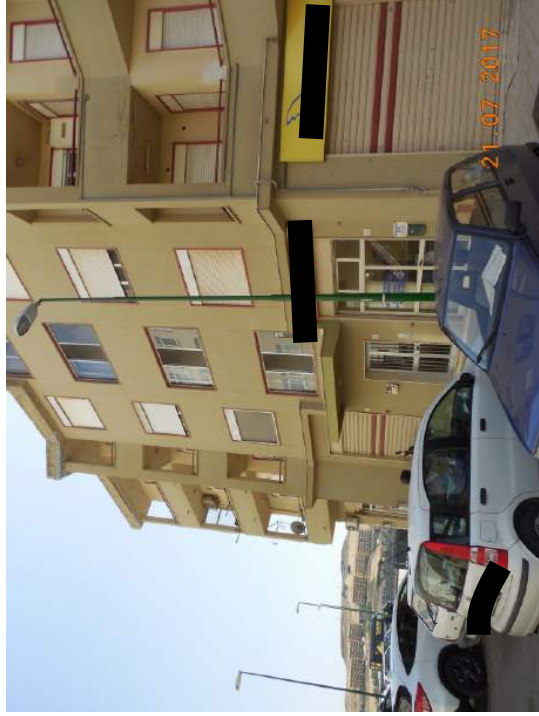
Figura 2. Vista prospettica facciata principale