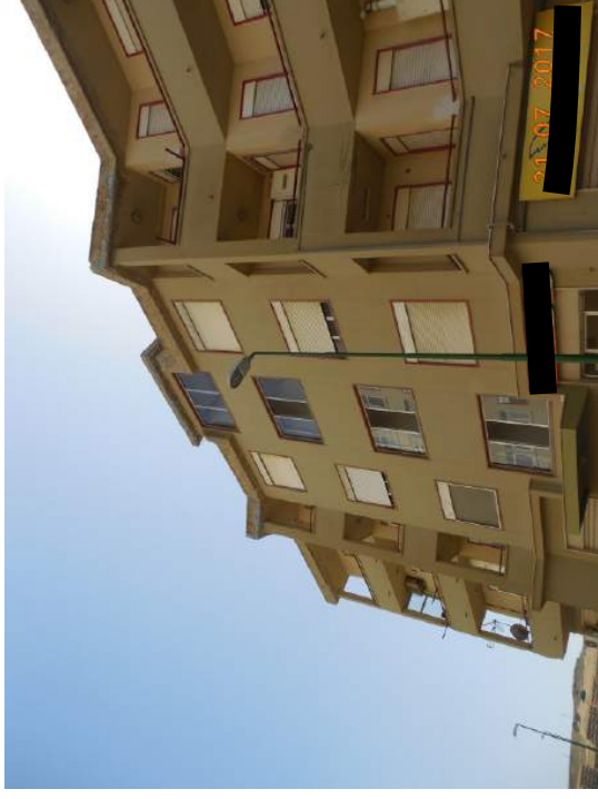
Figura 3. Vista prospettica facciata principale