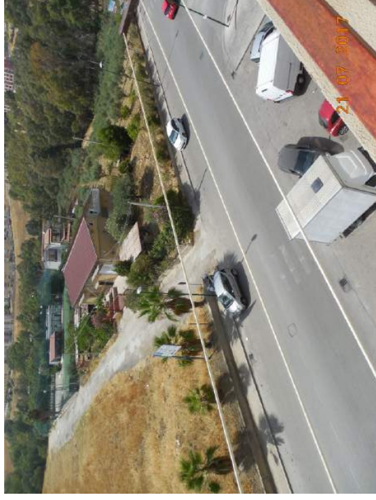
Figura 19. Vista su viale Sicilia da balcone camera da letto