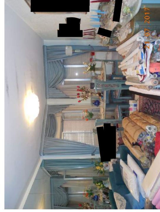
Figura 11. Salotto