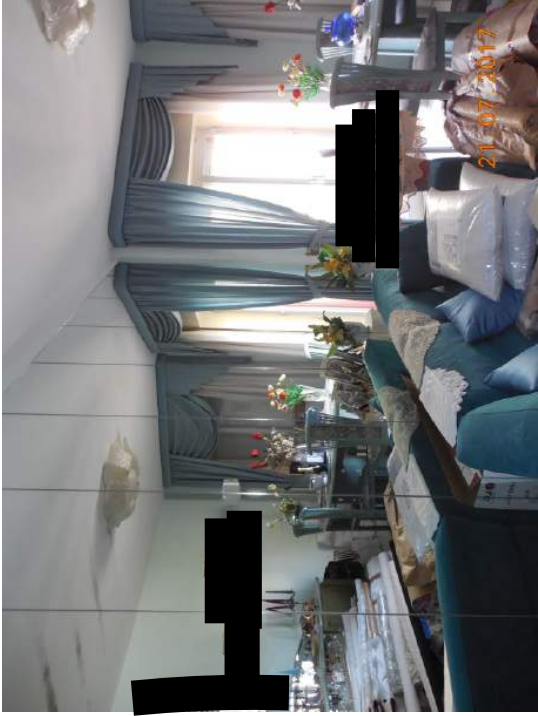
Figura 12. Particolare salotto