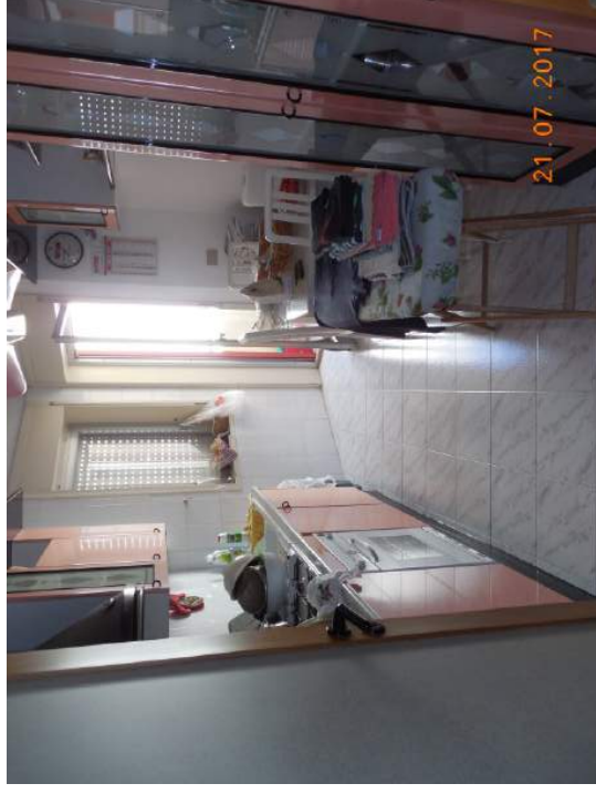
Figura 15. Cucina