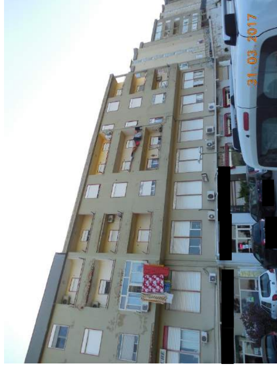
Figura 7. Prospetto ovest su viale Sicilia

Firmato Da: CALAMITA ANGELO Emesso Da: ARUBAPEC S.P.A. NG CA 3 Serial#: 4a855500ae9d4b1f5e6c4ea77ec242ff