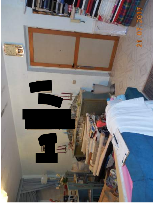
Figura 10. Ingresso e salotto