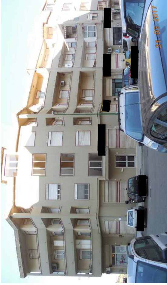
Figura 5. Veduta d'insieme complesso immobiliare