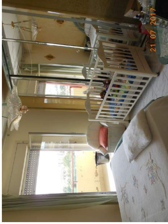
Figura 17. Camera da letto