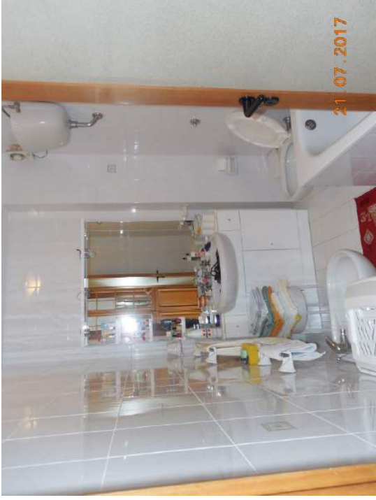
Figura 16. Bagno principale