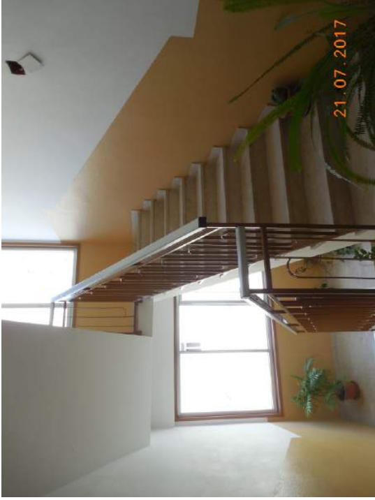
Figura 8. Vano scala condominiale