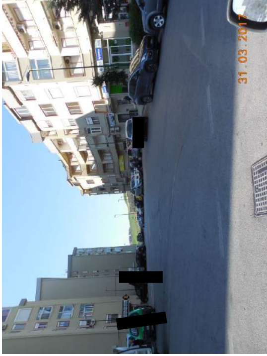
Figura 1. Zona d'accesso via Barone Celsa