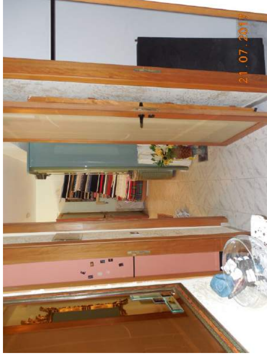
Figura 13. Zona corridoio. Notasi in fondo ingresso abitazione