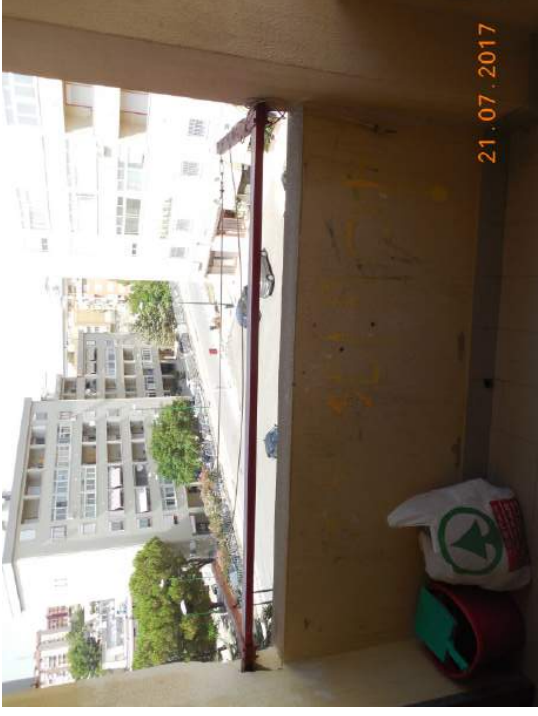
Figura 18. Vista su vie Barone Celsa e Butera da balcone salotto e cucina