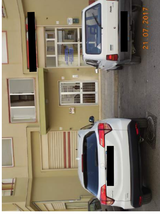
Figura 4. Particolare zona d'ingresso fabbricato