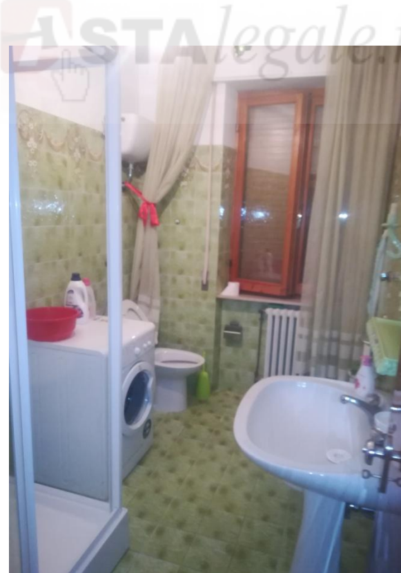
SUB. 21- PIANO PRIMO: BAGNO