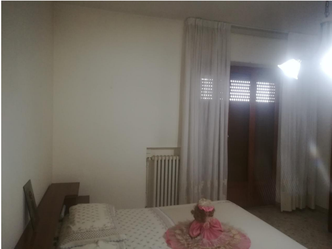
SUB. 21- PIANO PRIMO : CAMERA