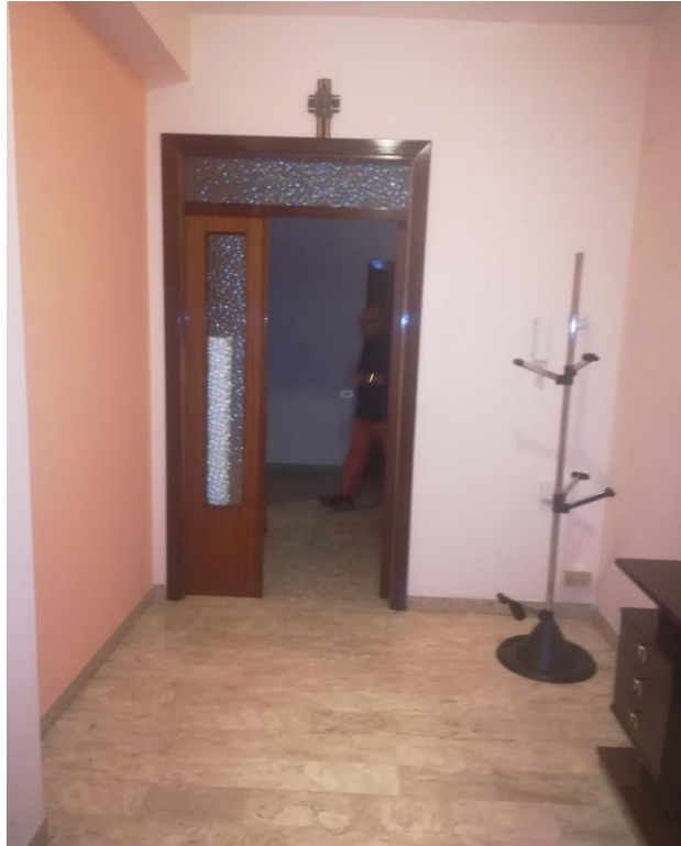
SUB. 21- PIANO PRIMO : INGRESSO