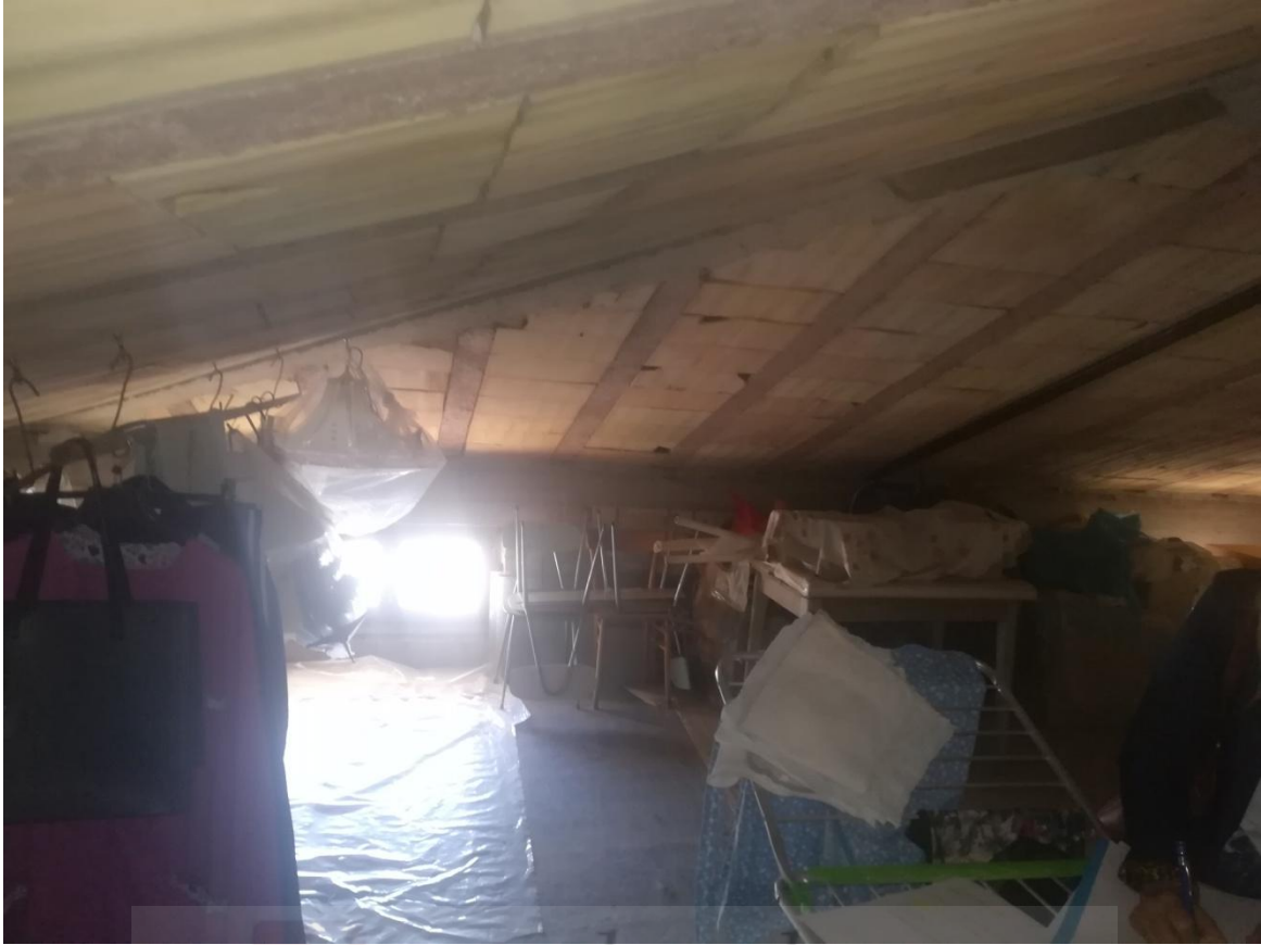
Sub. 21 - PIANO TERZO SOTTOTETTO : PORZIONE DI SOFFITTA