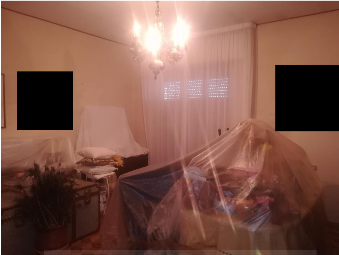
SUB. 21-PIANO PRIMO : SOGGIORNO