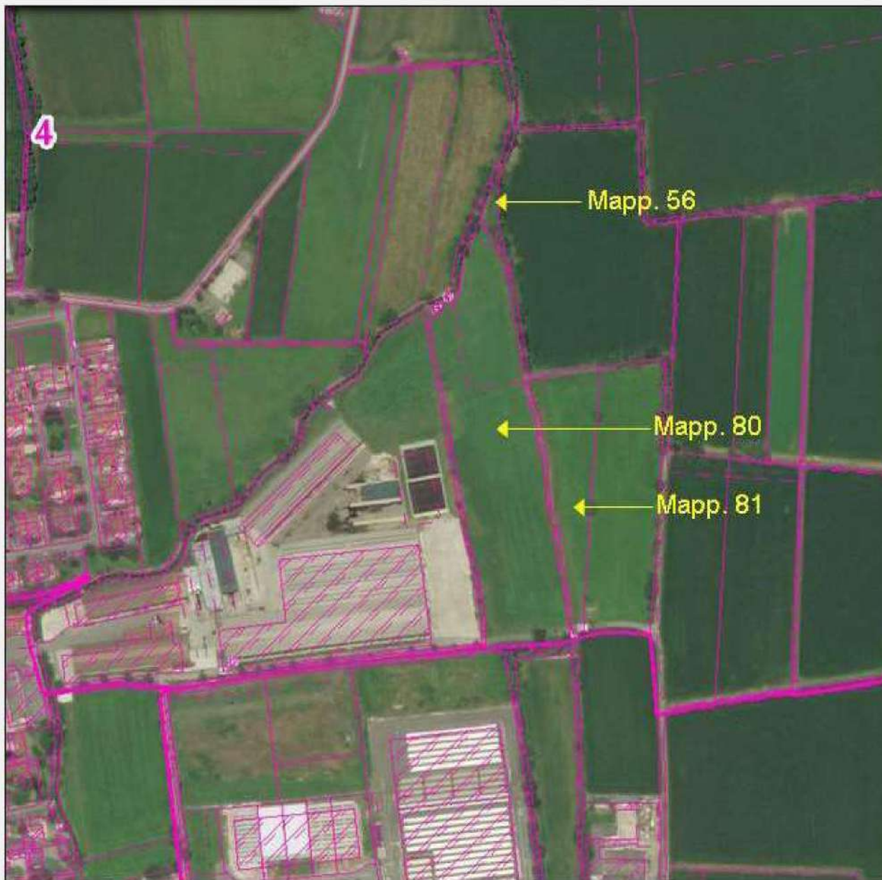
VISTA AEREA LOTTO 6