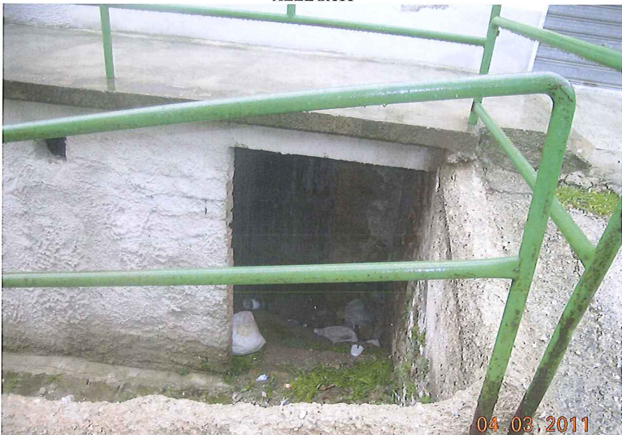
Fig.50 p.lla 2764 sub 4