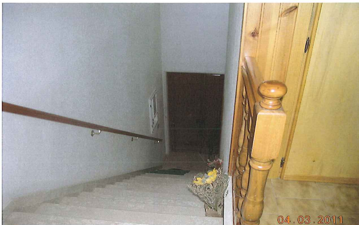
Fg.46 p.lla 503 sub 3