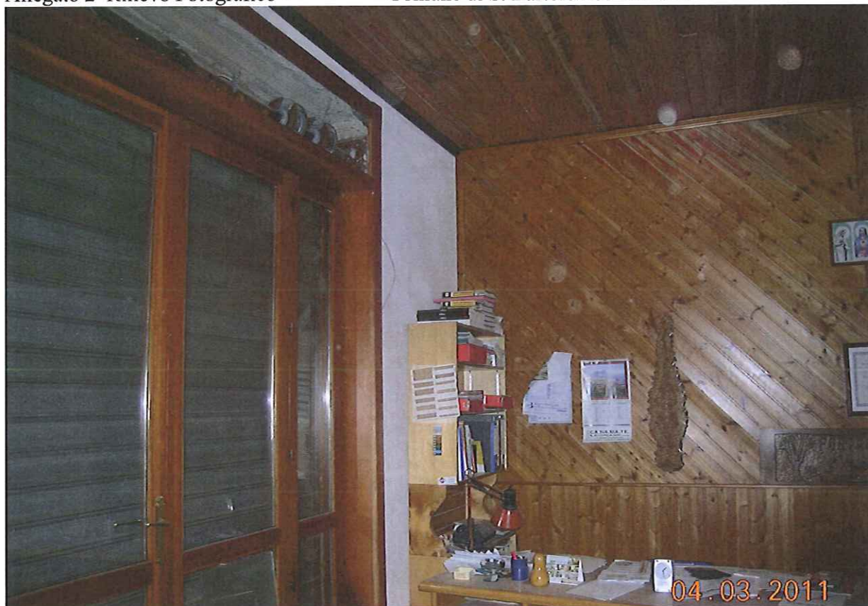
Fig. 46 p.lla 503 sub 2