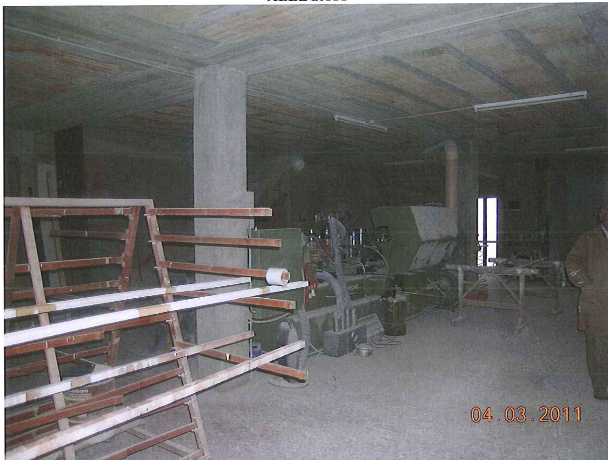
Fg.46 p.lla 503 sub 4