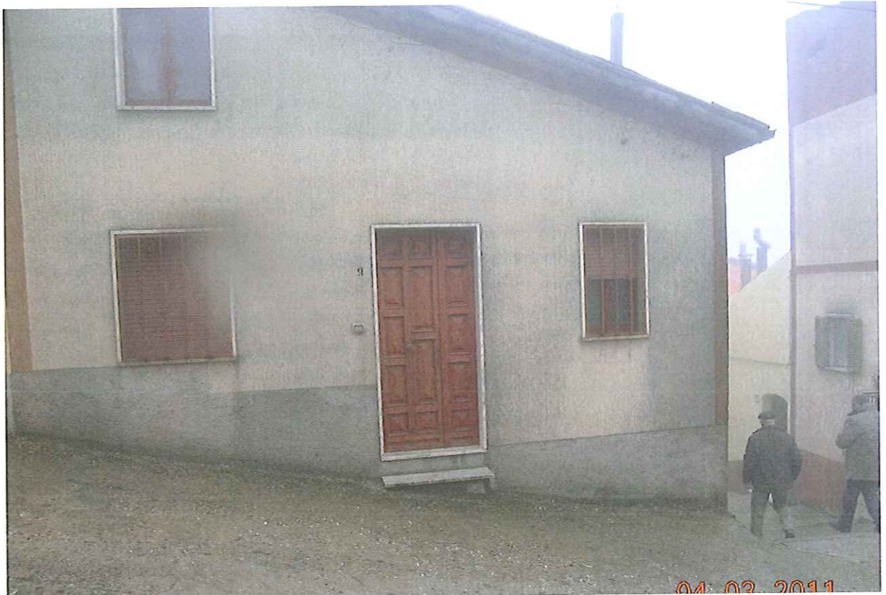
Fig. 50 p.lla 284