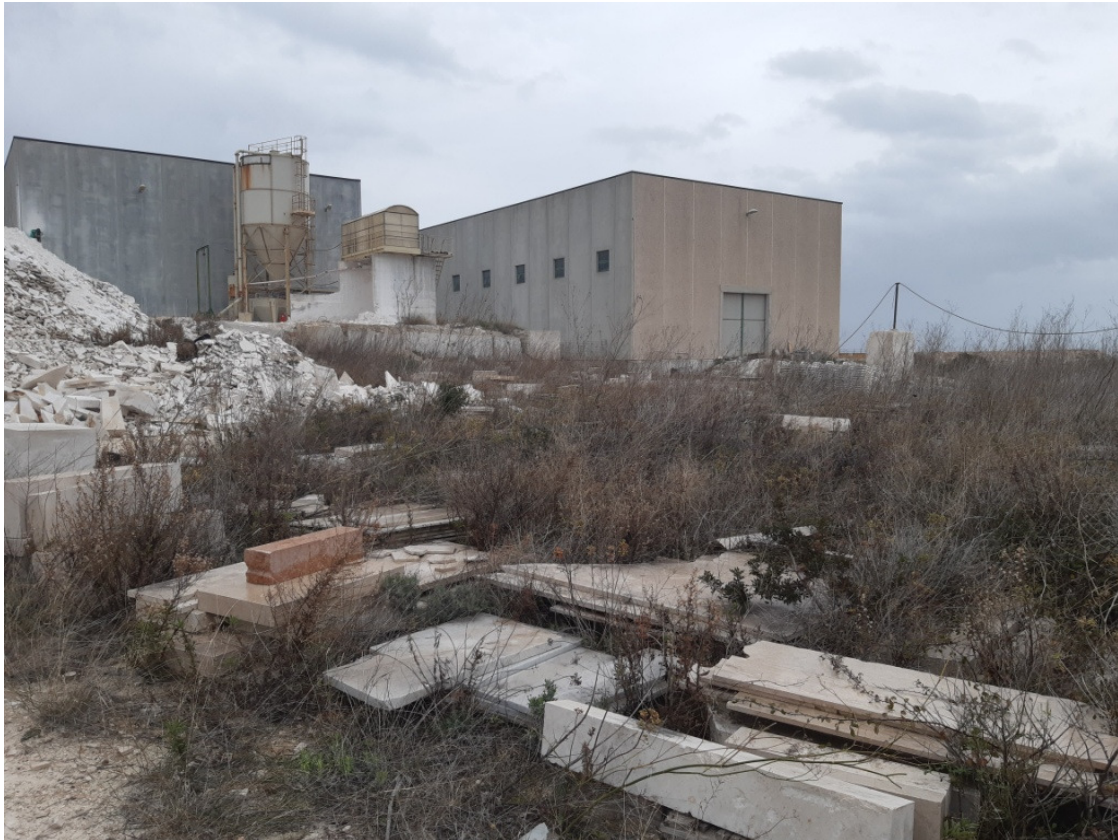
Immagine n.14 –zona sud area scarti di lavorazione