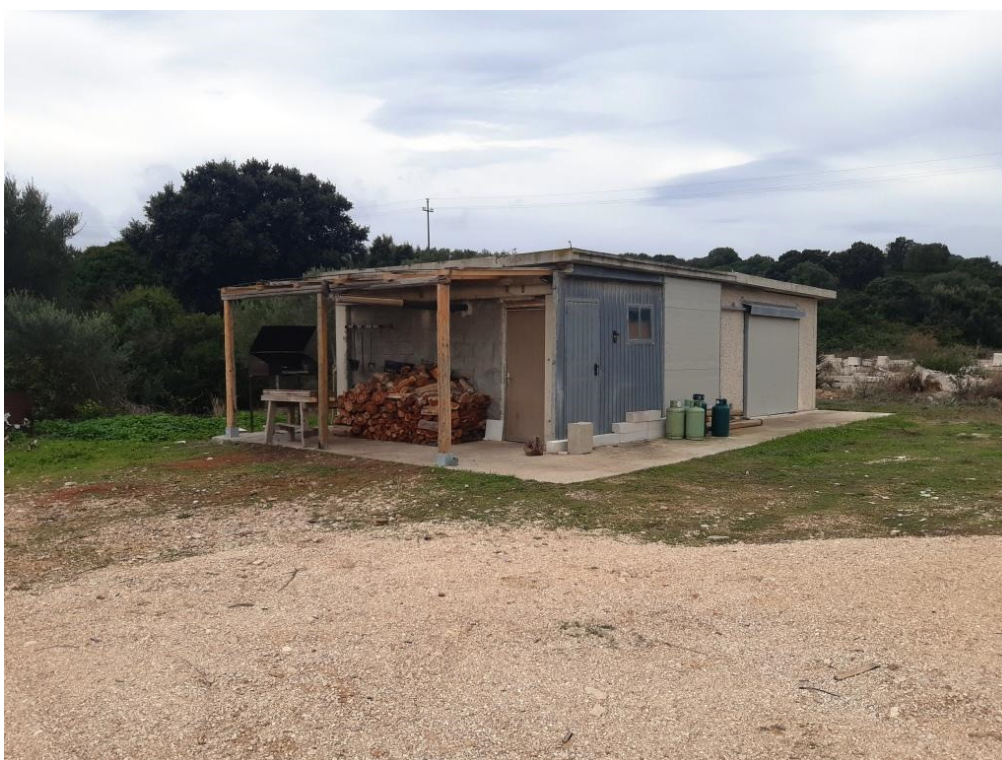
Immagine n.17 - Foto Costruzione non autorizzata di circa 50 mq