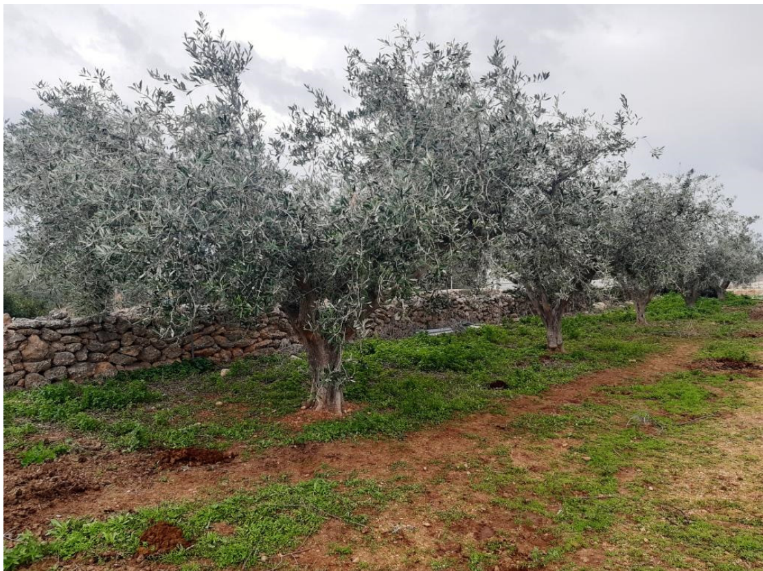
Immagine n.3 - oliveto e particolare recinzione muro a secco