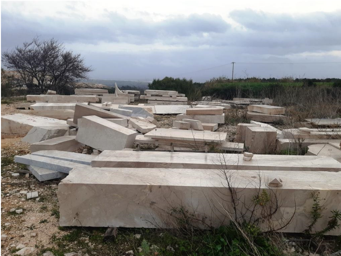
Immagine n.12 - zona sud area di deposito materiale lavorato