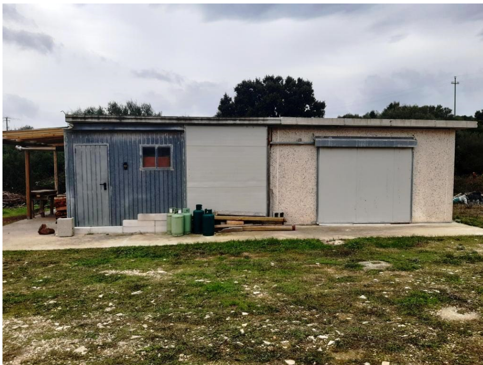
Immagine n.16 - Foto Costruzione non autorizzata di circa 50 mq