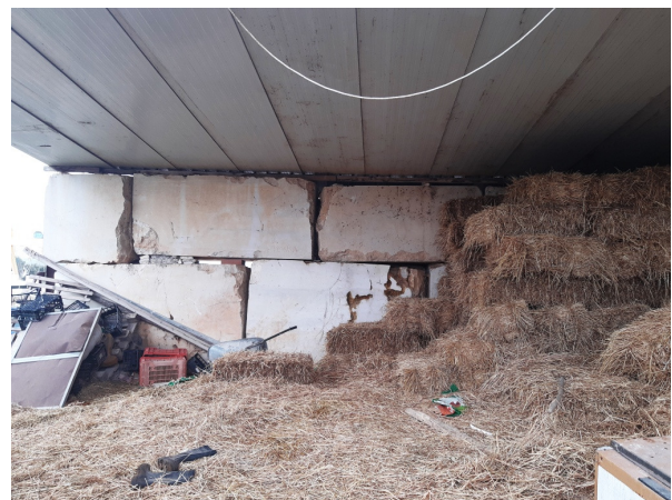
Immagini n.5 e 6 - Foto 4 fabbricato non autorizzato