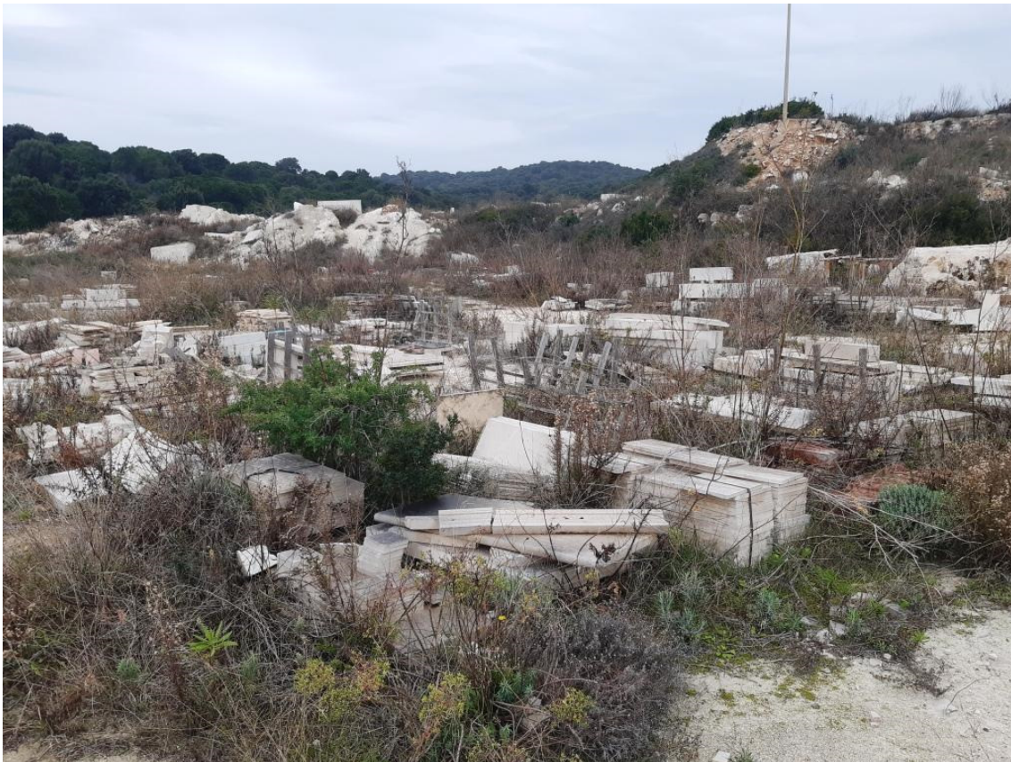
Immagine n.13 - zona sud area di deposito materiale lavorato