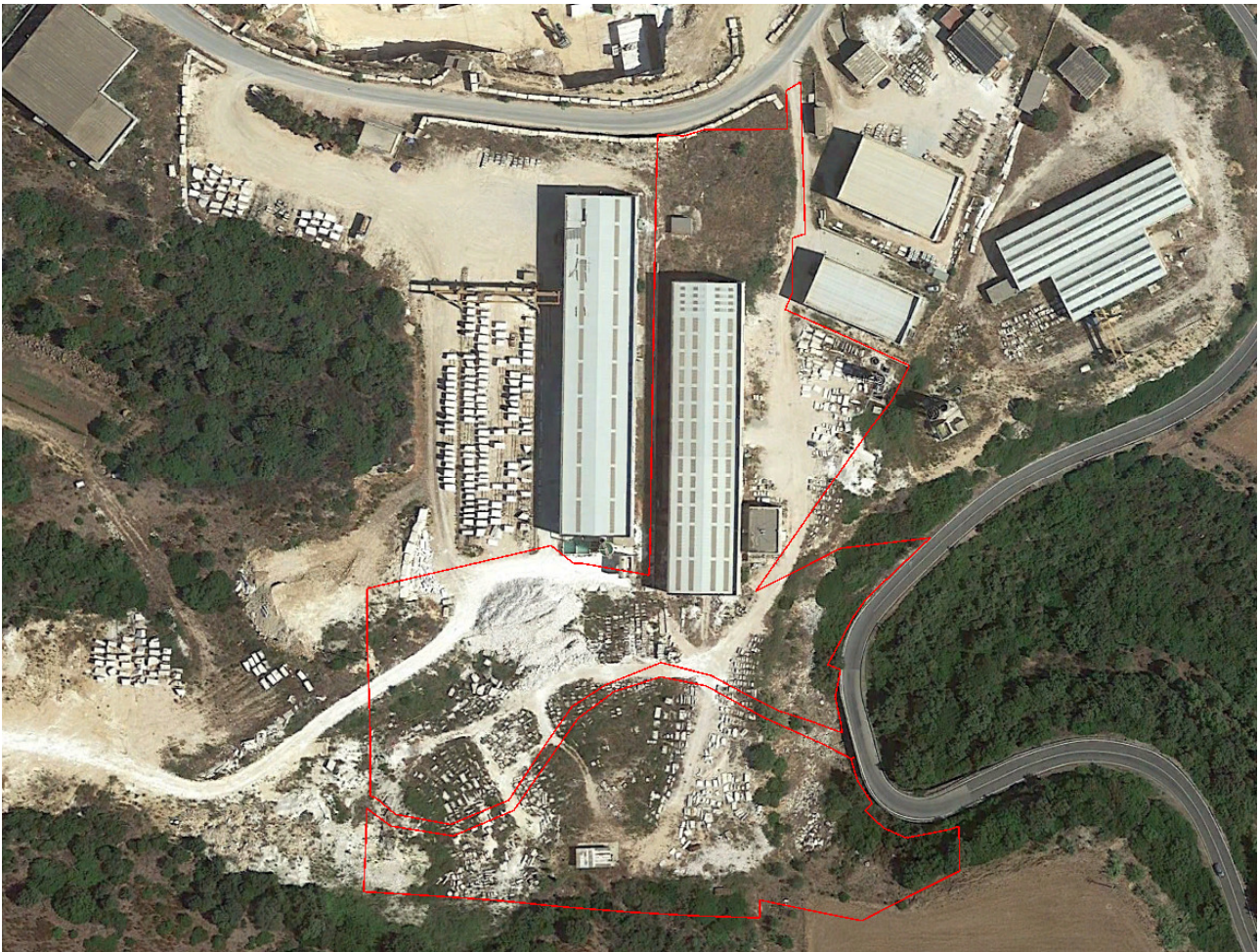
Immagine n.7 - Foto aerea area industriale/artigianale

Il terreno non risulta delimitato da recinzioni lungo tutto il suo perimetro.