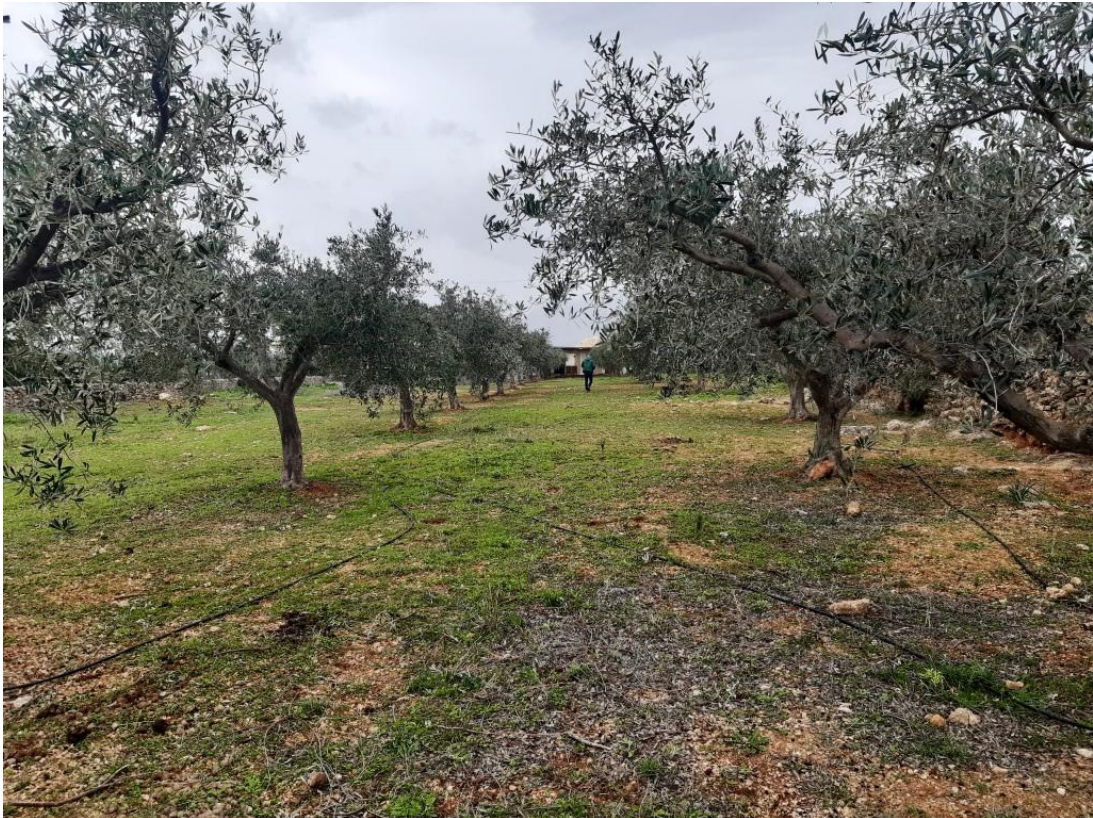
Immagine n.2 - Foto oliveto