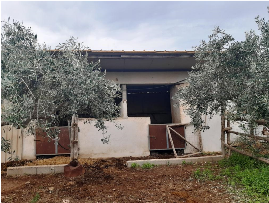
Immagine n.4 - fabbricato non autorizzato

Nella zona sud del terreno, insiste una costruzione non autorizzata di superficie complessiva pari a circa 200 mq. La costruzione, realizzata con sommaria maestria, risulta ubicata in parte nella particella oggetto di stima ed in parte nelle particelle confinanti, ovvero le n. 636, 638, 664 del medesimo foglio di mappa.