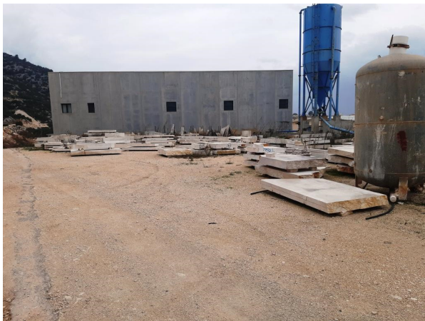
Immagine n.10 - Piazzale capannone