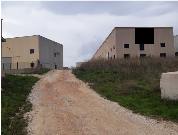
Immagine n.8 - Entrata lotto terreno

Nella zona sud, insiste una costruzione non autorizzata (immagini n.16 e 17) di superficie pari a circa 50 mq.