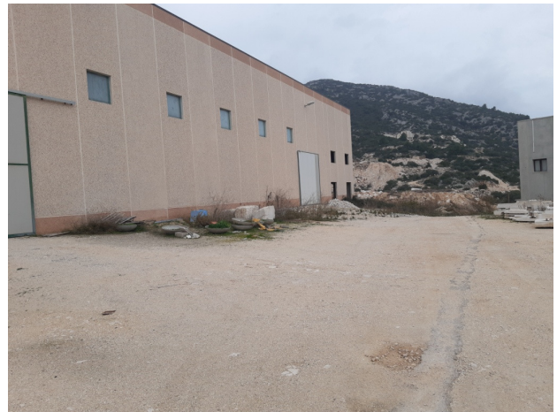
Immagine n.9 - piazzale capannone (est)