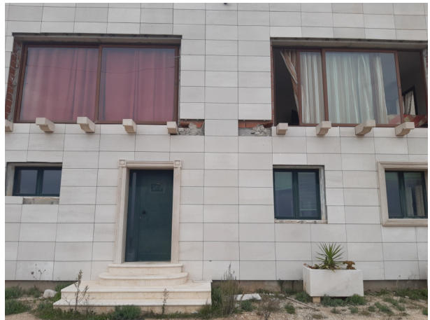
Immagine n.11 - entrata uffici (est)