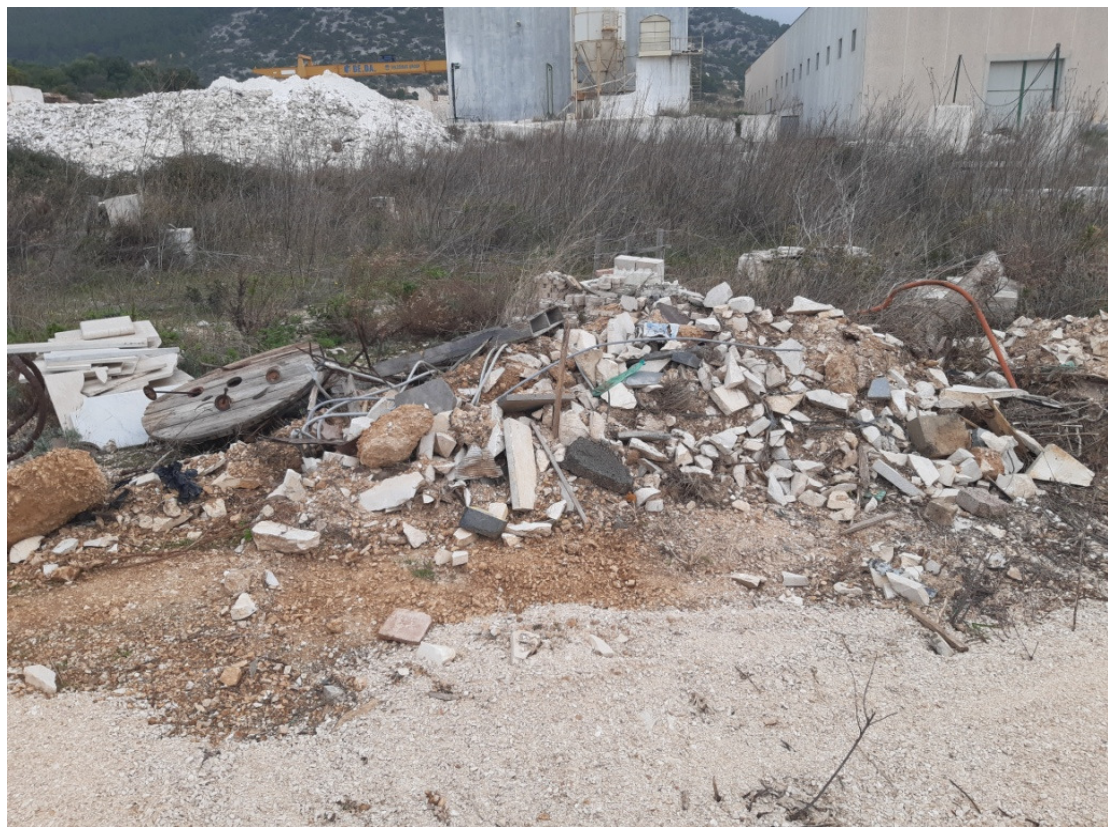
Immagine n.15 - zona sud area scarti di lavorazione