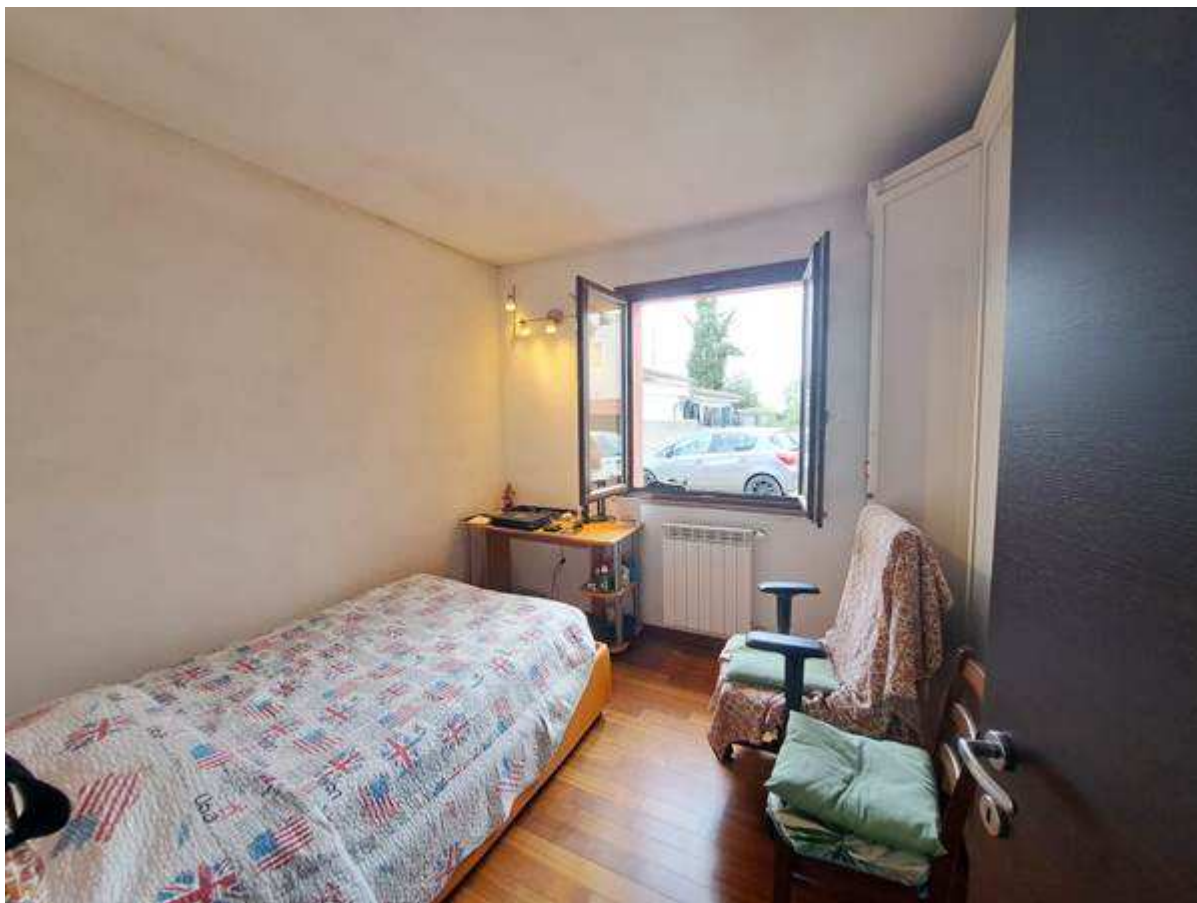
8. Vista interna alla camera singola