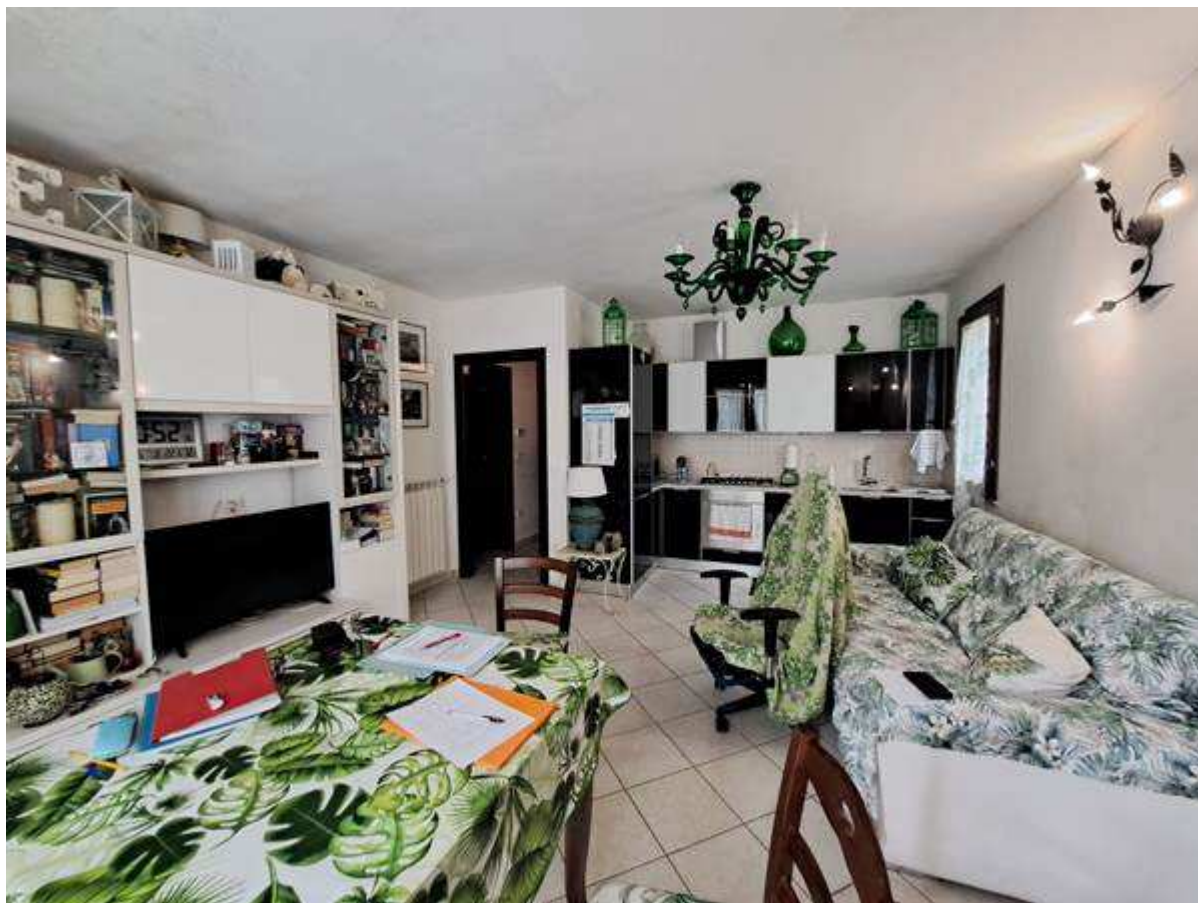
6. Vista interna al soggiorno - pranzo – zona cottura