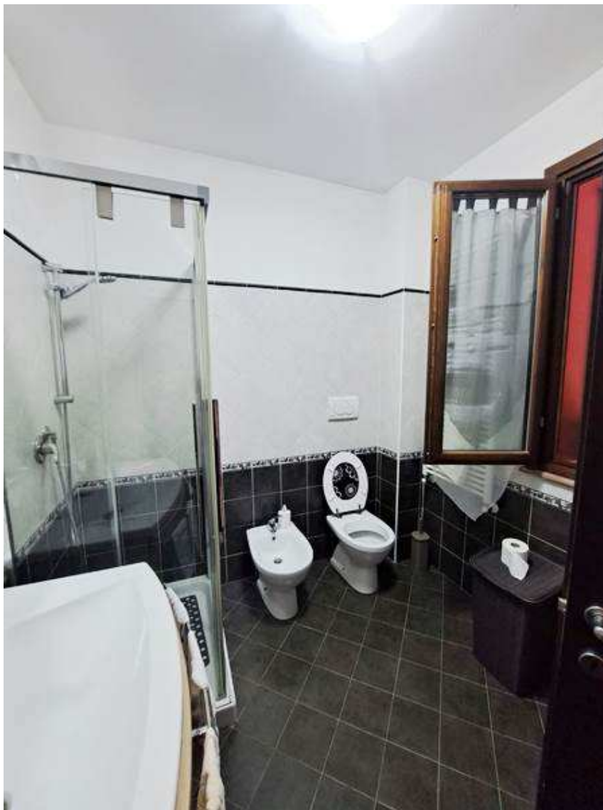
9. Vista interna al bagno