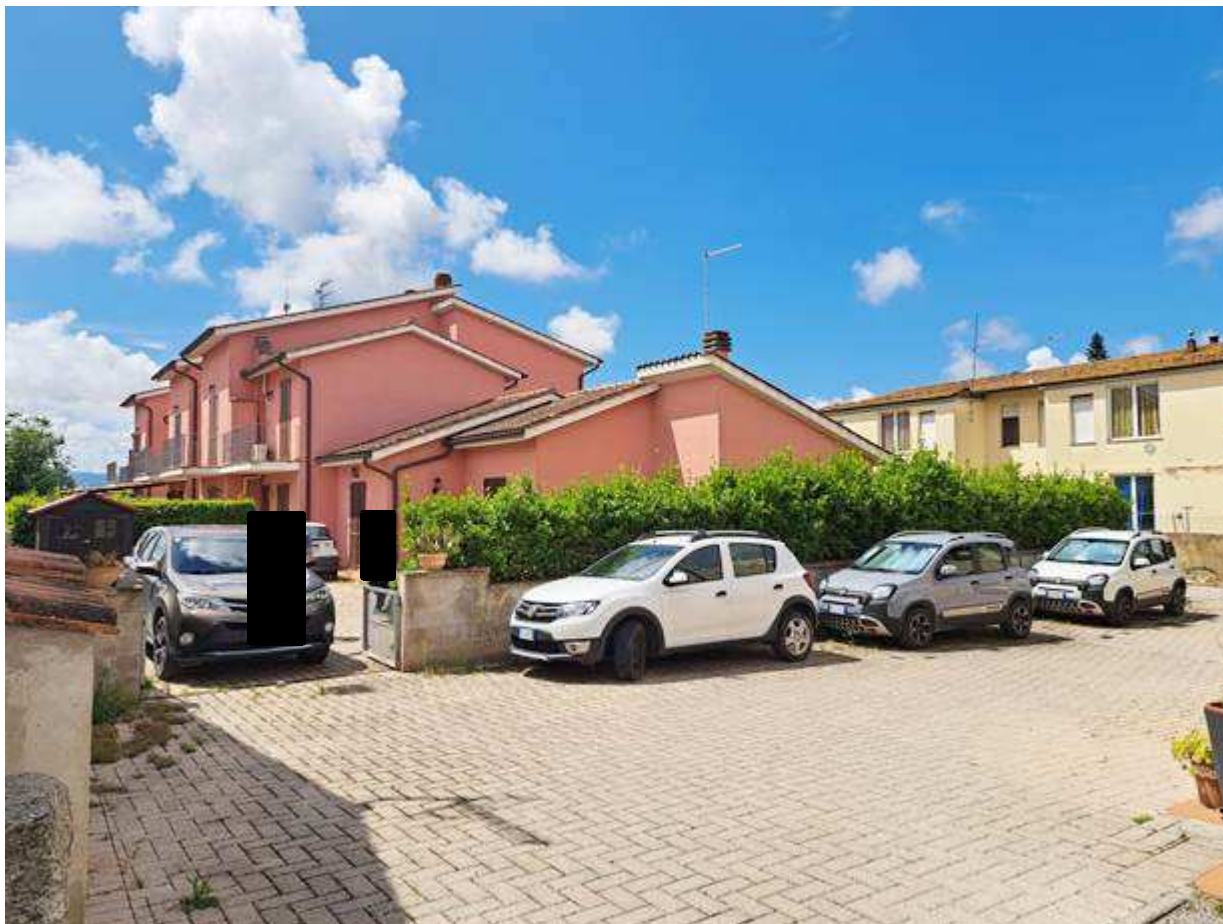
2. Vista esterna del fabbricato di cui fa parte il bene da nord-est