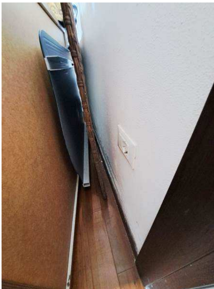
11. Vista interna alla camera matrimoniale (dettaglio di porzione di intonaco deteriorato a seguito di pregressa perdita da tubazione idrica del bagno attiguo)