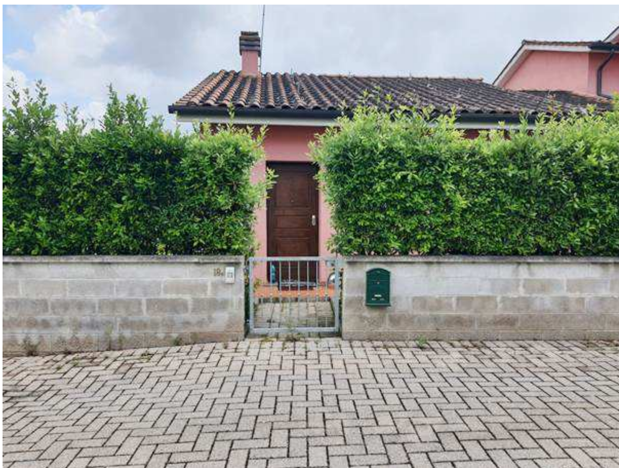
4. Vista dell'ingresso pedonale al resede della villetta posto sul lato ovest