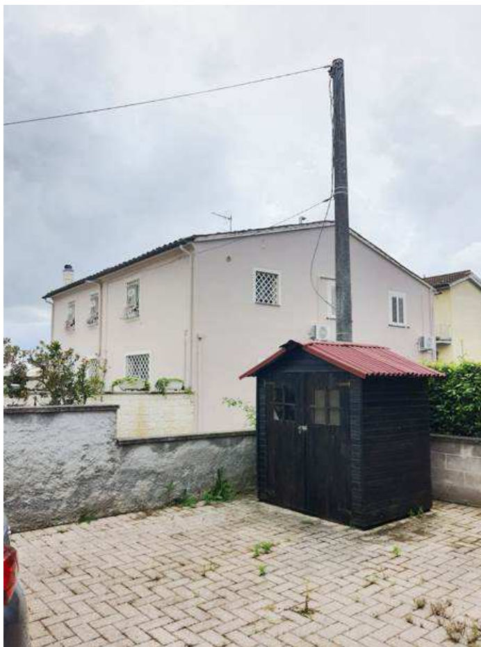
12. Vista esterna del box in legno insistente sul resede esclusivo