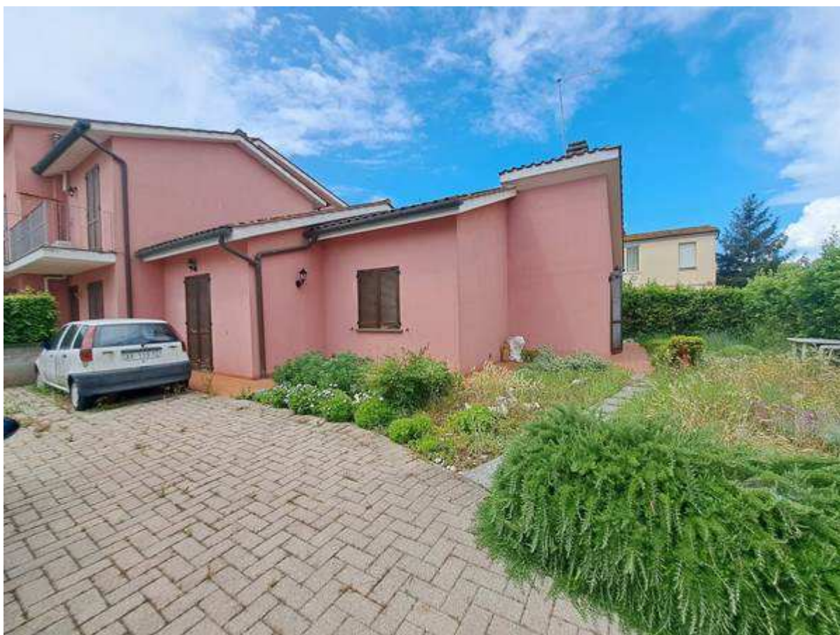
3. Vista esterna dell'immobile da nord-est