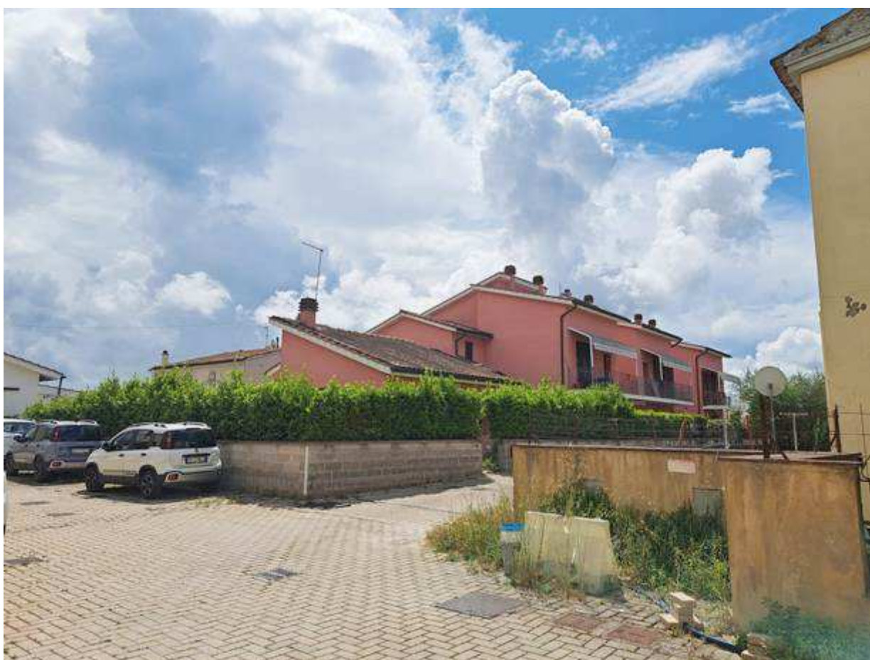
1. Vista esterna del fabbricato di cui fa parte il bene da nord-ovest