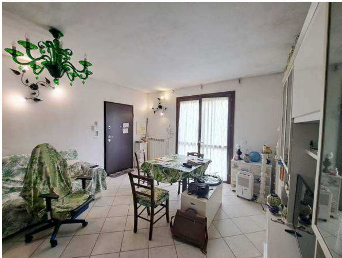
5. Vista interna al soggiorno - pranzo – zona cottura