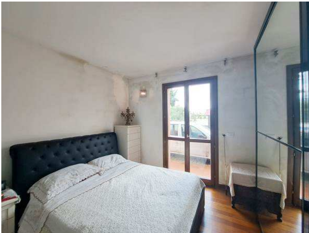
7. Vista interna alla camera matrimoniale