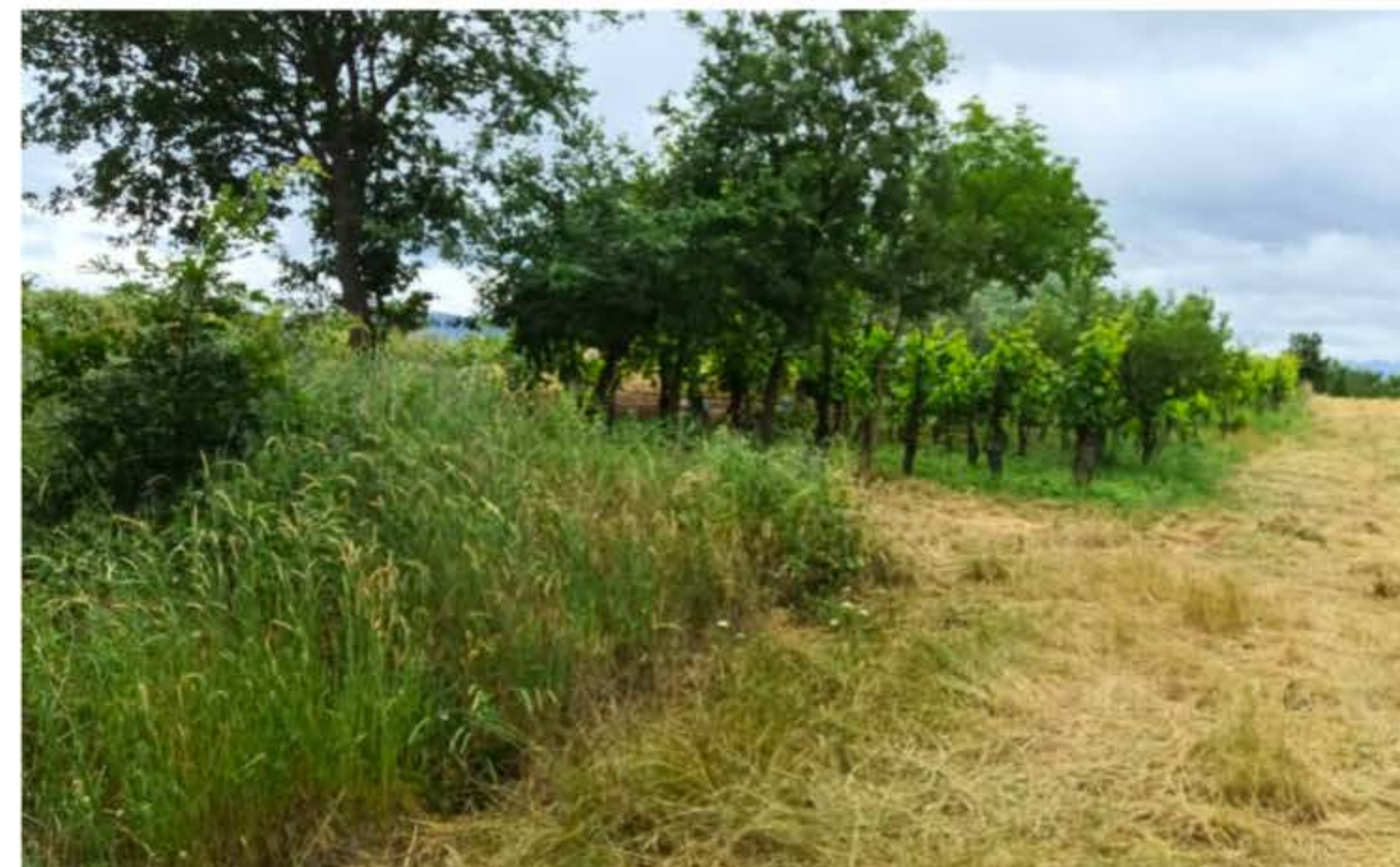
Terreno coltivato a vigneto e alberi da frutto/orto, disposto su un versante pressoché pianeggiante.

SSANDRO Emesso Da: ARUBAPEC S.P.A. NG CA 3 Serial#: 2b704275c91f512e46a262a3813ff2b1