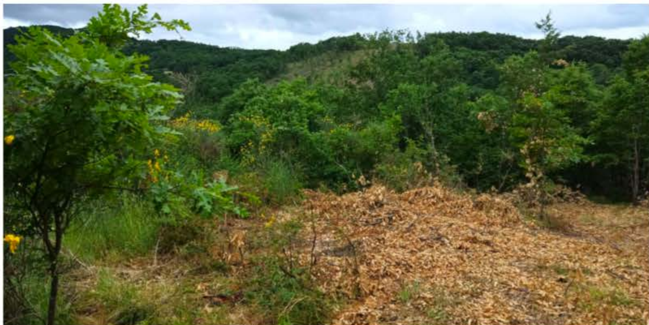
Terreno boschivo, con elevate presenza di alberi e macchia mediterranea, Posizionato su un versante con inclinazione verso il torrente Palmento.

SSANDRO Emesso Da: ARUBAPEC S.P.A. NG CA 3 Serial#: 2b704275c91f512e46a262a3813ff2b1