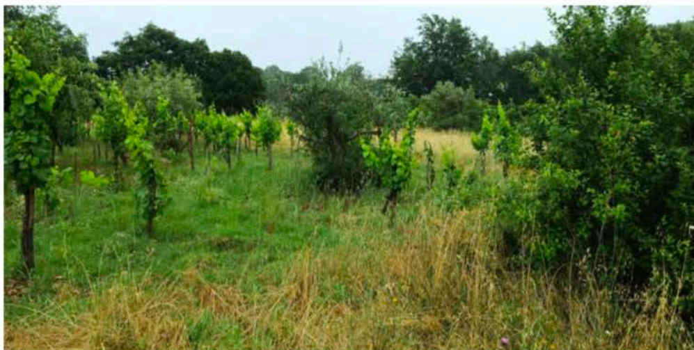
Terreno coltivato a vigneto e alberi da frutto/ulivi, disposto su un versante pressoché pianeggiante.