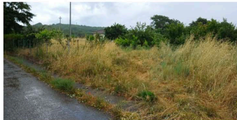
Terreno incolto, disposto su un versante pressoché pianeggiante, e situato, quasi del tutto, sulla banchina della strada comunale.