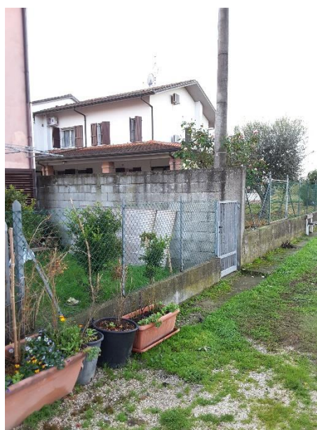
Vista accesso carrabile in confine con la particella 75; e vista accesso pedonale in confine con la particella 74