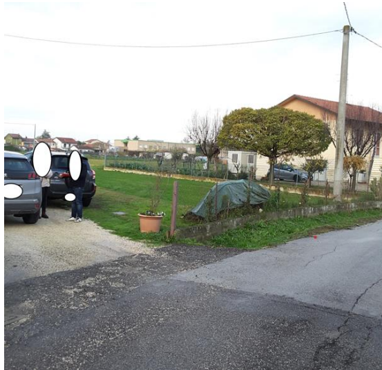
Vista accesso al terreno da via Rino Bagnoli