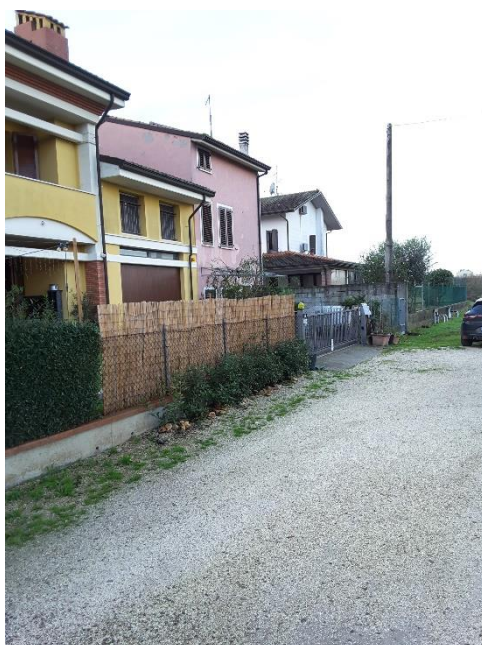
Vista delimitazioni del terreno sul lato in confine con le proprietà particelle 75, 74, 301 e 793