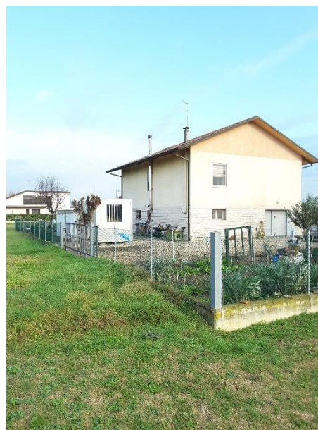
Vista delimitazioni sul lato interno a confine con la proprietà delle particelle 715 e 716