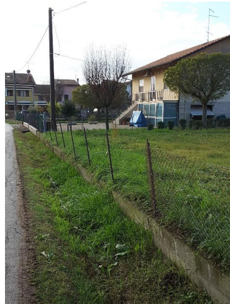
Vista delimitazioni del terreno su via Rino Bagnoli