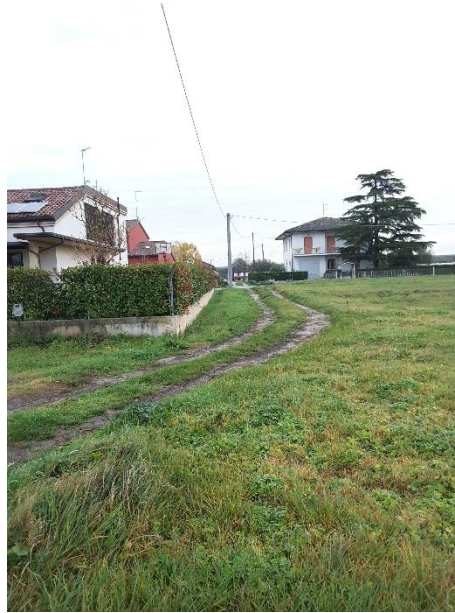
Vista delimitazioni del terreno sul lato in confine con la proprietà delle particelle 38, 957 e 958