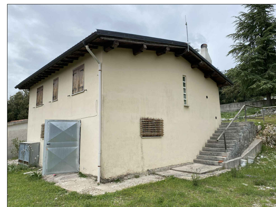
Foto 6 lato sinistro - retro