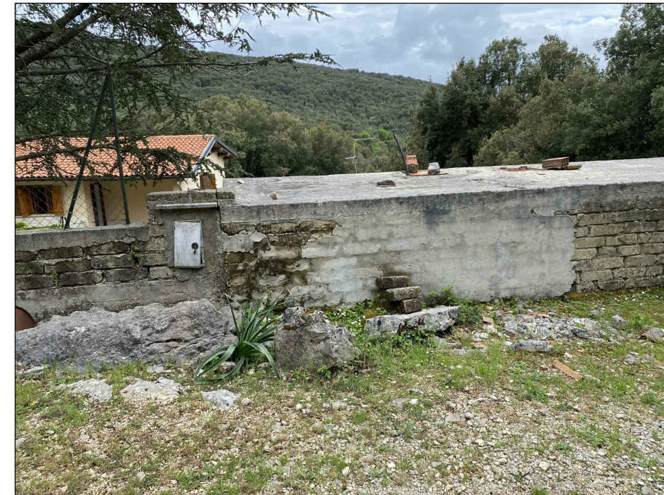
Foto 3 vasca acqua