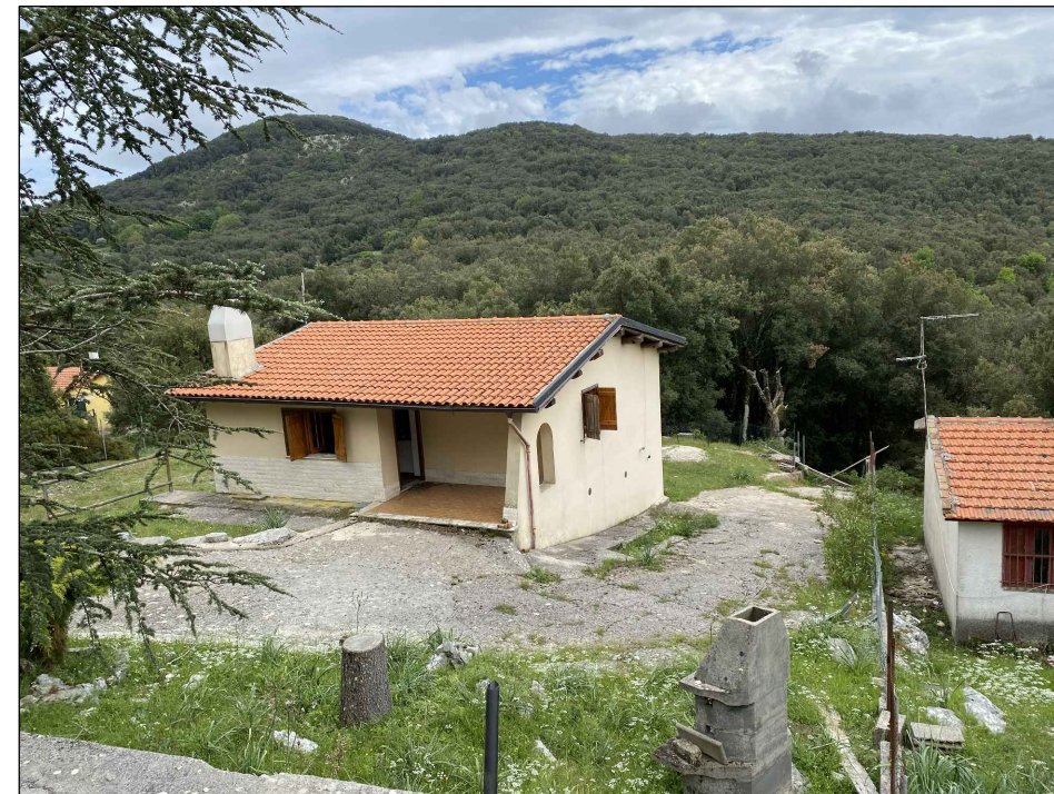
Foto 5 prospetto - lato destro