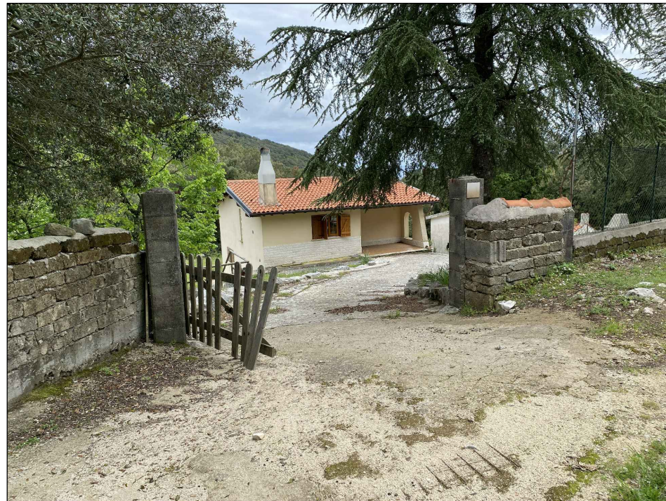
Foto 2 ingresso ad abitazione