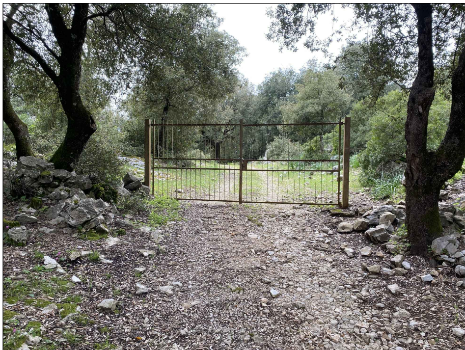
Foto 1 ingresso a zona