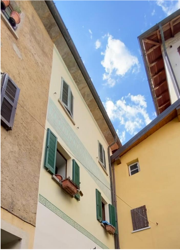
Vista da vicolo della Chiesa