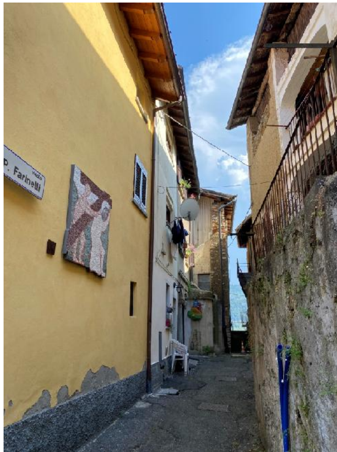
Vista da via Farinelli