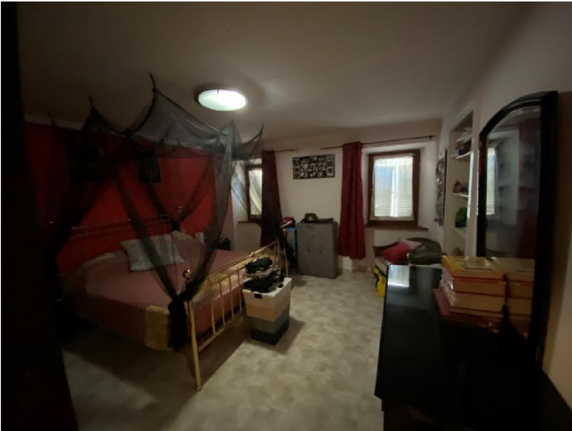
Camera 2° Piano