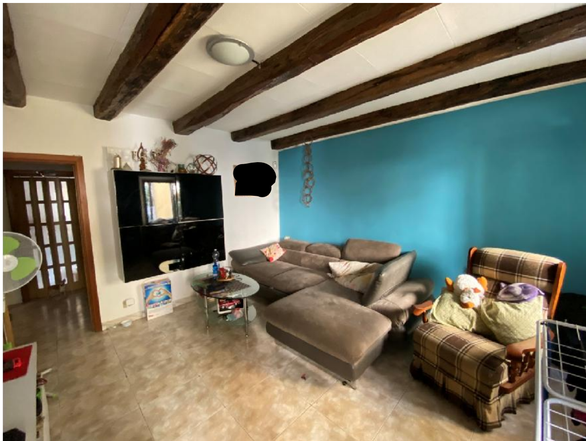
Camera 1° Piano