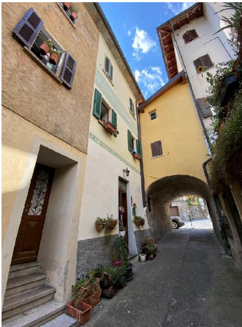
Vista da vicolo della Chiesa