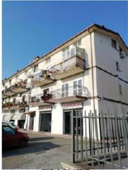
VISTA LATO OVEST