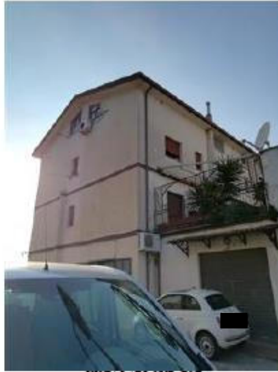
VISTA LATO SUD-EST