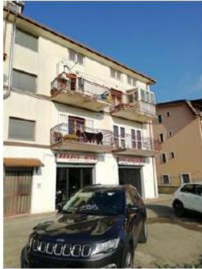
VISTA LATO NORD-OVEST