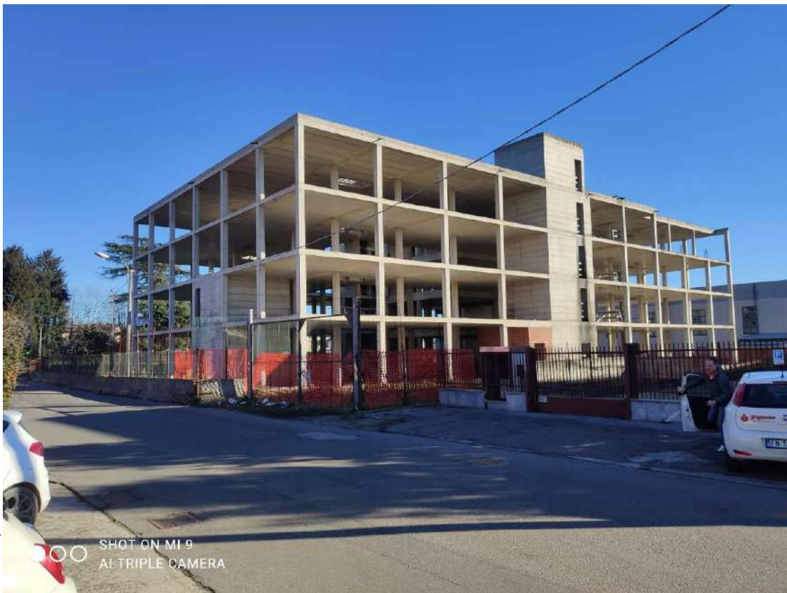
STATO EDIFICIO POLIFUNZIONALE – VISTA DALLA VIA AL CORBE'