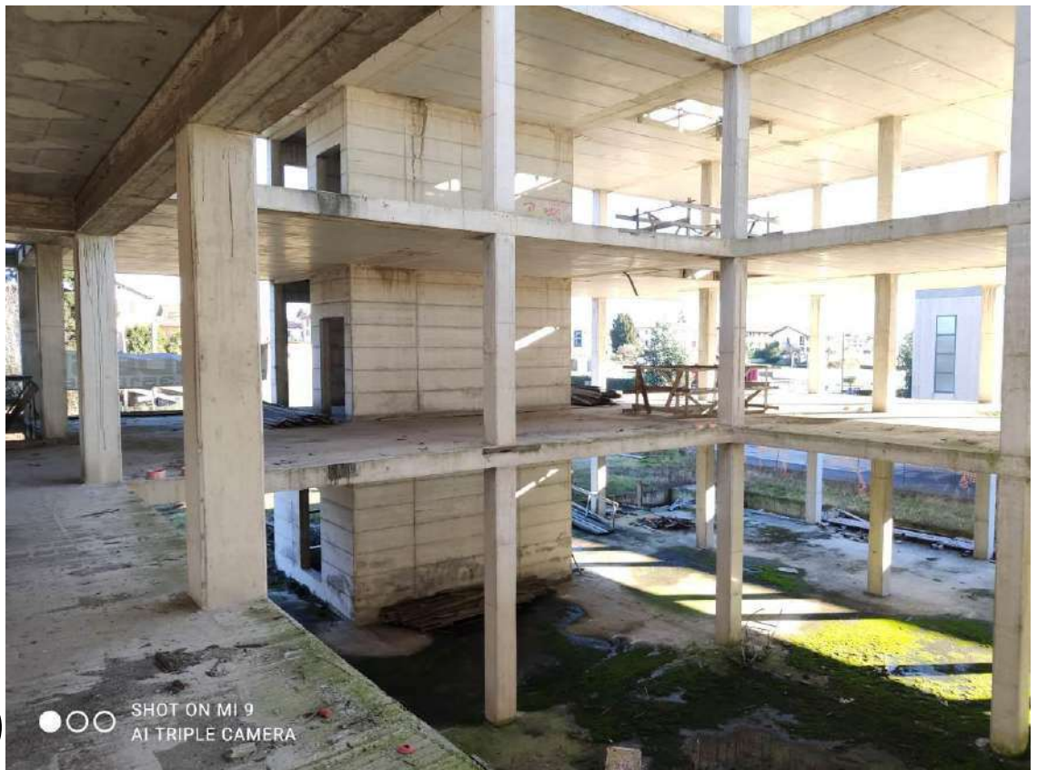
STATO EDIFICIO POLIFUNZIONALE