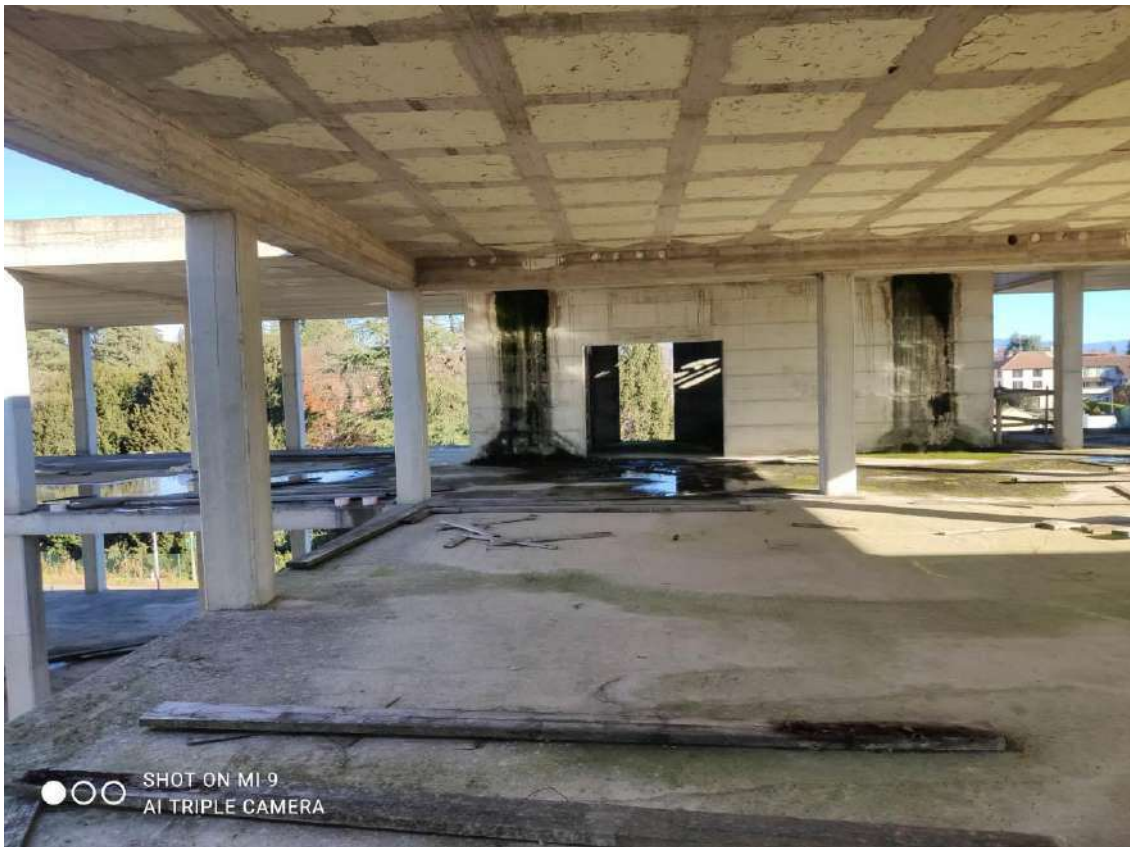
STATO EDIFICIO POLIFUNZIONALE – PIANO TERZO