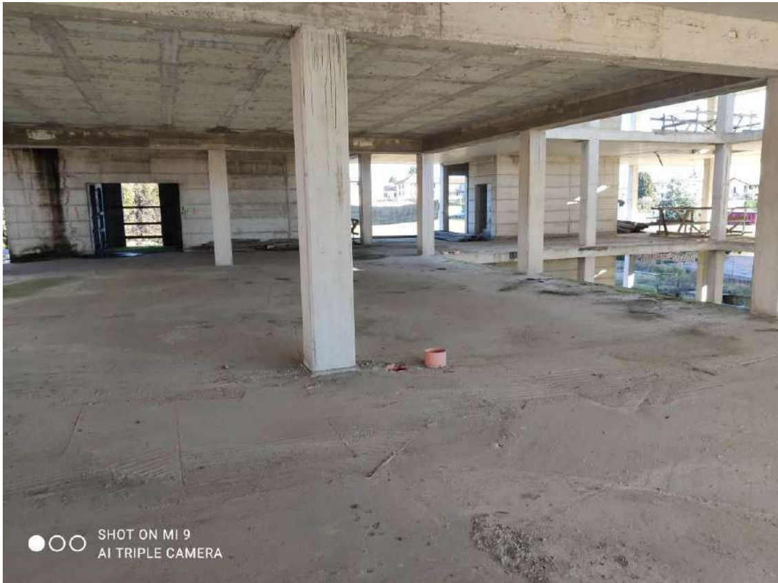
STATO EDIFICIO POLIFUNZIONALE – PIANO SECONDO