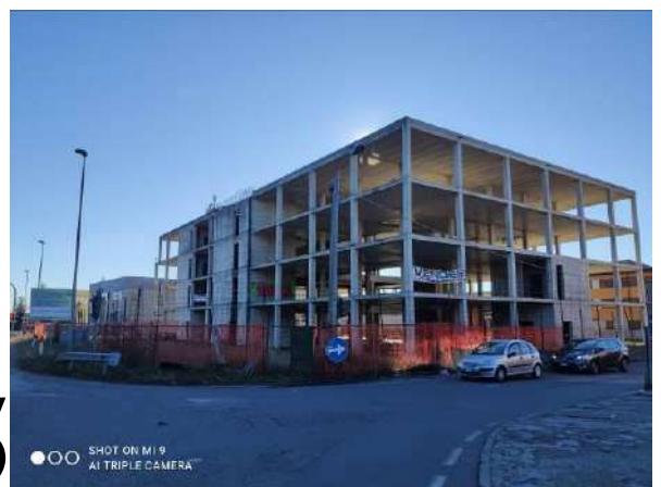
STATO EDIFICIO POLIFUNZIONALE – VISTA DALLA VIA VARESE (SP233)