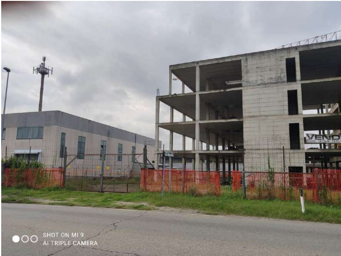
STATO EDIFICIO POLIFUNZIONALE – VISTA DALLA VIA VARESE