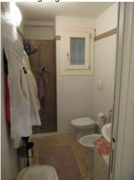
Interno – w.c.