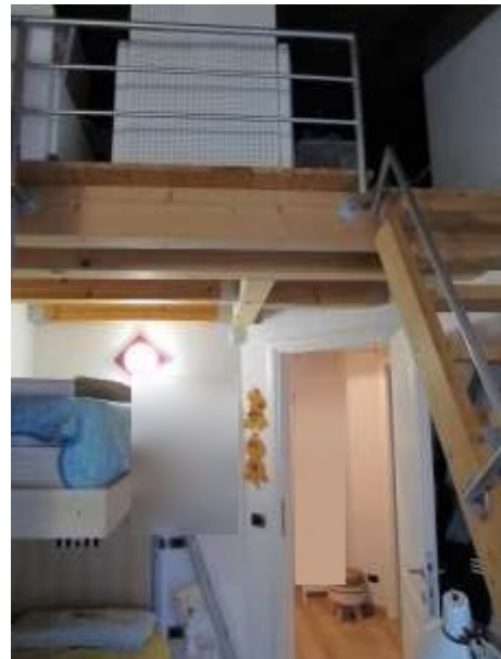
Interno – soppalco camera p.1-p.2