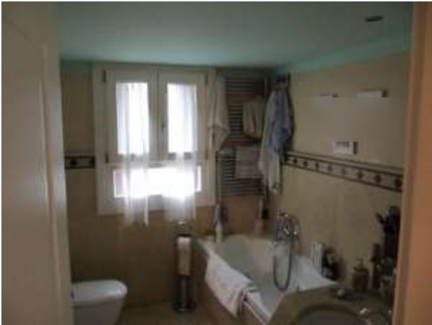
Interno – bagno p.1