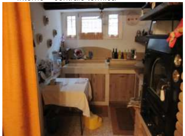
Interno taverna piano interrato