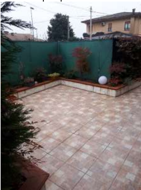
Esterno – vista area esterna