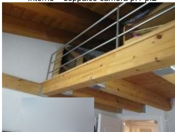
Interno – soppalco camera p.1-p.2