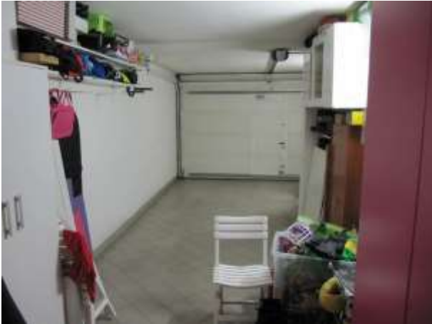
Interno – garage