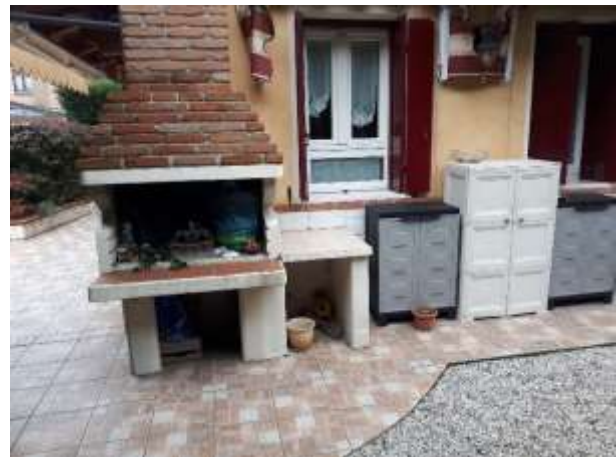
Esterno – vista ingresso condominio