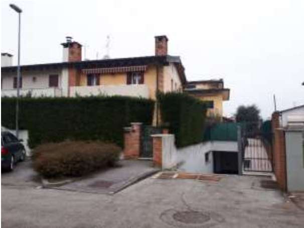
Esterno – accesso carraio e pedonale