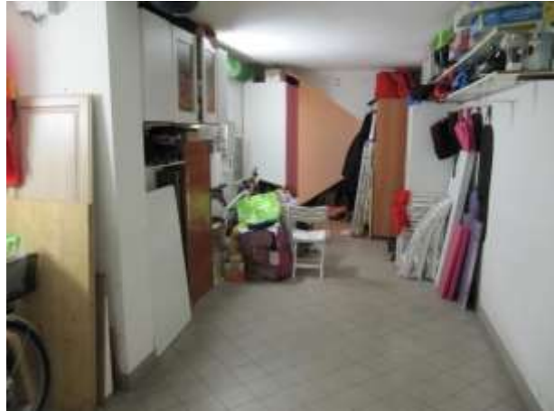
Interno – garage