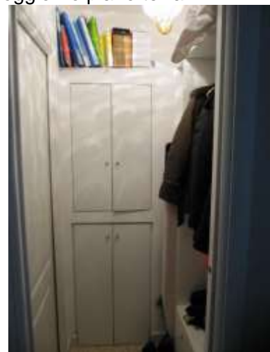
Interno – anti-bagno piano terra