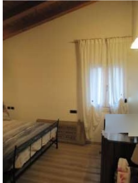
Interno camera p.1