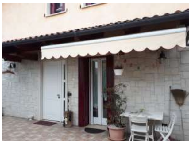
Esterno- zona entrata