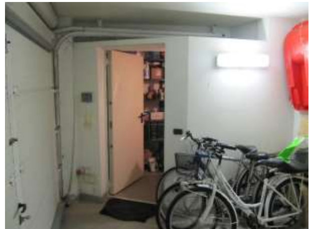
Interno – centrale termica