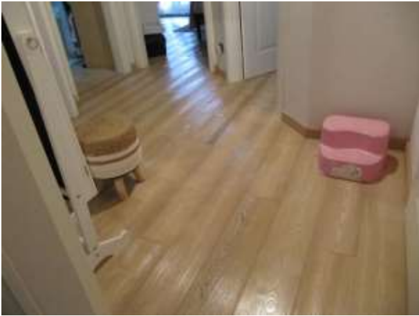
Interno – disimpegno piano primo