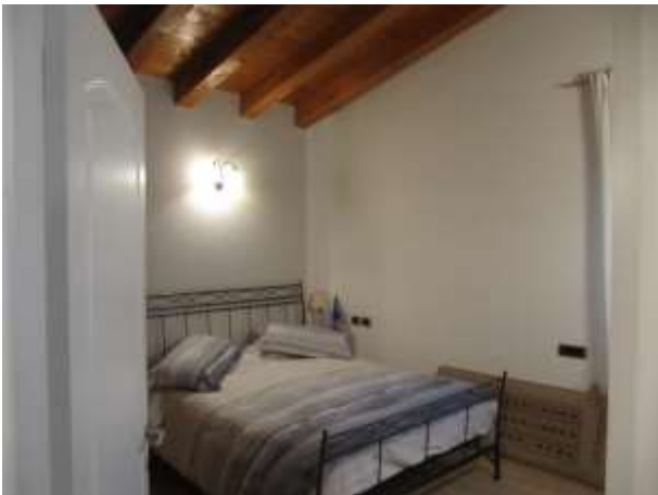
Interno – camera p.1