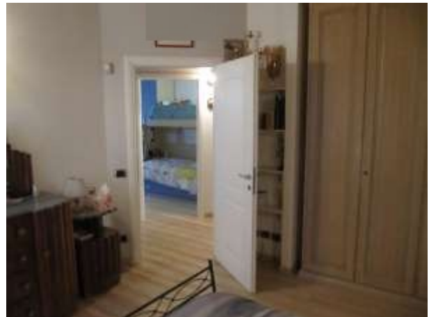
Interno – camera p.1