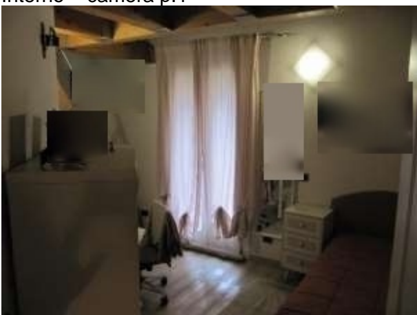
Interno – camera p.1