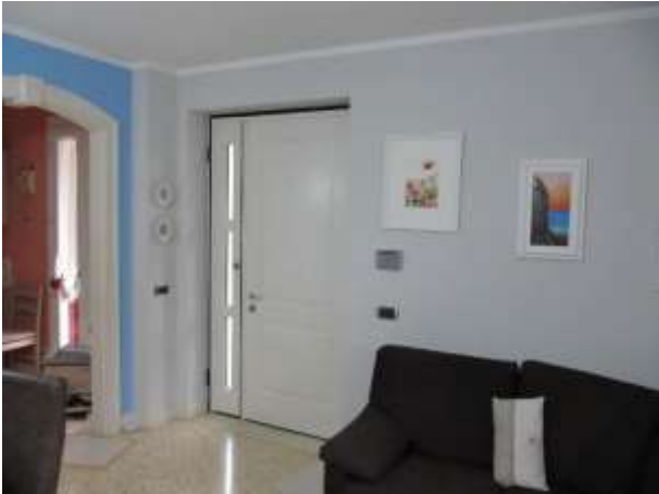
Interno – entrata piano terra