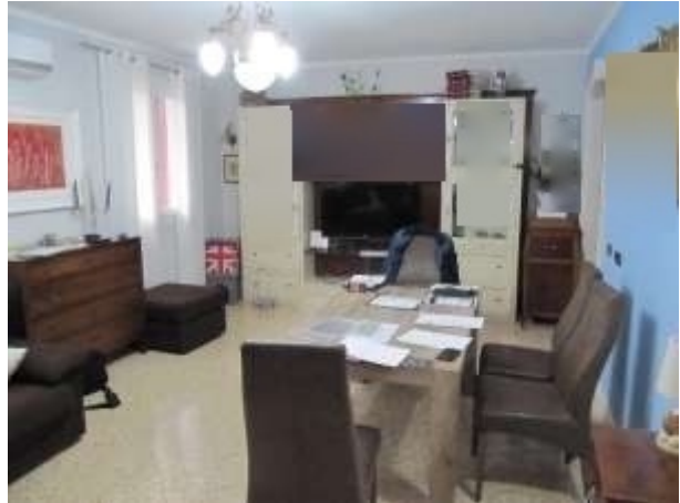
Interno – soggiorno piano terra