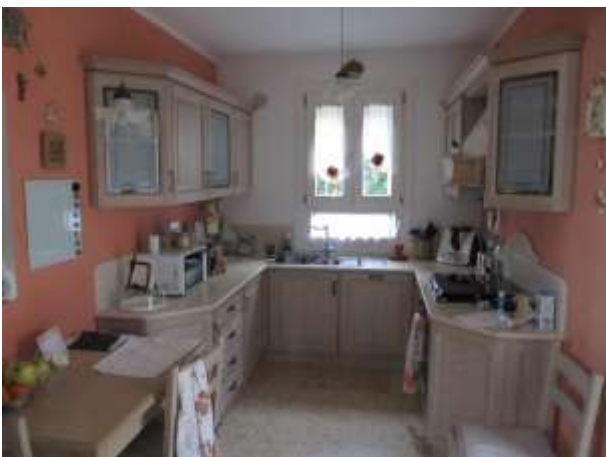
Interno – cucina piano terra