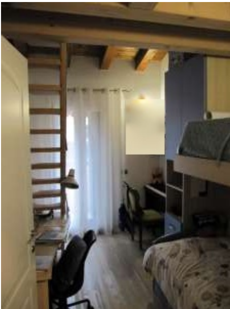
Interno – camera p.1