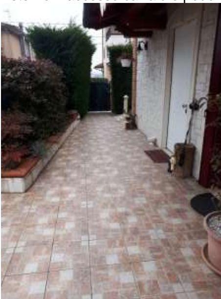
Esterno – prospetto lato