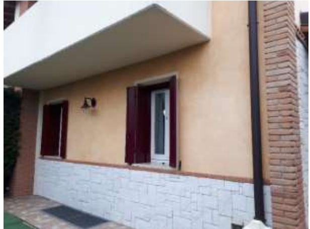
Esterno – prospetto fronte