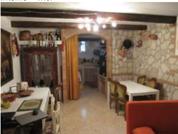
Interno taverna piano interrato