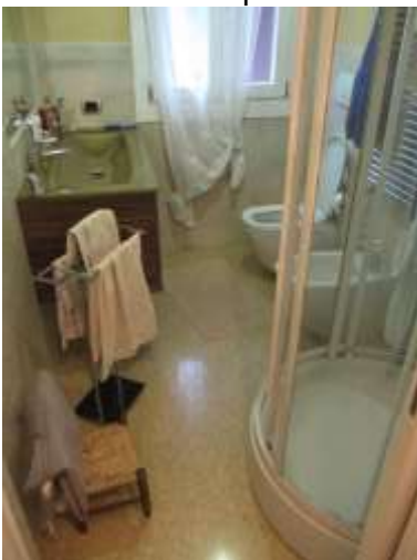
Interno – bagno piano terra