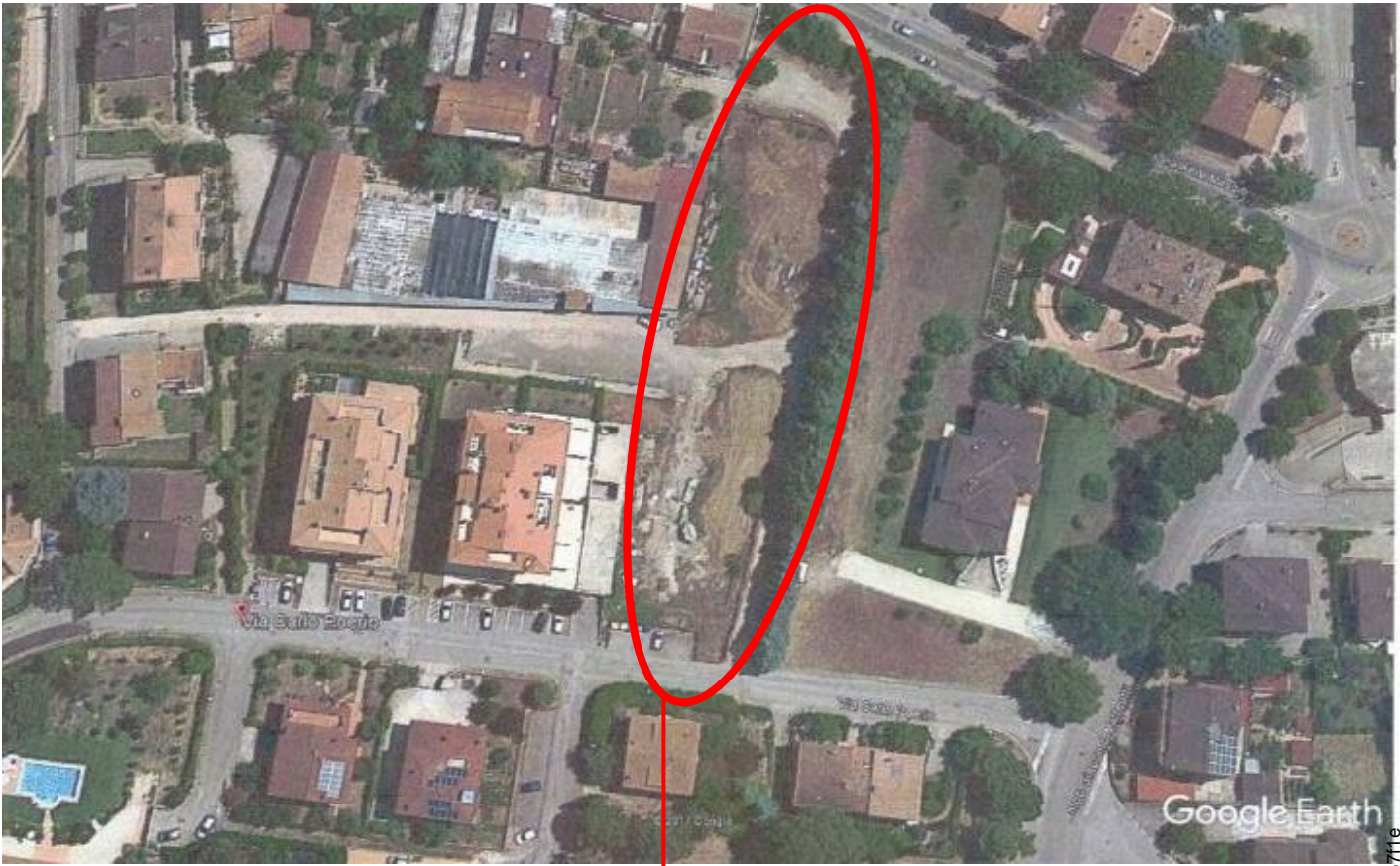
AREA OGGETTO DI STIMA