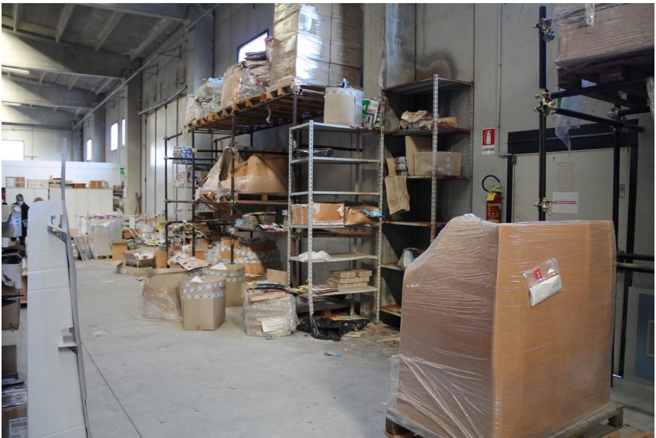
Foto n.14 – Capannone (p.la 346) – foto dettaglio infiltrazione laterale e infissi