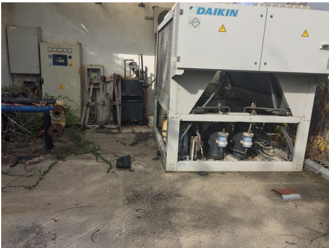
Foto n.34 – locale recintato contenente gruppo elettrogeno e macchina climatizzazione