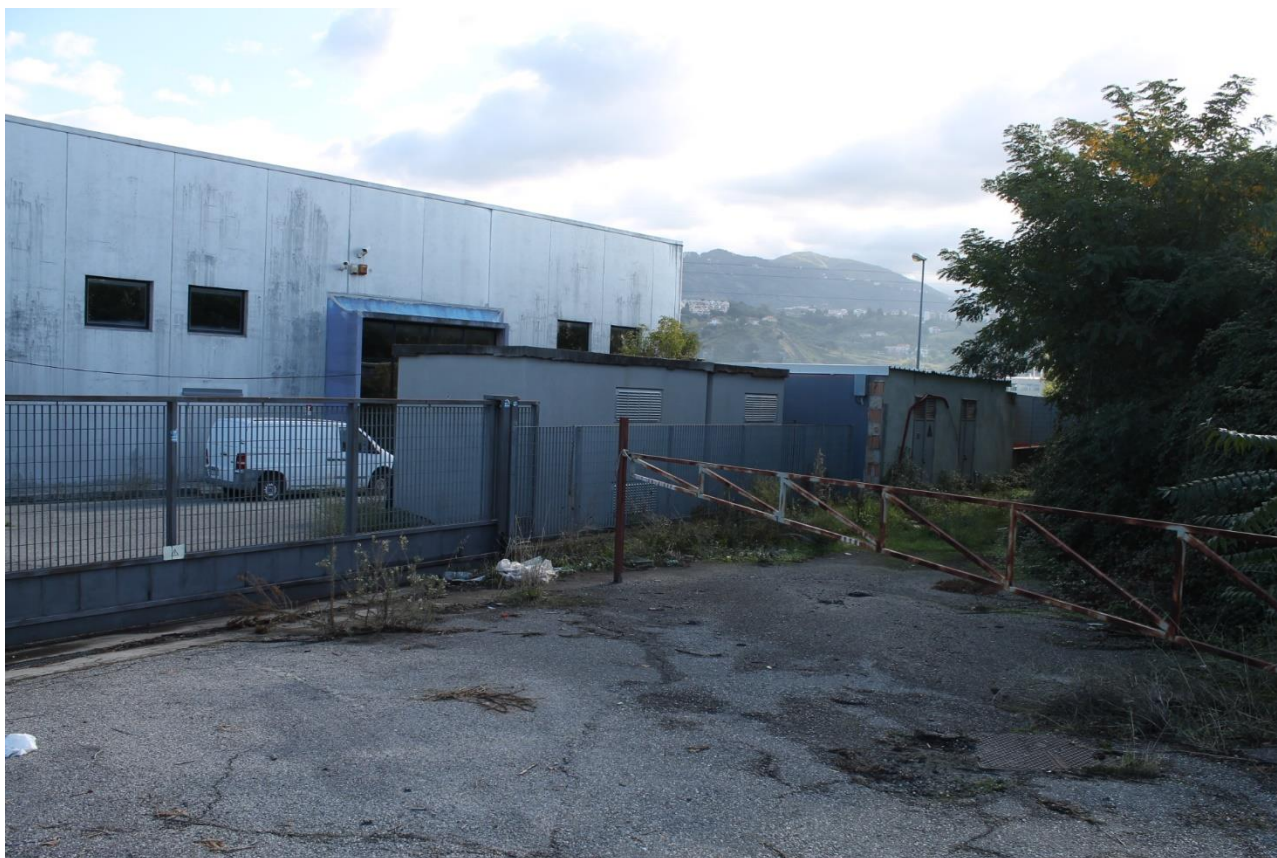
Foto n.28 – locali tecnici (p.lla 498-499-363) vista dall'esterno della recinzione