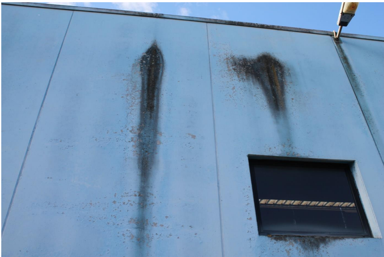
Foto n.4 – Capannone (p.la 346) – dettaglio infiltrazioni e deterioramento facciata