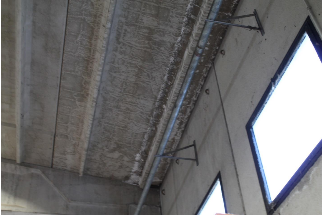
Foto n.13 – Capannone (p.la 346) – foto dettaglio infiltrazione da copertura