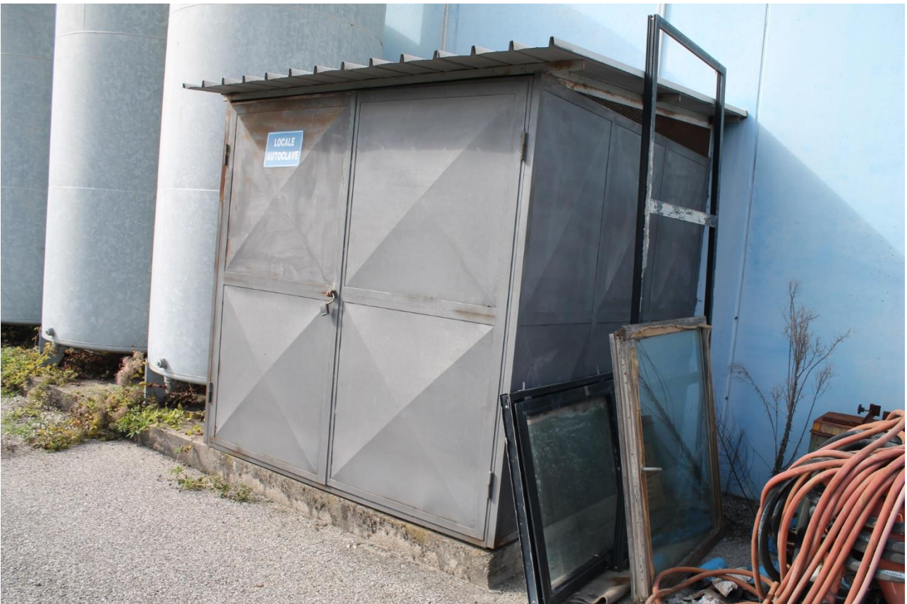
Foto n.6 – Capannone (p.lla 346) – box per locale tecnico antincendio