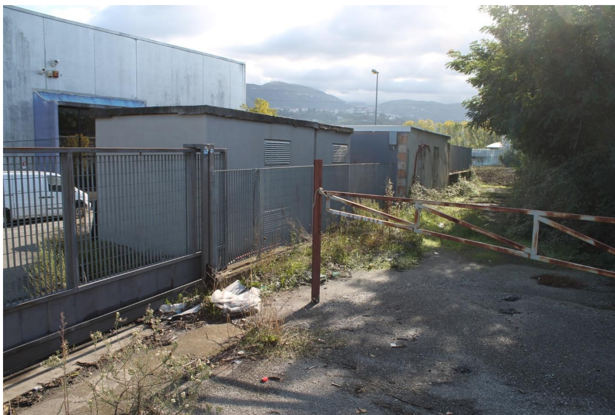
Foto n.29 – locali tecnici (p.lla 498-499-363) vista dall'esterno della recinzione e stradella con servitù