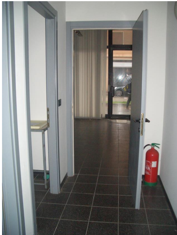
10. Vista del disimpegno