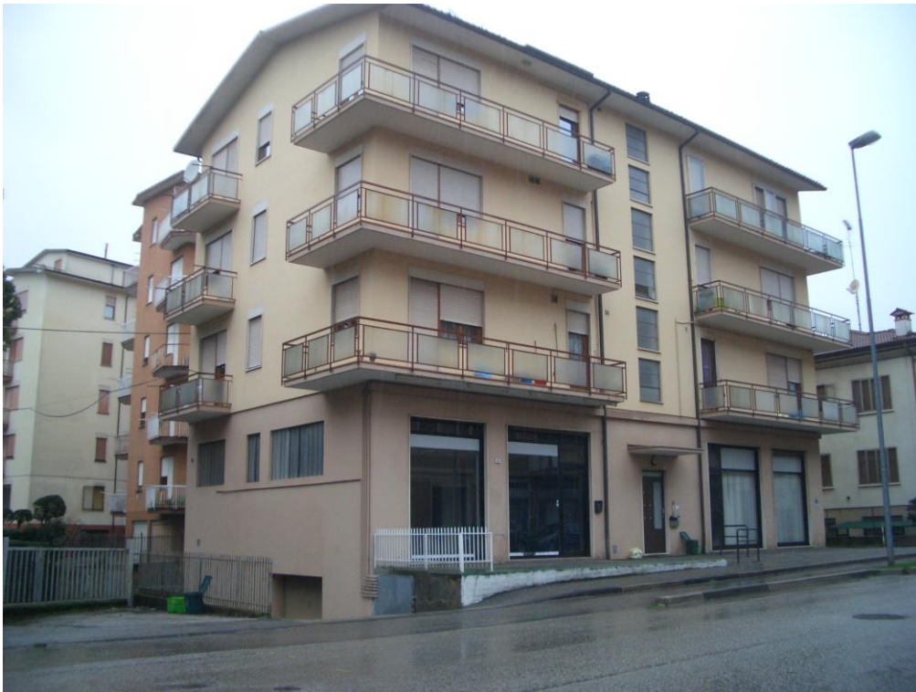
2. Vista generale da Sud - Est