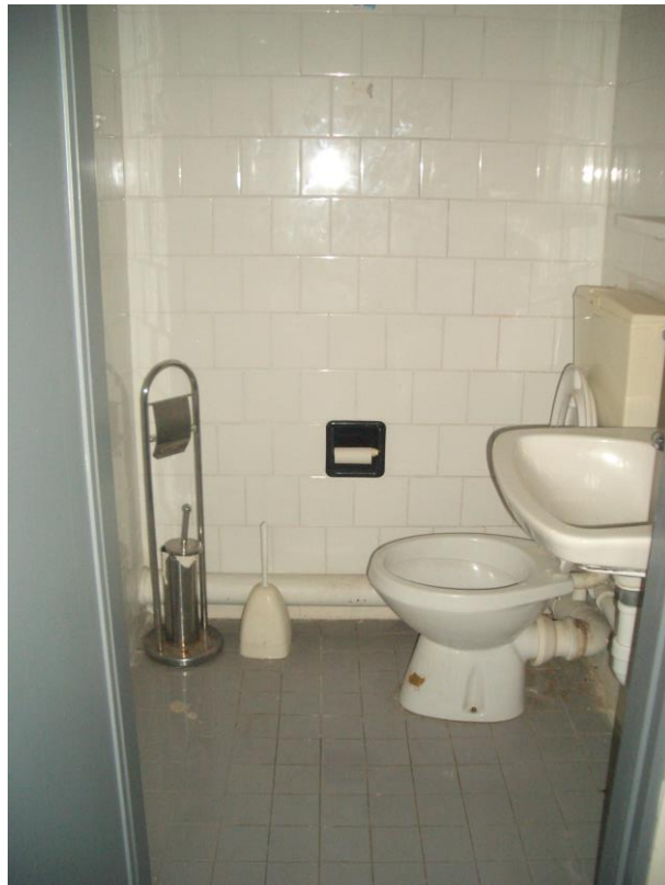
8. Vista del servizio igienico