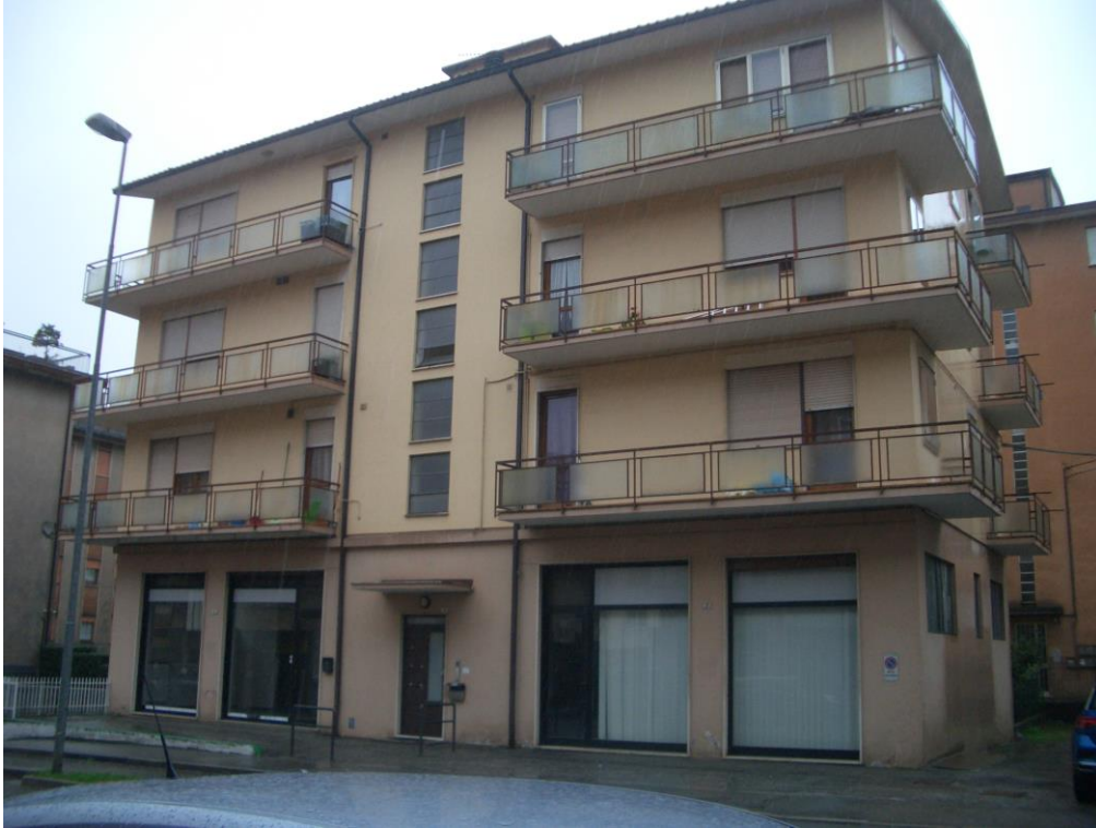
1. Vista generale da Nord-Est