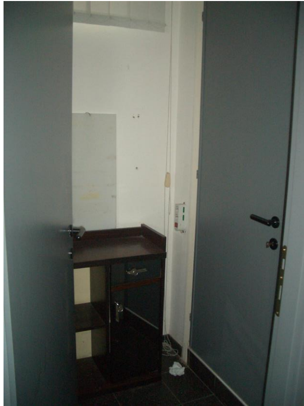
5. Vista dell'antibagno