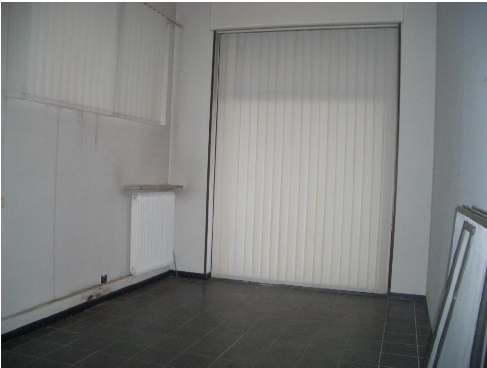
12. Vista dell'ufficio a Nord-Est