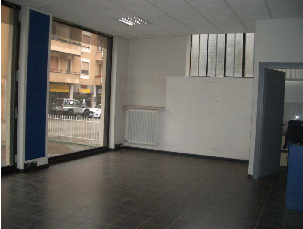
3. Vista dell'Ingresso