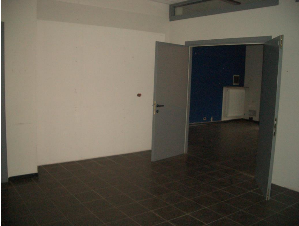
7. Vista del vano di distribuzione