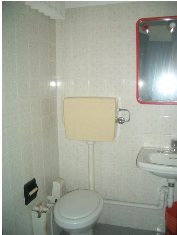
6. Vista del servizio igienico