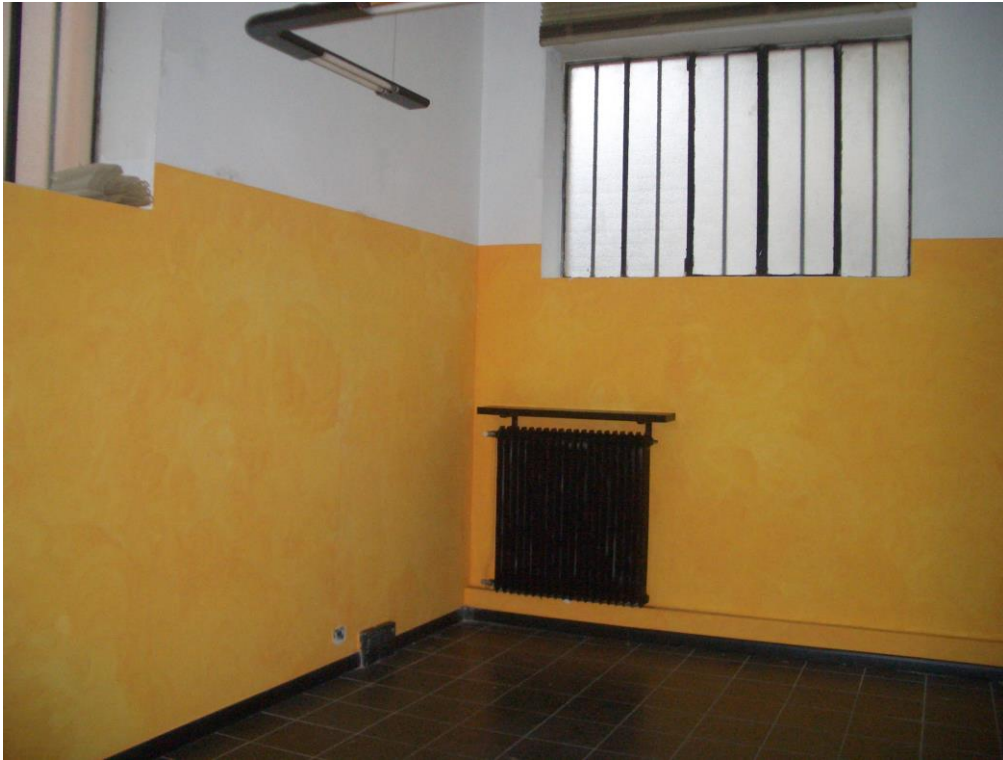
11. Vista dell'ufficio a Nord-Ovest