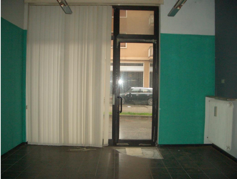
13. Vista dell'ufficio centrale