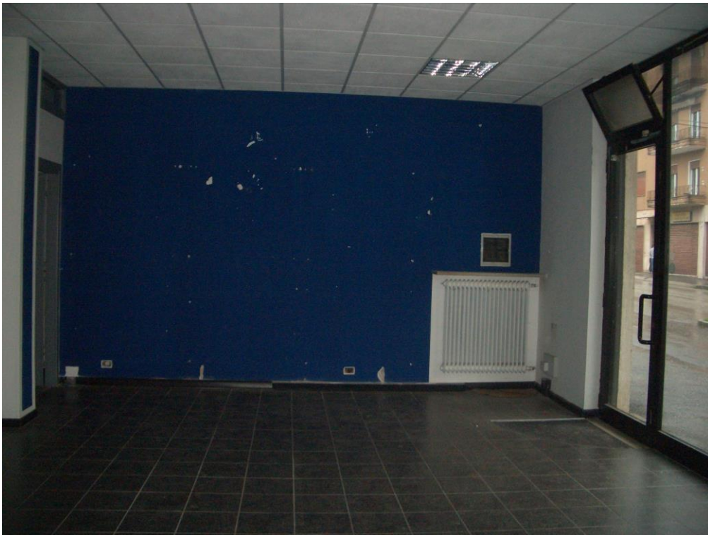
4. Vista dell'Ingresso