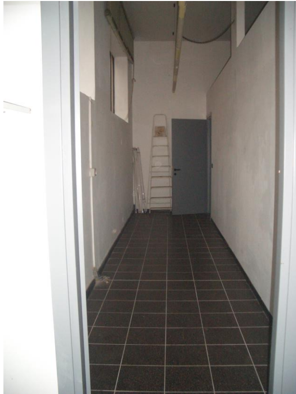
9. Vista del disimpegno