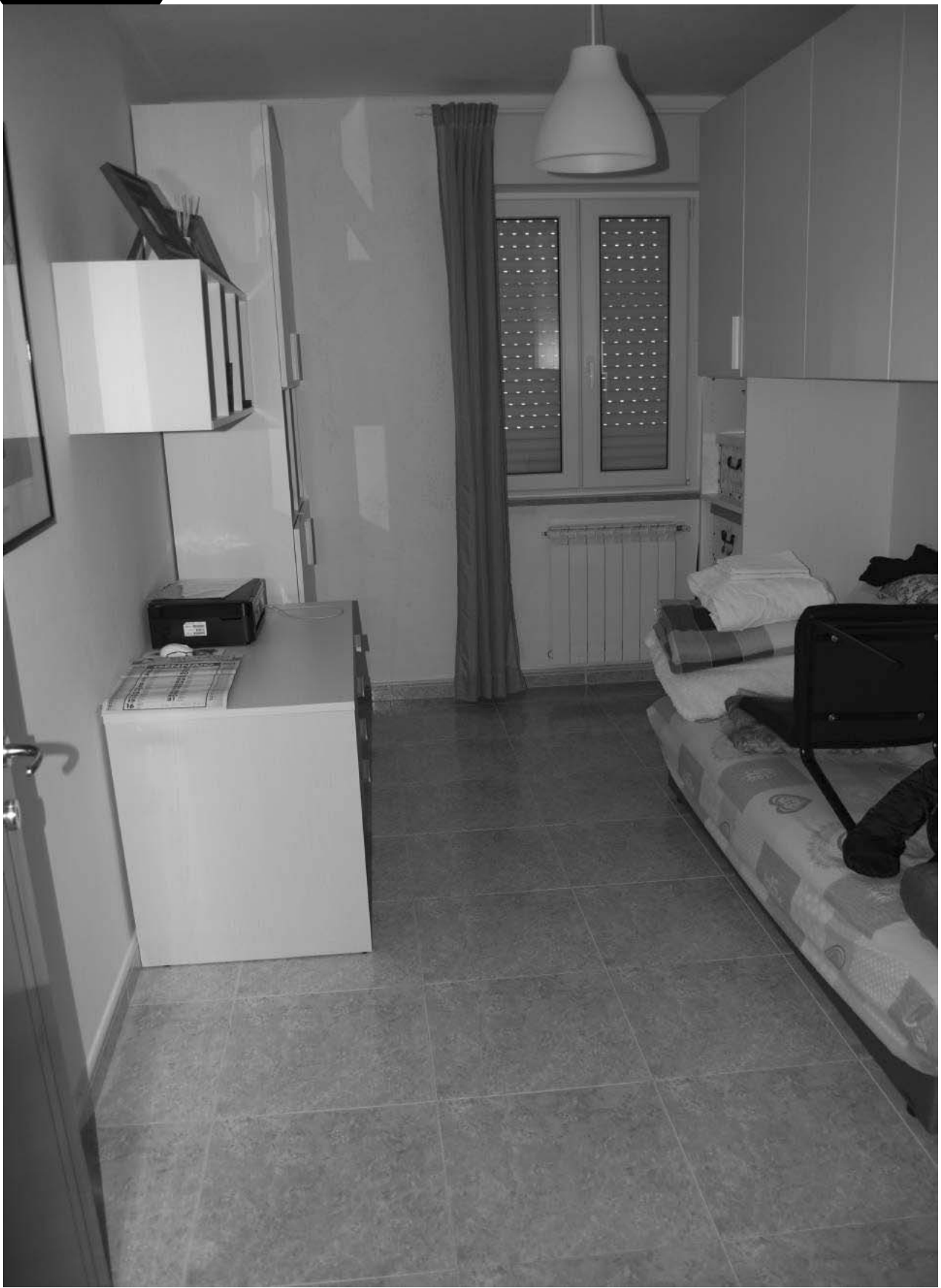
STUDIO TECNICO arch. Giovanni Tricarico – Via L. Gissi n.16 – 71121 FOGGIA –