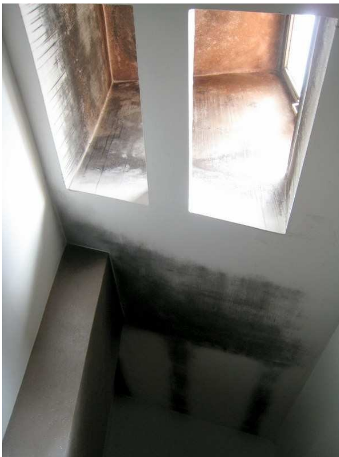
Foto n. 7. L'abbaino che porta luce al corridoio dalla copertura.