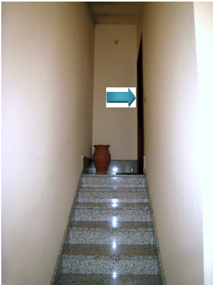
Foto n. 5. L'ultima rampa di scale prima dell'alloggio.