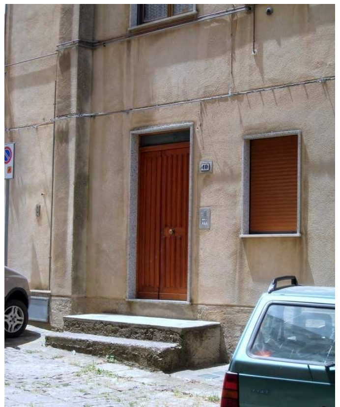
Foto n. 4. Portone di accesso alla scala comune, civico 40.