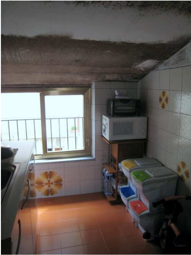
Foto n. 9. La trave in c.a. della copertura e totalmente aggredita dalla muffa.