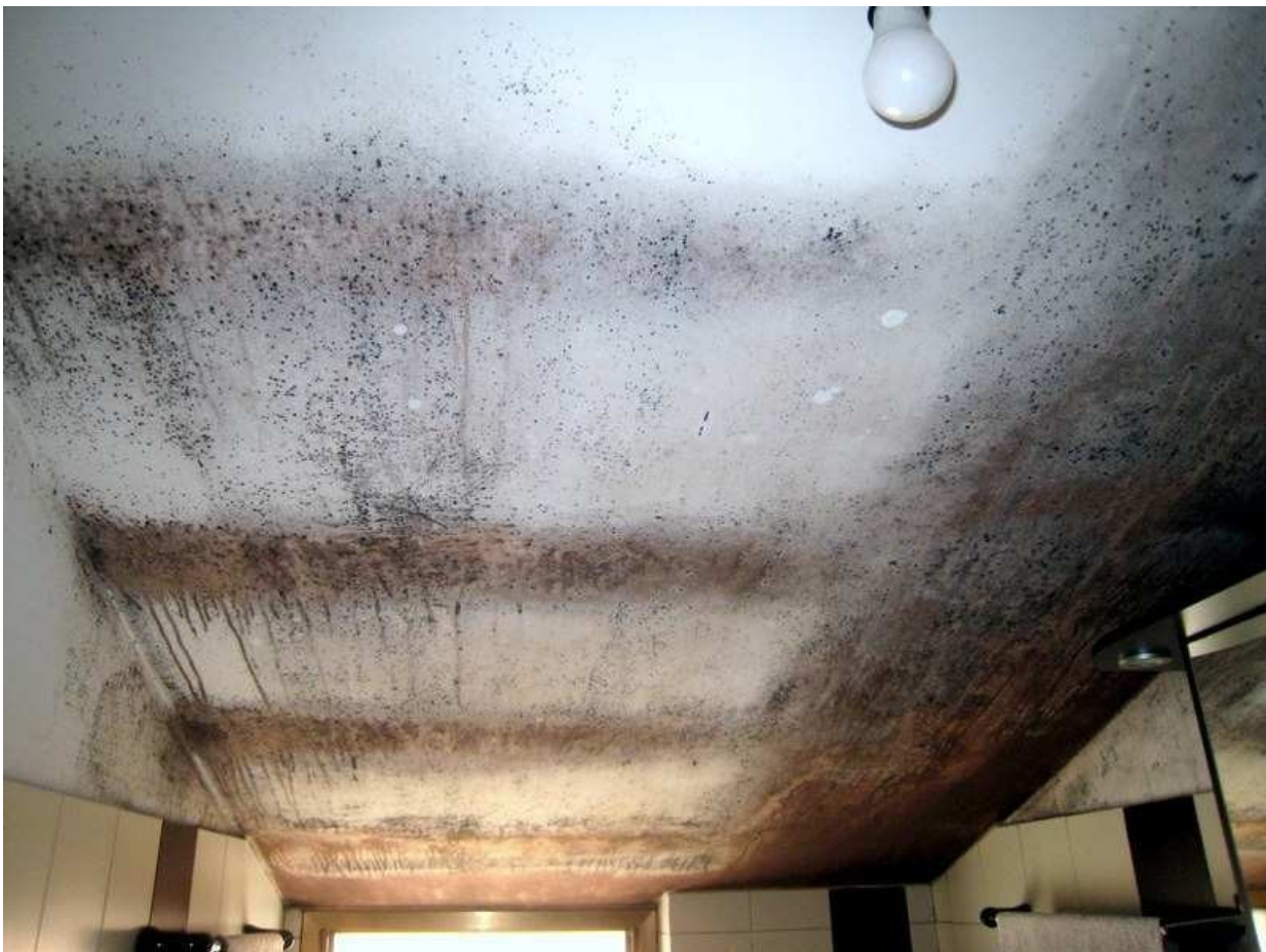
Questa foto, in particolare, mostra come la condensa, unitamente alla muffa, dilava sulla superficie del tetto inclinato.