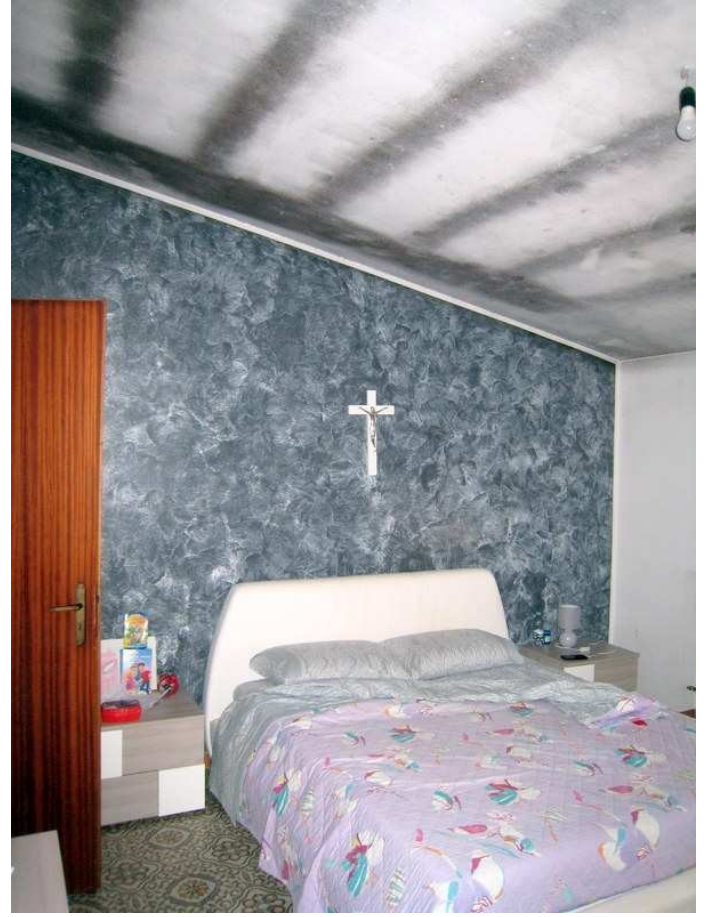
Foto n. 23-24-25. La camera matrimoniale ha gli stessi problemi di condensa di tutte le altre stanze.