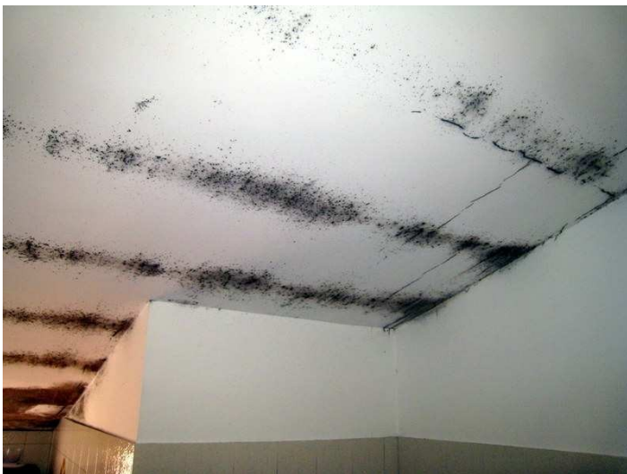
Foto n. 12-13. Dettagli della muffa da condensa presente in ciascuno dei travetti che formano il solaio di copertura. Il fenomeno è diffusissimo ed è pericoloso per la salute di chi vi abita.