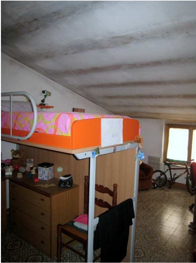
Foto n. 20-21-22. La cameretta è nelle medesime condizioni delle altre stanze. La muffa si è attaccata ai travetti del solaio segnandoli uno per uno secondo la cadenza di posa.