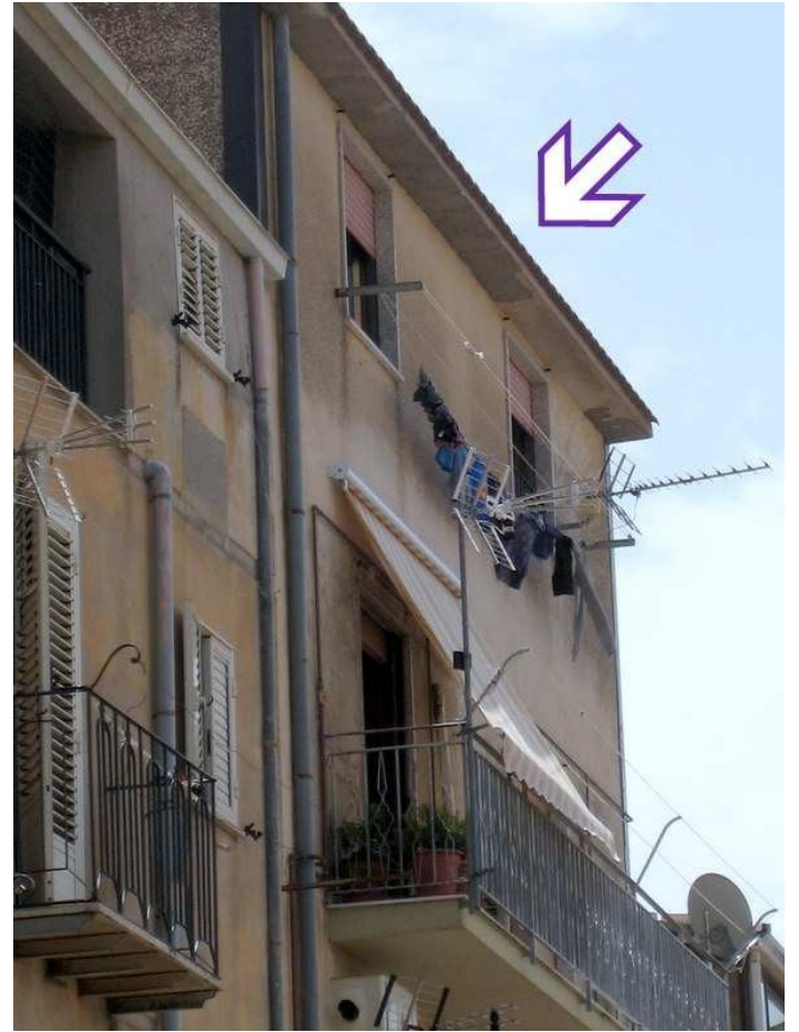
Foto n. 26-27. L'alloggio si affaccia anche sulla Via Repubblica, lato valle. Le frecce nelle due foto indicano, rispettivamente, l'edificio in cui si trova il bene, al 5° piano, e lo stesso alloggio che si apre sulla strada pubblica con due finestre che sono quelle della camera matrimoniale, la prima, e del soggiorno, la seconda. Entrambe, com'è visibile, hanno le tapparelle in PVC.