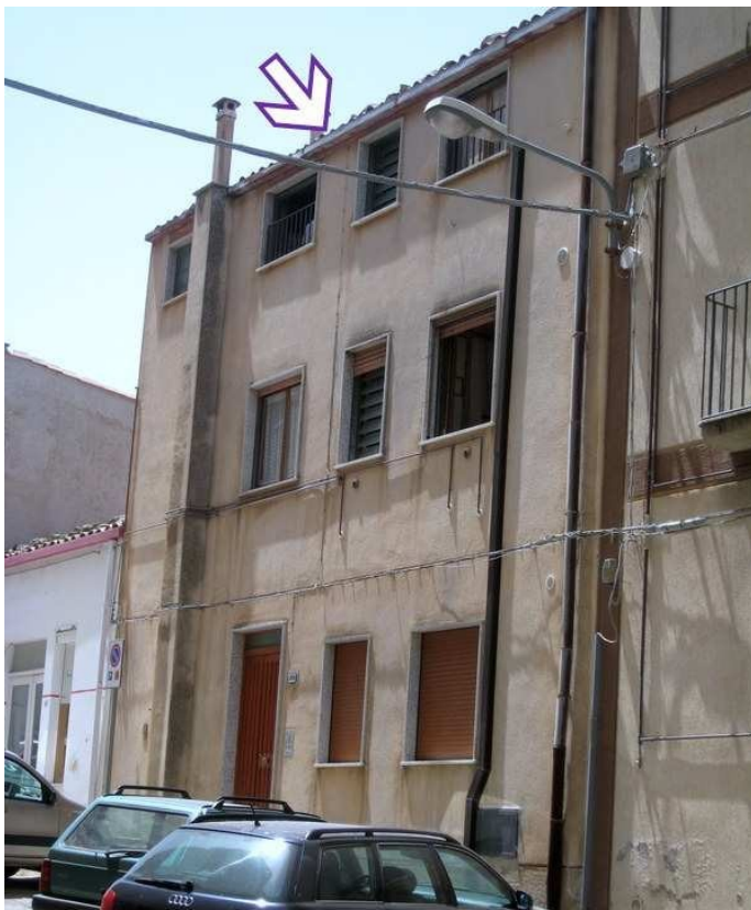
Foto n. 4. Dettaglio del prospetto con segnato l'alloggio.