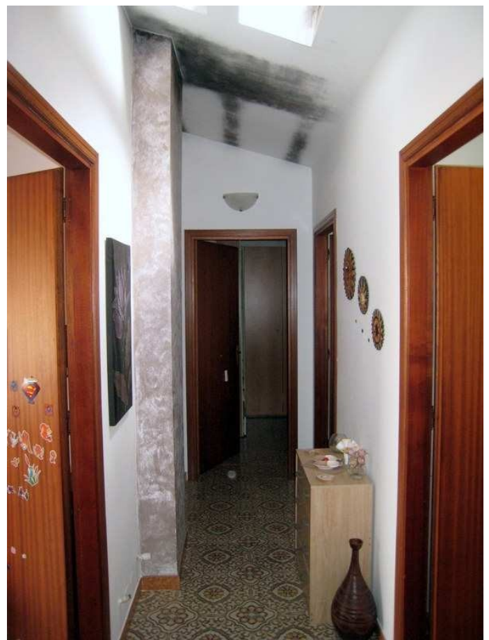
Foto n. 6. L'ingresso-corridoio: a Dx la cucina; a Sx il soggiorno.