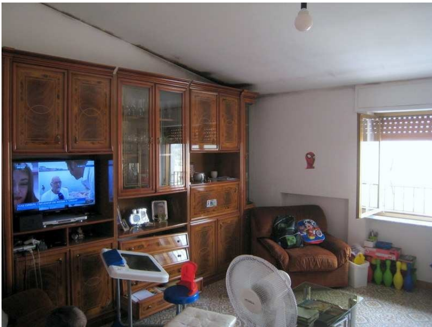
Foto n. 14-15-16. Il soggiorno. Anche sul tetto di questa stanza, se pure in forma minore, si è diffusa la muffa da condensa. Pure negli angoli vi sono colonie.