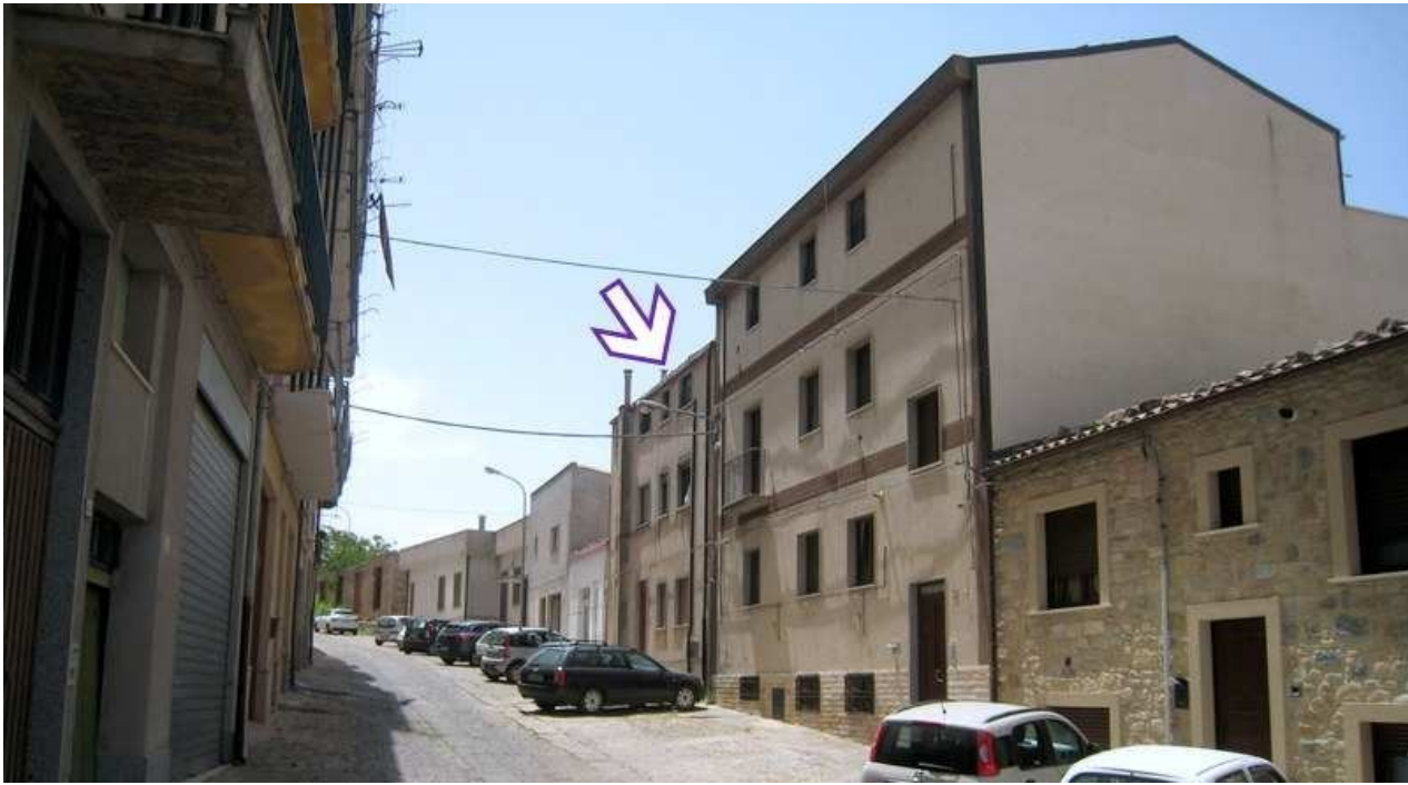
Foto n. 3. Via Repubblica lato monte. La freccia mostra la posizione del bene che si trova al 2° piano.