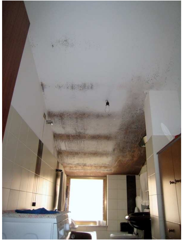
Foto n. 17-18-19. Il w.c. bagno presenta il tetto quasi totalmente intriso di muffa da condensa.