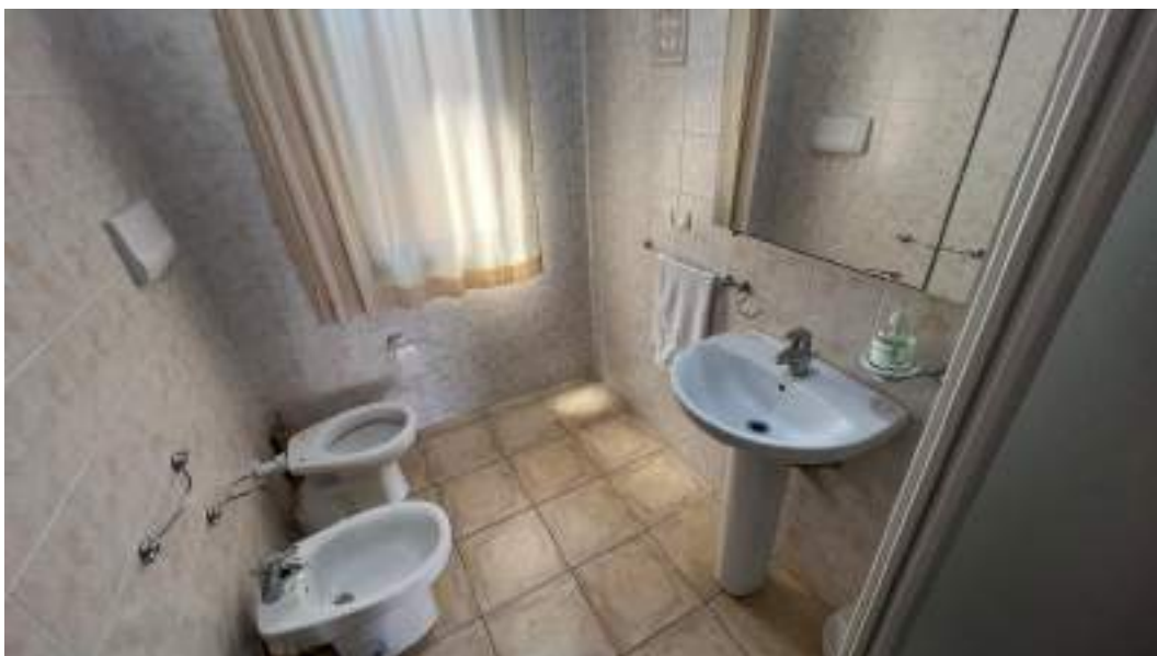
Figura 17 – Viste interne del fabbricato – piano terra