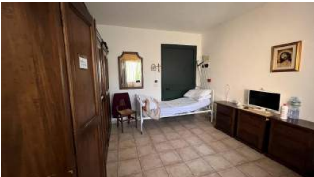
Figura 33 – Viste interne del fabbricato – piano primo