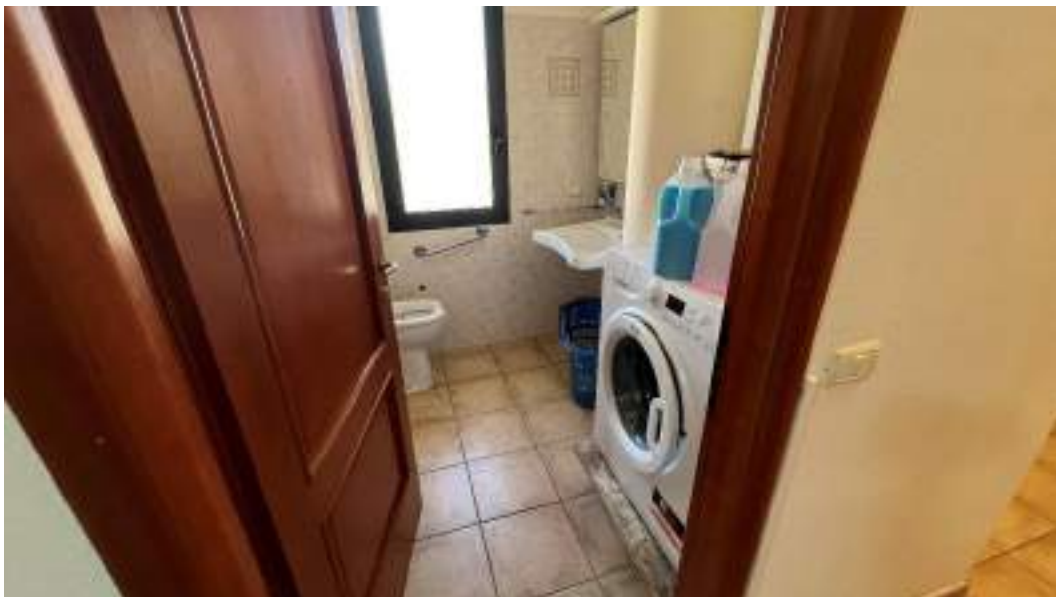
Figura 36 – Viste interne del fabbricato – piano primo