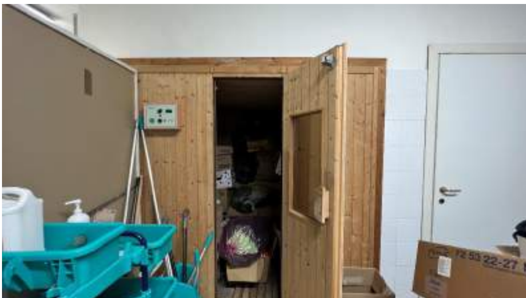
Figura 5 – Viste interne del fabbricato – piano interrato