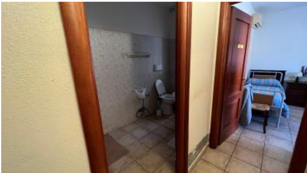
Figura 25 – Viste interne del fabbricato – piano terra