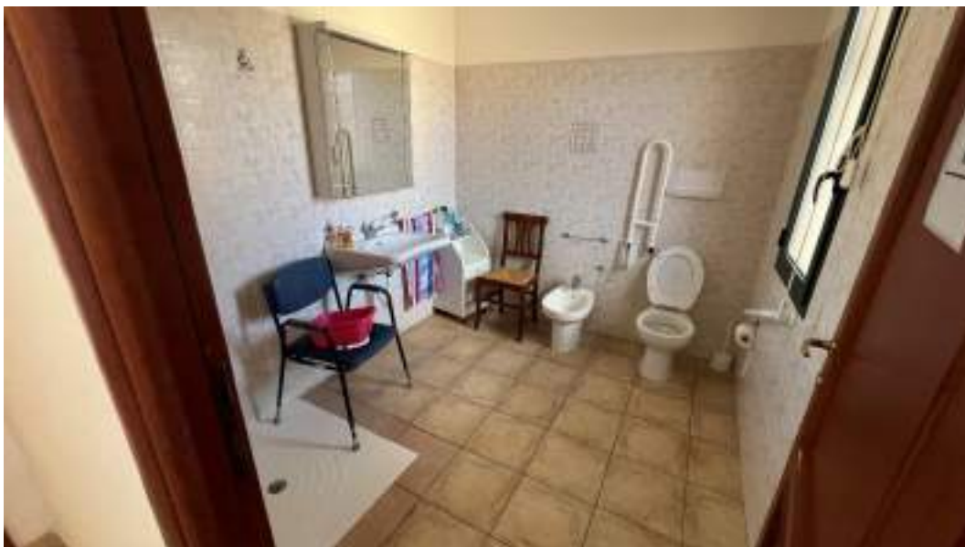
Figura 48 – Viste interne del fabbricato – piano primo