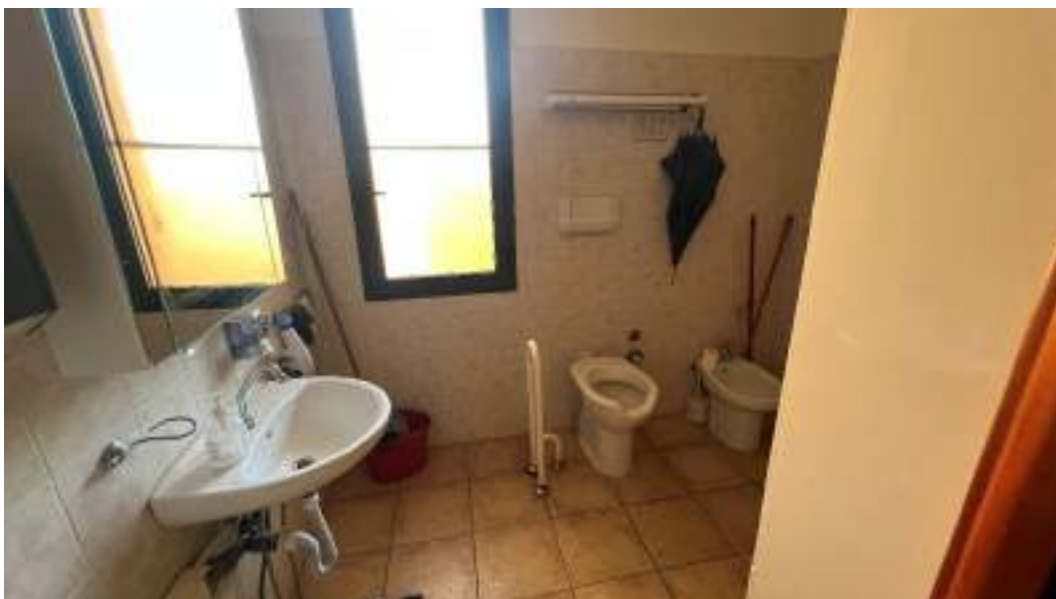
Figura 19 – Viste interne del fabbricato – piano terra