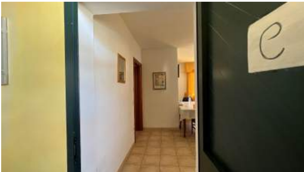
Figura 46 – Viste interne del fabbricato – piano primo