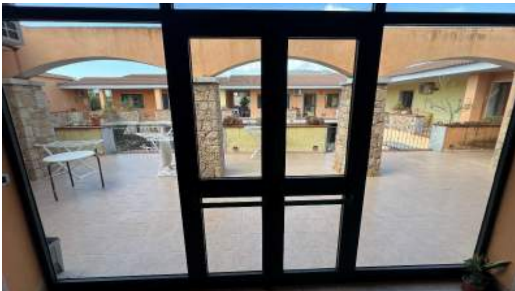
Figura 42 – Viste interne del fabbricato – piano primo