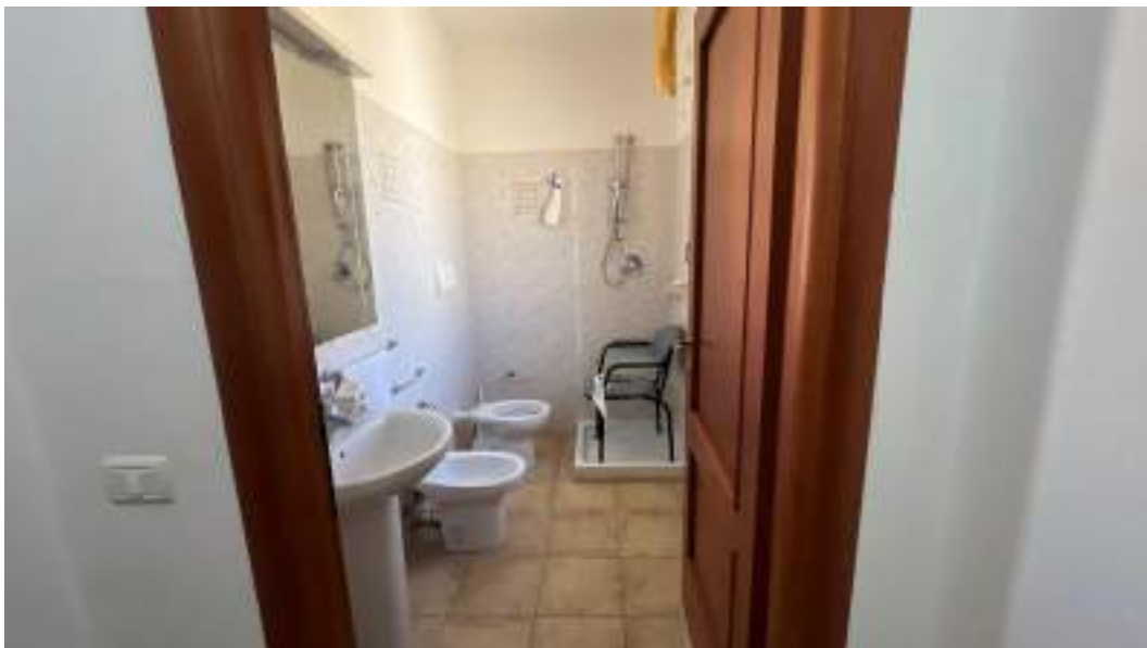
Figura 37 – Viste interne del fabbricato – piano primo