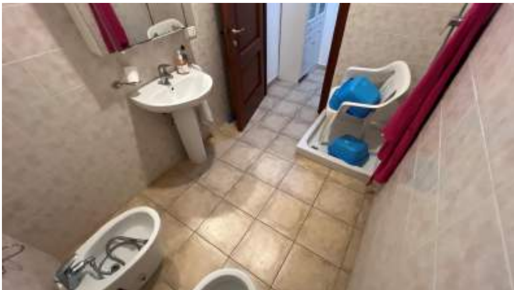
Figura 45 – Viste interne del fabbricato – piano primo