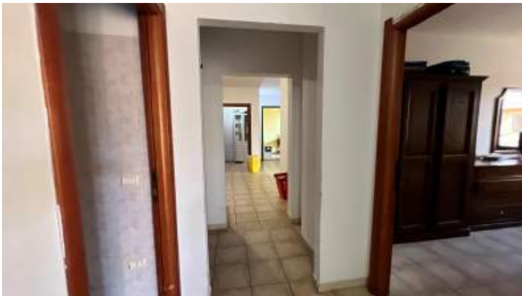
Figura 43 – Viste interne del fabbricato – piano primo