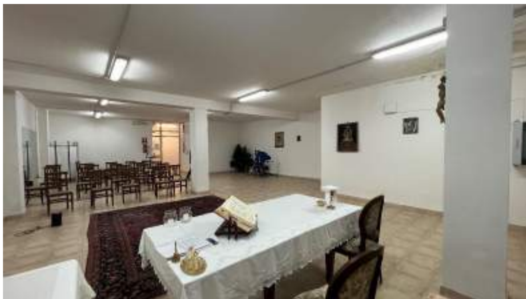
Figura 2 – Viste interne del fabbricato – piano interrato