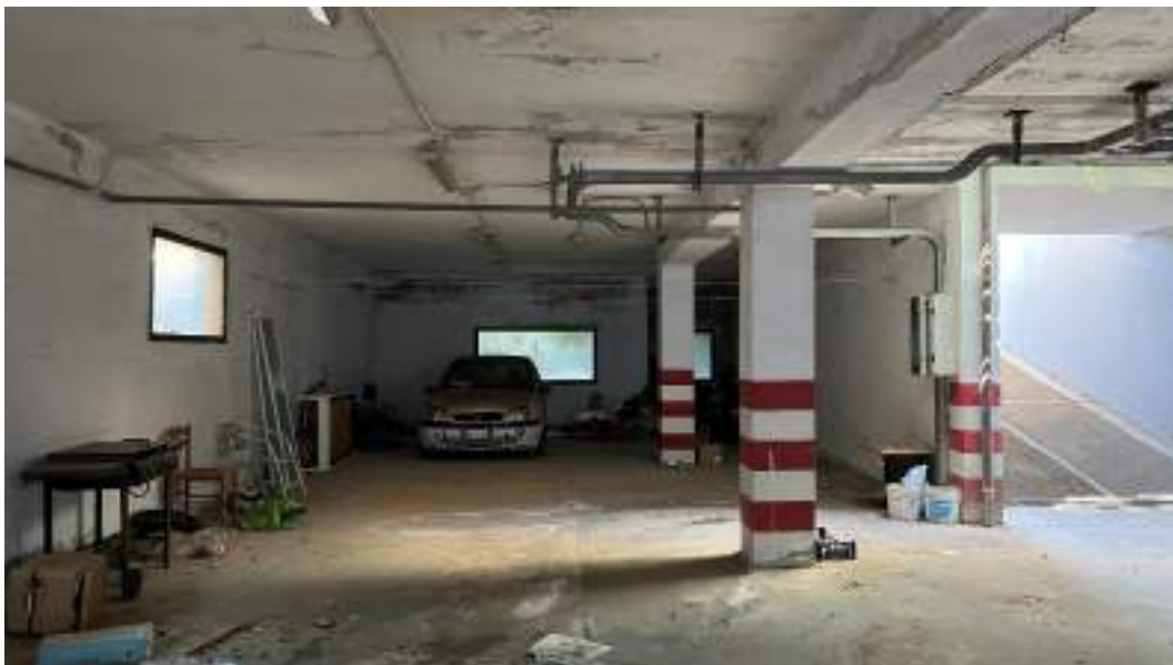
Figura 11 – Viste interne del fabbricato – piano interrato