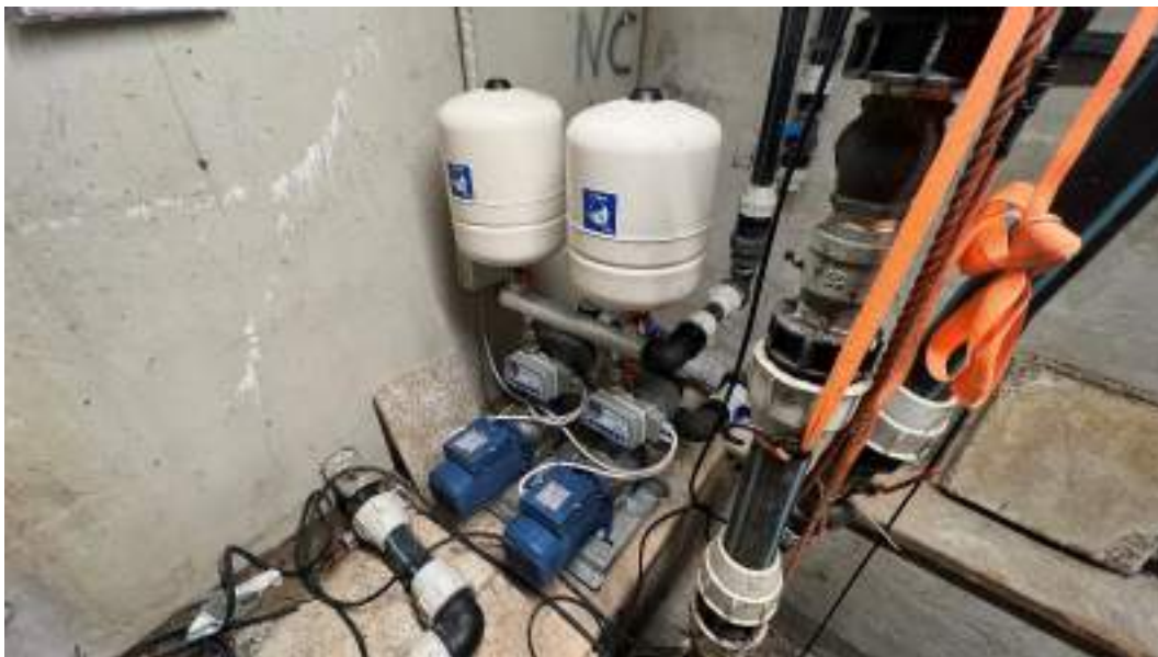
Figura 8 – Viste interne del fabbricato – piano interrato