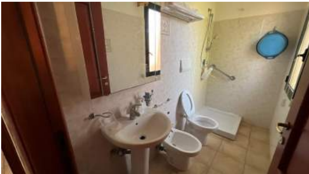
Figura 32 – Viste interne del fabbricato – piano primo