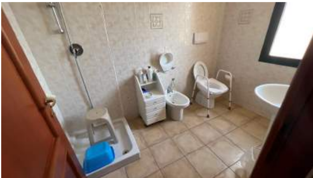
Figura 47 – Viste interne del fabbricato – piano primo