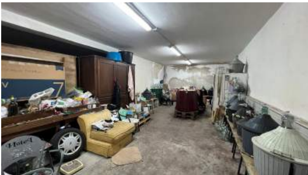
Figura 12 – Viste interne del fabbricato – piano interrato