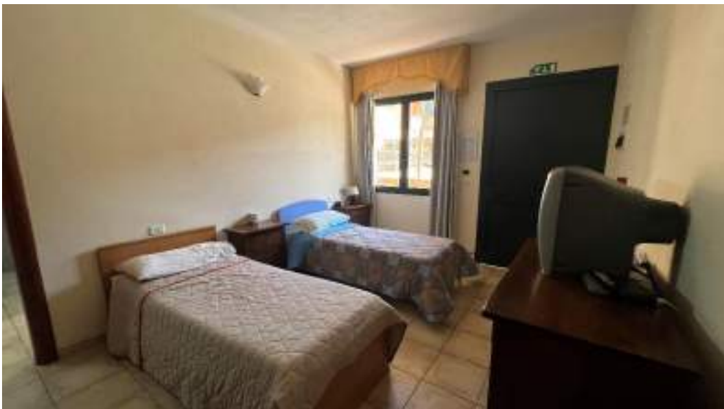
Figura 23 – Viste interne del fabbricato – piano terra