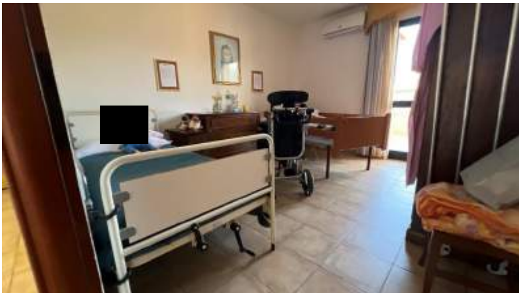
Figura 40 – Viste interne del fabbricato – piano primo