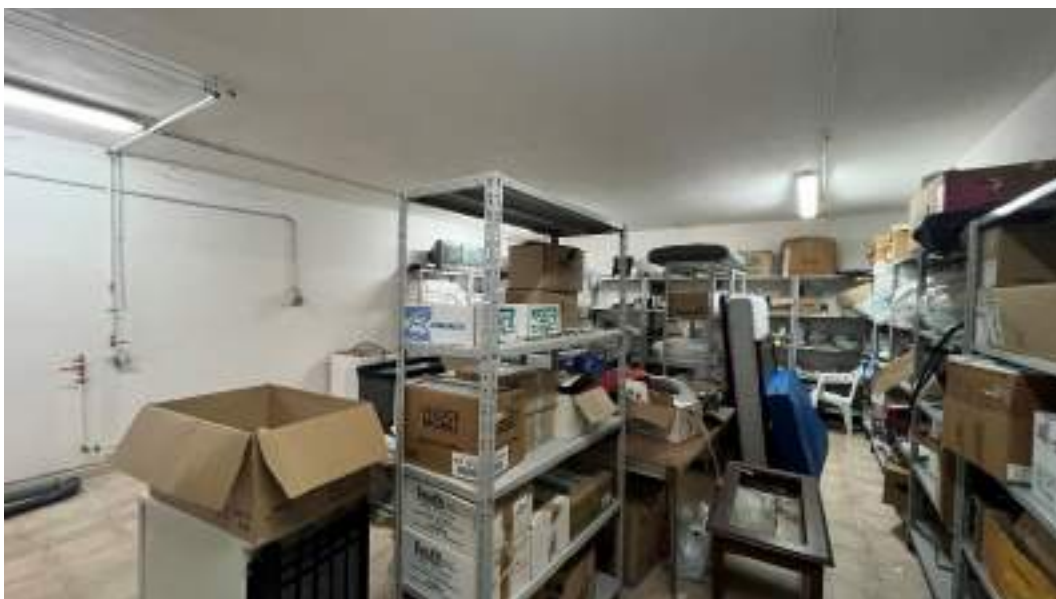
Figura 10 – Viste interne del fabbricato – piano interrato