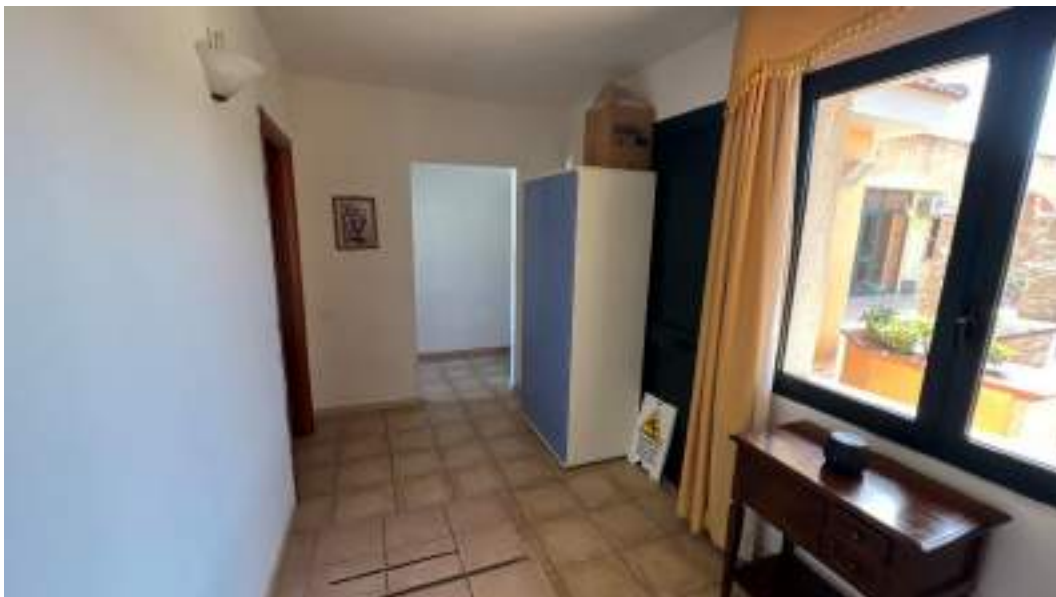
Figura 38 – Viste interne del fabbricato – piano primo