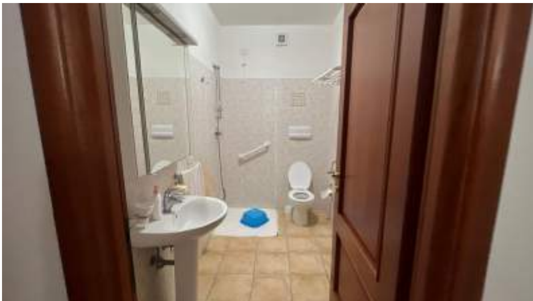
Figura 41 – Viste interne del fabbricato – piano primo