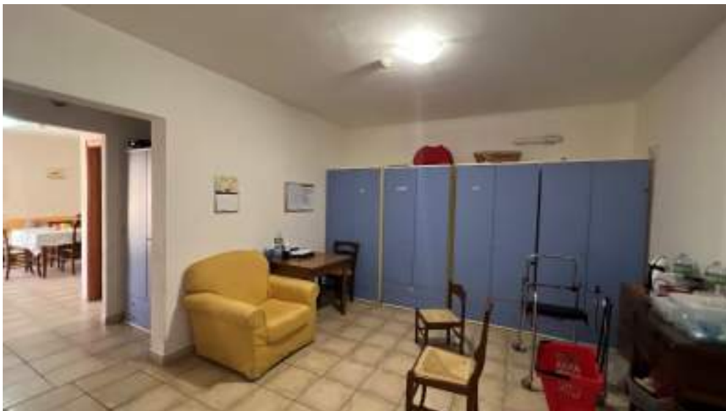
Figura 44 – Viste interne del fabbricato – piano primo