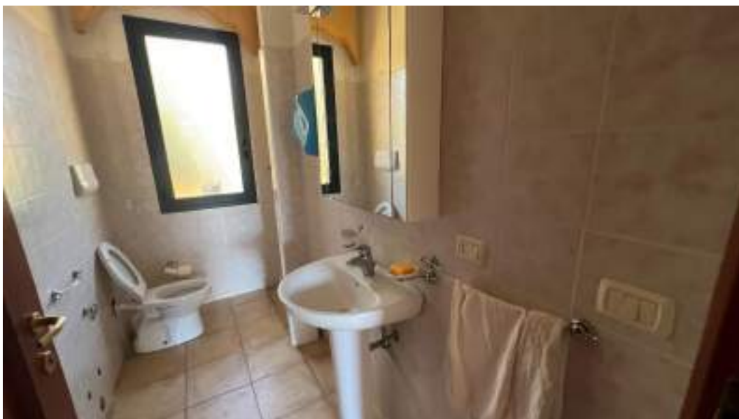
Figura 31 – Viste interne del fabbricato – piano primo