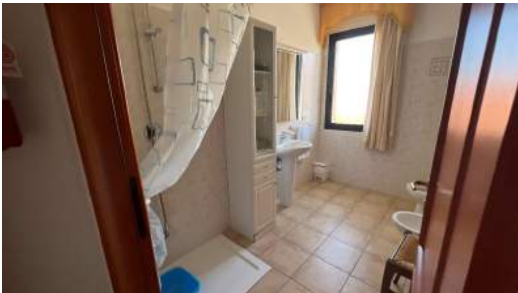
Figura 29 – Viste interne del fabbricato – piano primo