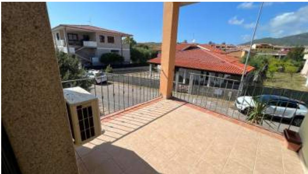
Figura 30 – Viste interne del fabbricato – piano primo