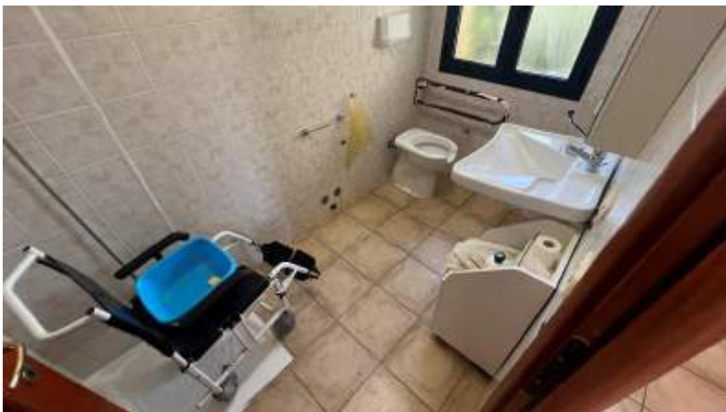
Figura 34 – Viste interne del fabbricato – piano primo