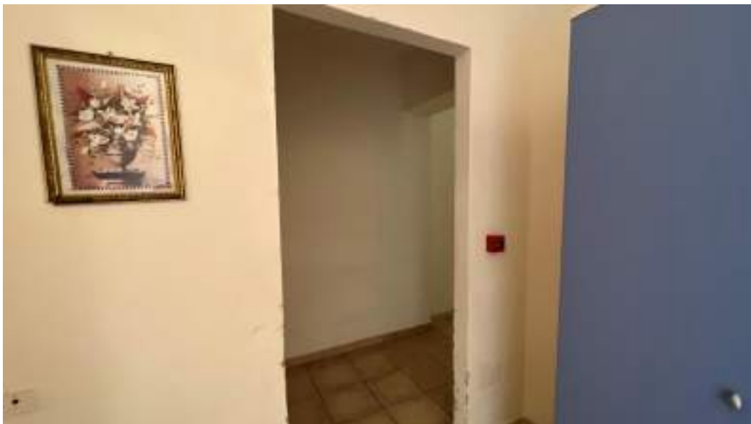
Figura 39 – Viste interne del fabbricato – piano primo