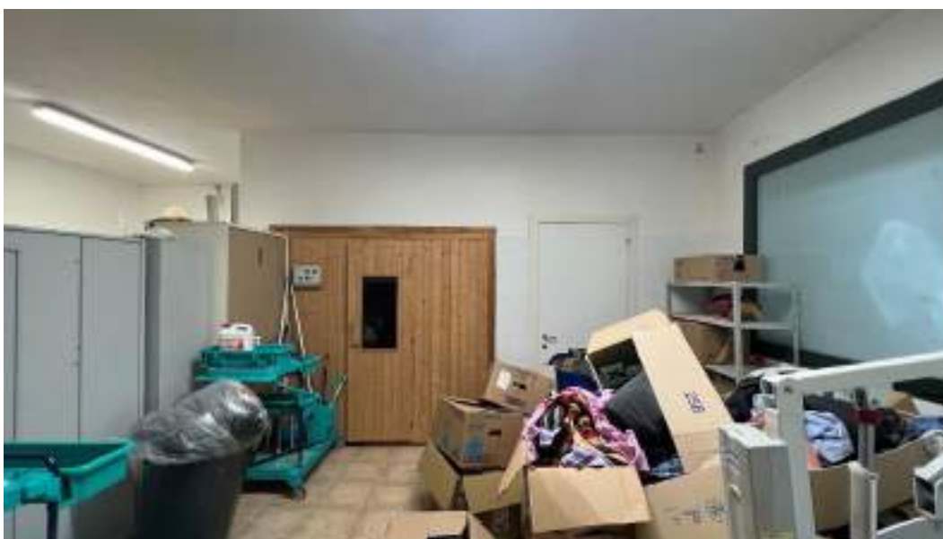
Figura 4 – Viste interne del fabbricato – piano interrato