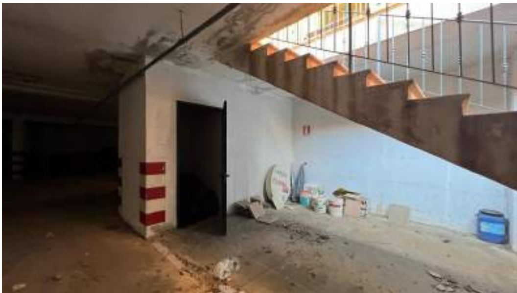
Figura 16 – Viste interne del fabbricato – piano interrato