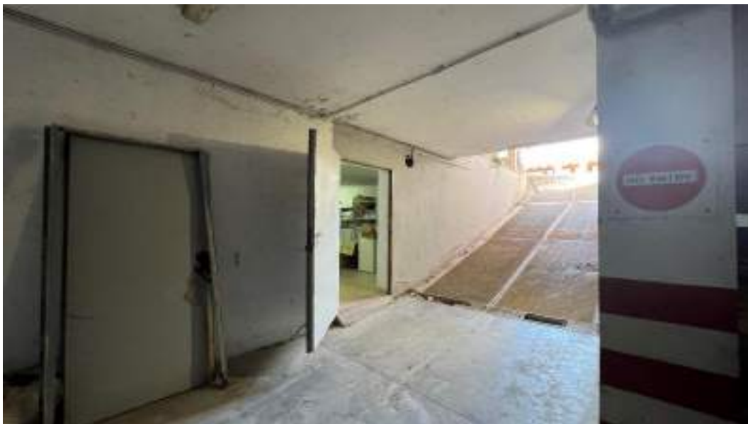
Figura 9 – Viste interne del fabbricato – piano interrato