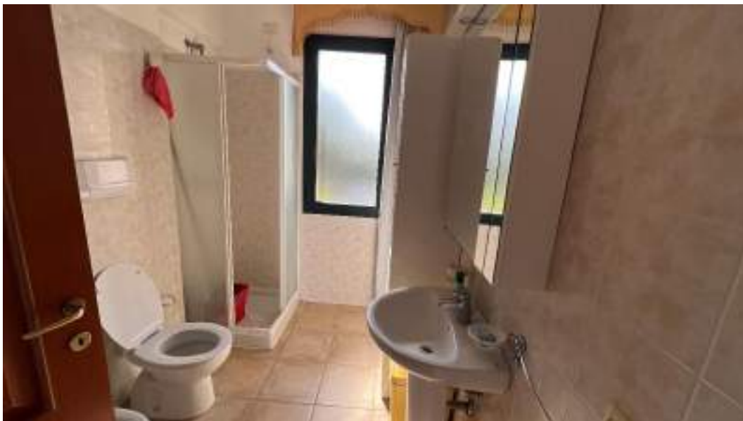
Figura 28 – Viste interne del fabbricato – piano primo