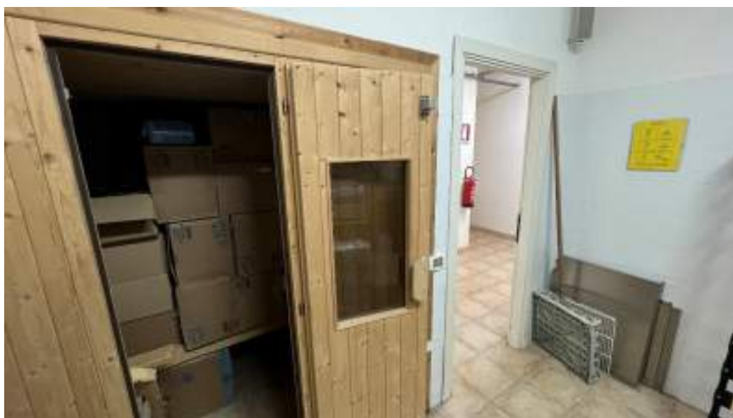
Figura 6 – Viste interne del fabbricato – piano interrato