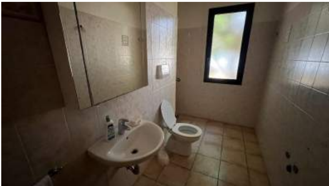
Figura 24 – Viste interne del fabbricato – piano terra