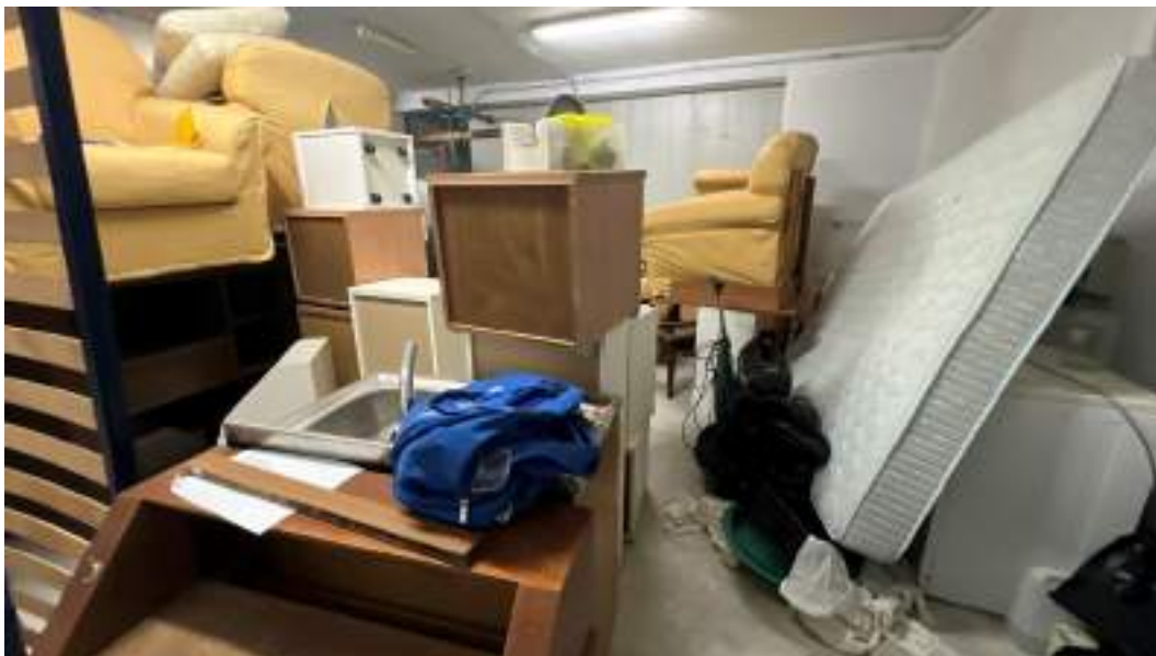
Figura 15 – Viste interne del fabbricato – piano interrato