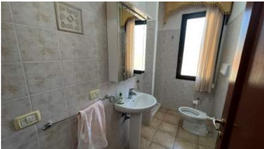
Figura 35 – Viste interne del fabbricato – piano primo