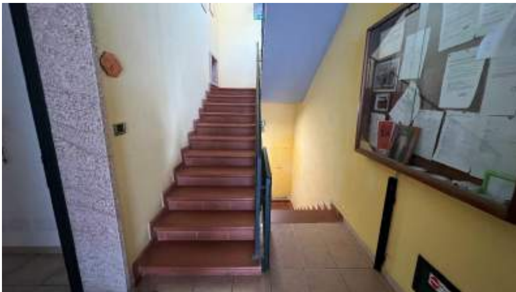
Figura 1 – Viste del percorso di accesso dal piano terra al piano interrato