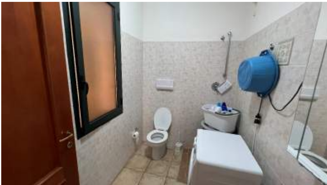
Figura 27 – Viste interne del fabbricato – piano terra