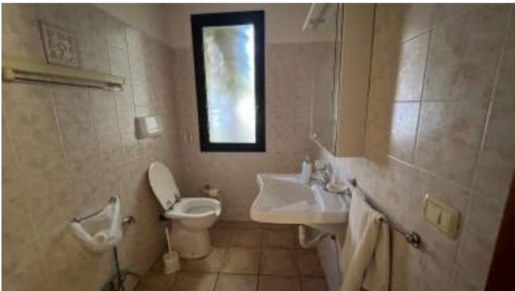
Figura 26 – Viste interne del fabbricato – piano terra