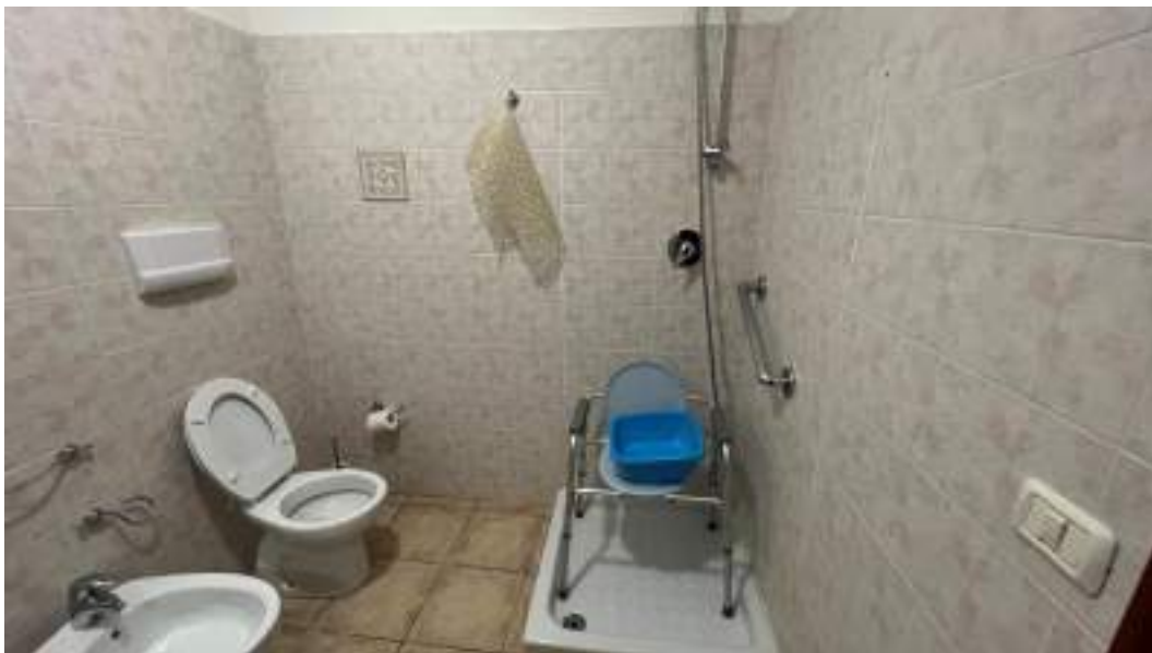
Figura 21 – Viste interne del fabbricato – piano terra