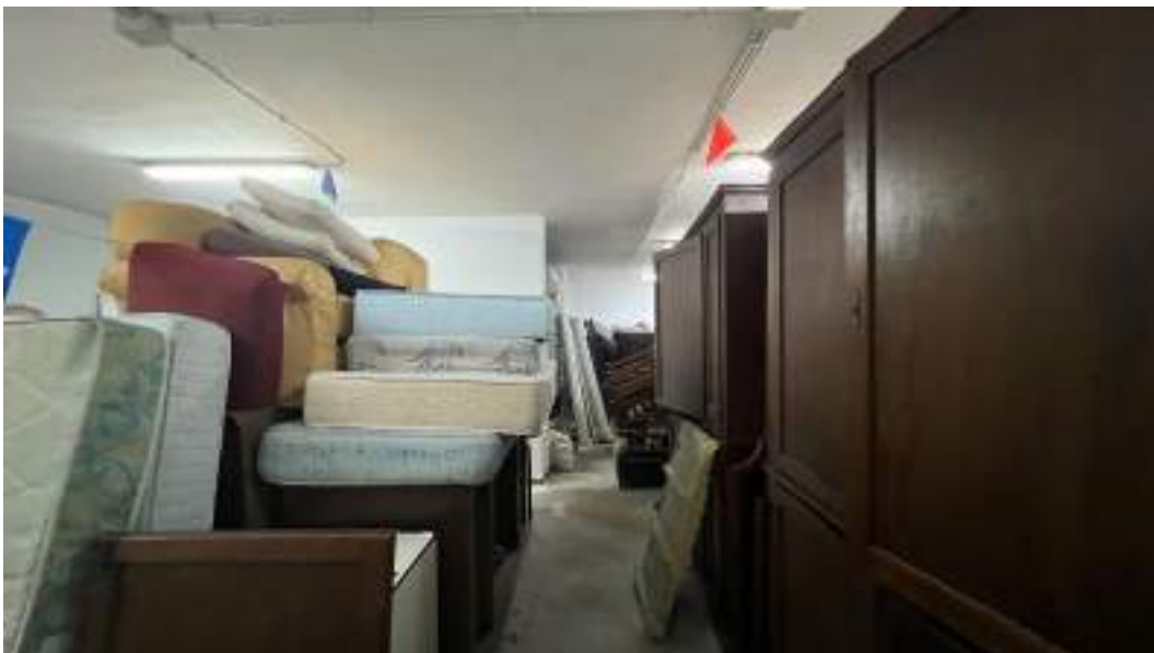
Figura 14 – Viste interne del fabbricato – piano interrato