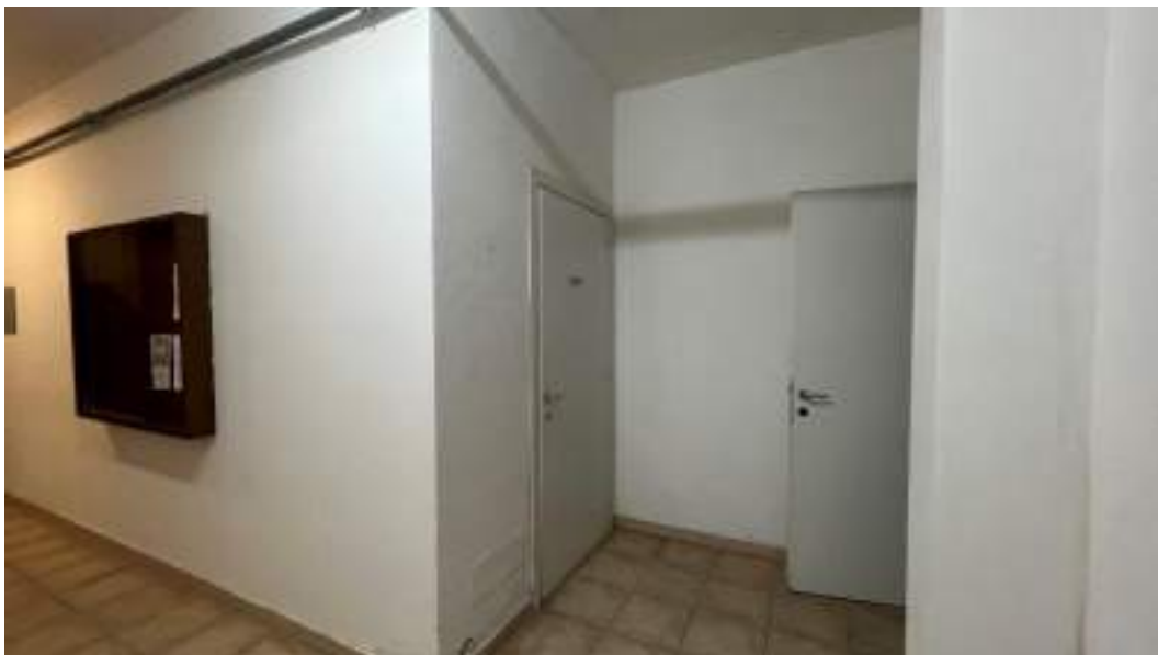
Figura 3 – Viste interne del fabbricato – piano interrato