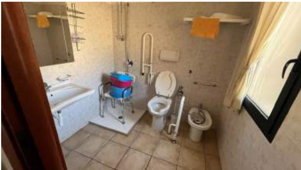
Figura 18 – Viste interne del fabbricato – piano terra