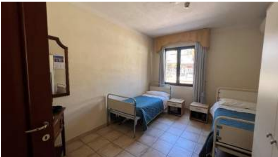
Figura 20 – Viste interne del fabbricato – piano terra