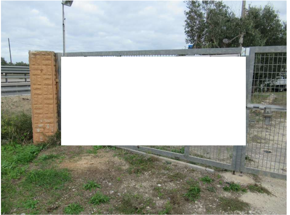
Accesso carraio posto sull'angolo.