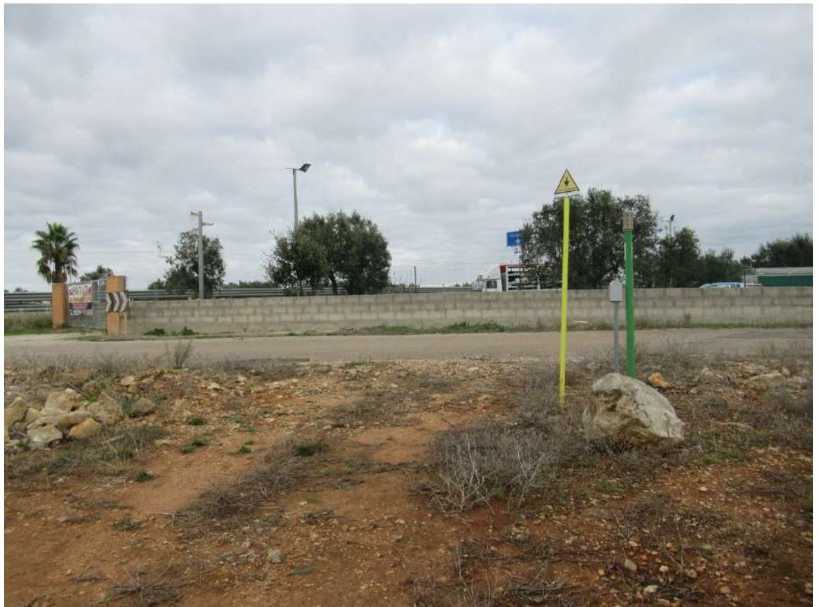
Strada Comunale di accesso al lotto recintato. Si nota l'accesso carraio posto sull'angolo.