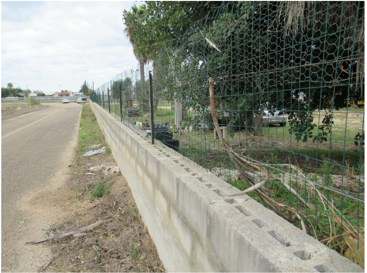
Strada Comunale di accesso al lotto recintato.