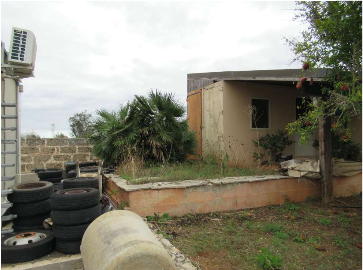
6 di 6