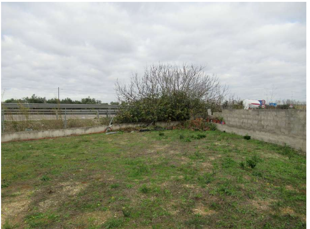
Confine nord Lungo la SS101. Angolo.