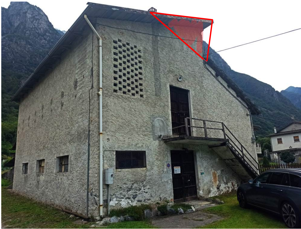
Porzione in "Rosso" non conforme al titolo edilizio