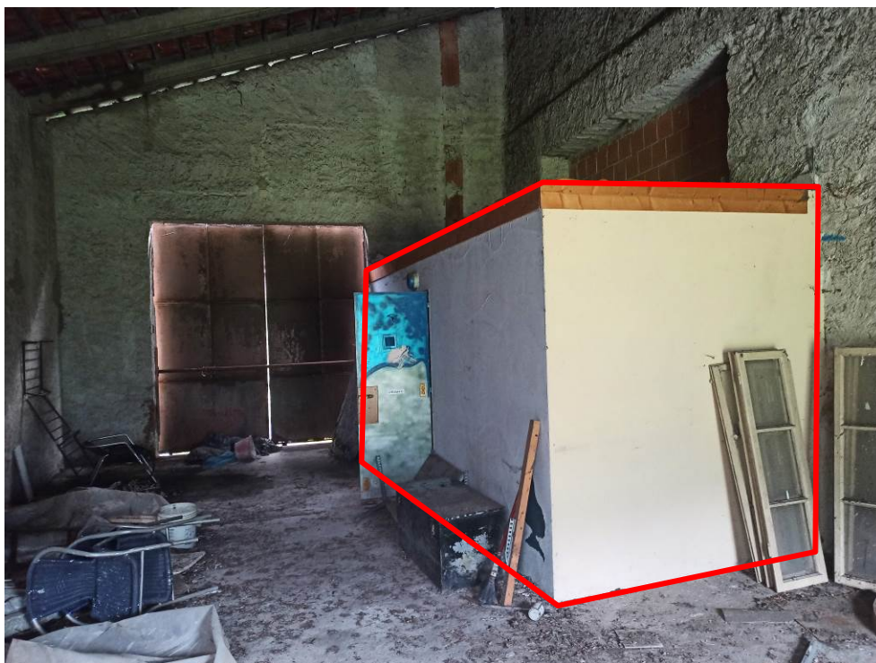
Vano non autorizzato