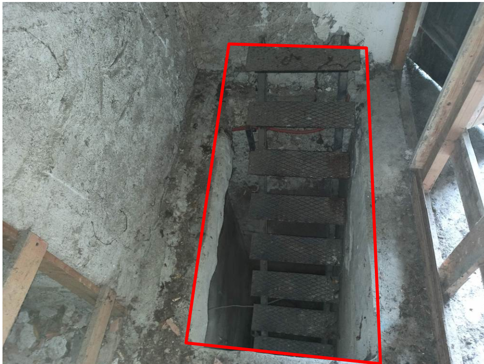
Scala interna di collegamento piano terra e primo