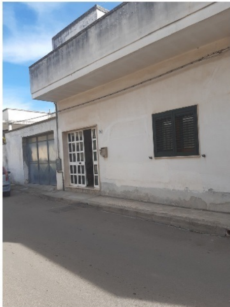
Ingresso principale da via Gioberti n. 6

L'intero edificio sviluppa n. 1 piano fuori terra. Immobile costruito nel 1969.