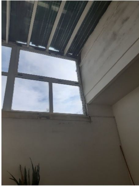
Copertura cortile da smontare