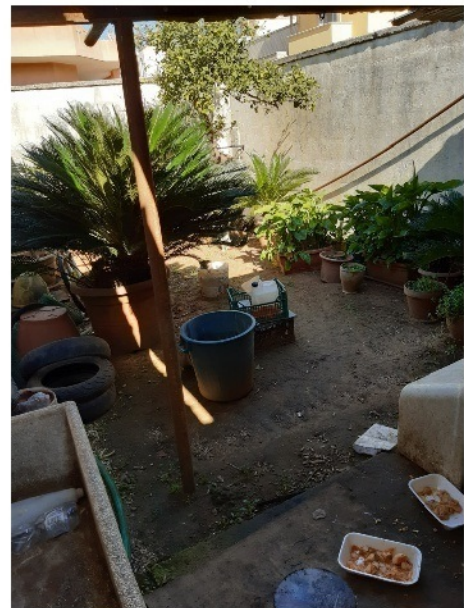
Giardino di pertinenza