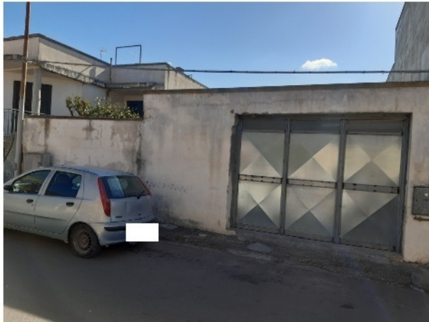
Ingresso locale da demolire via Gioberti