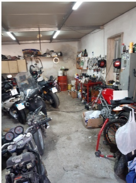
Interno locale da demolire