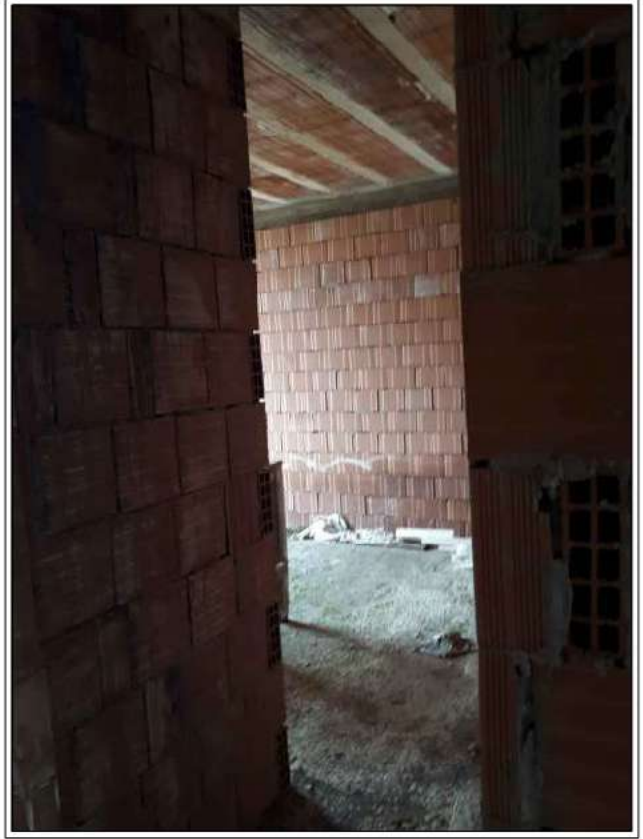
PT - sub 2