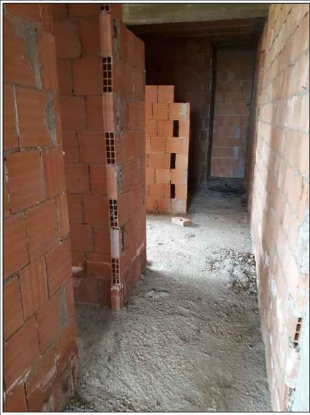
Piano S1 - sub 1