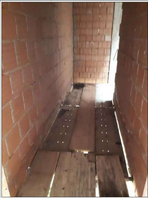
PT - sub 2, apertura scala