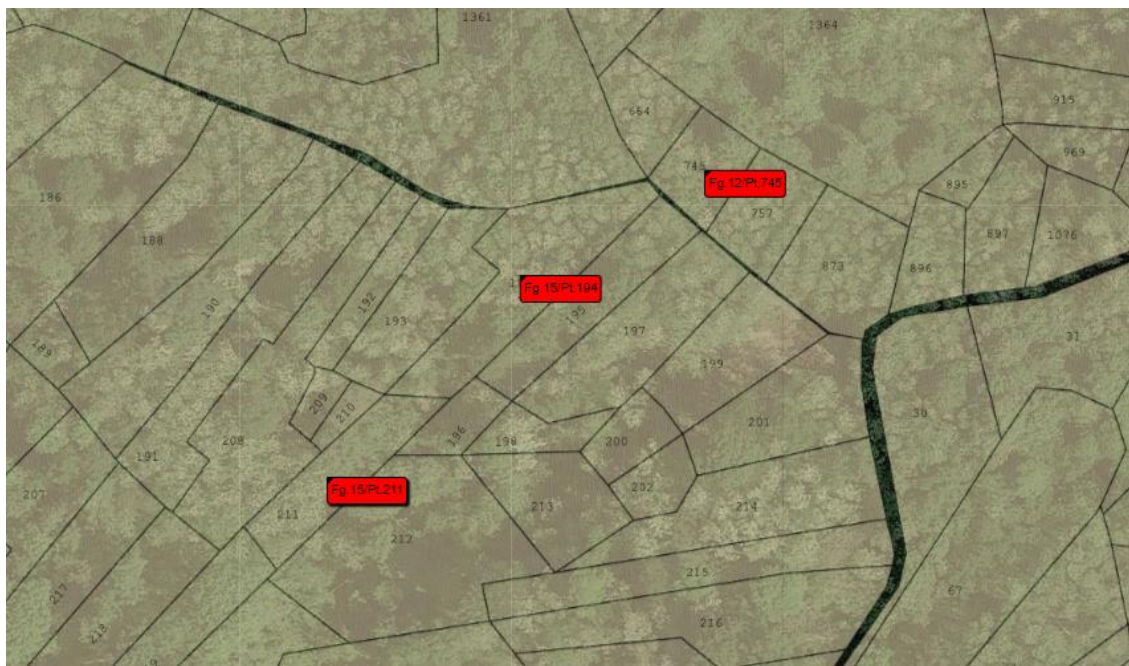
Foto 3: Vista aerea e catastale del foglio 12 mappale 745 e del foglio 15 mappali 194 e 211.