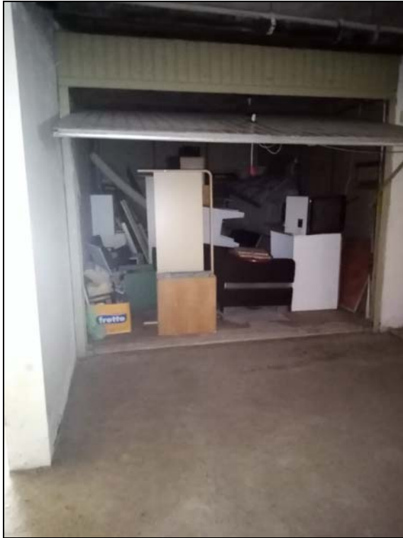
autorimessa sub 74