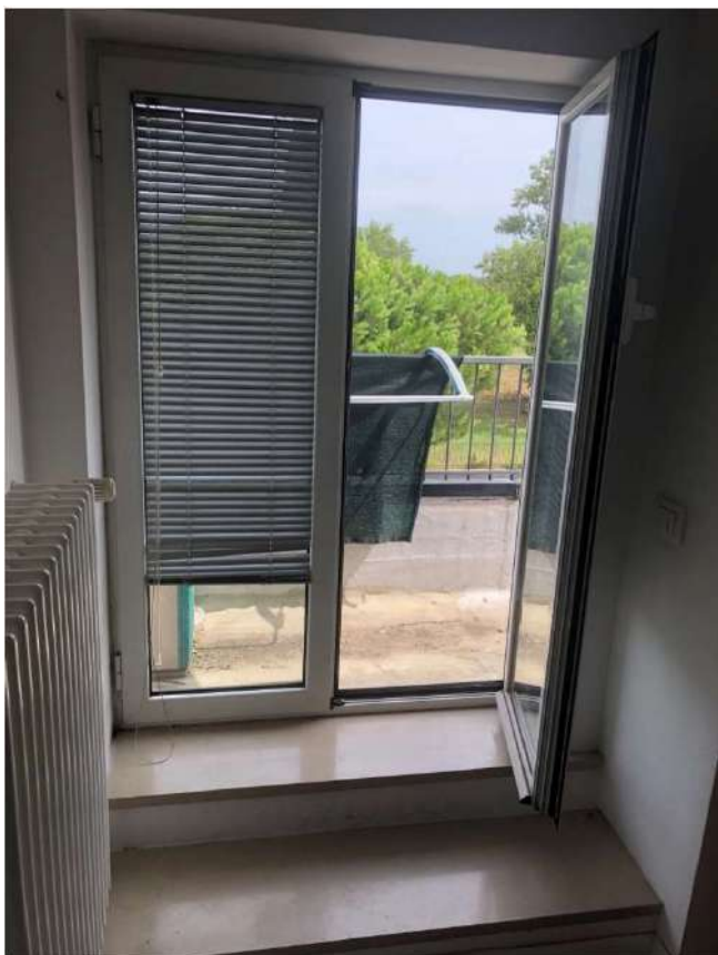
Foto 18 - terrazzo