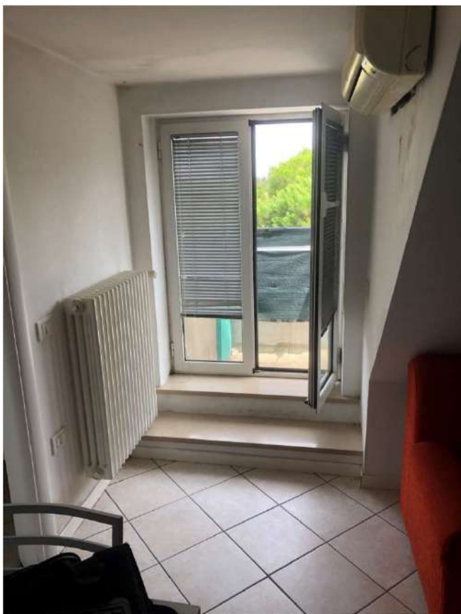
Foto 8 - sottotetto