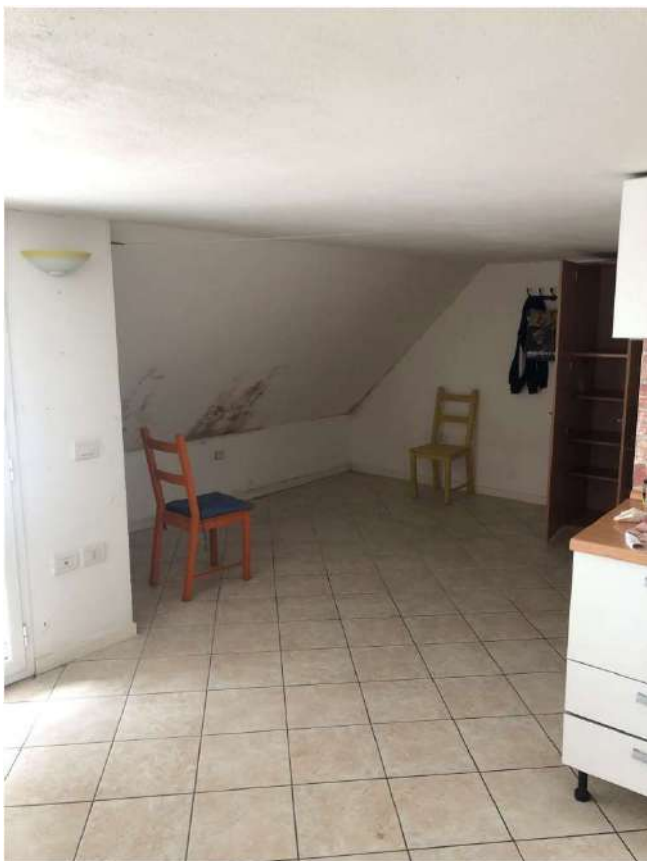
Foto 10 - sottotetto