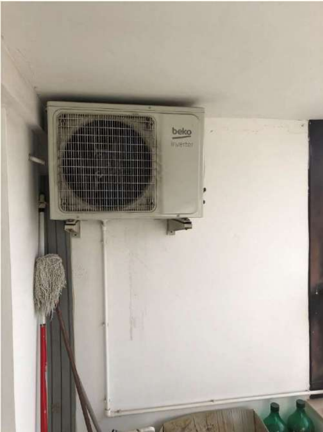
Foto 12 - terrazzo