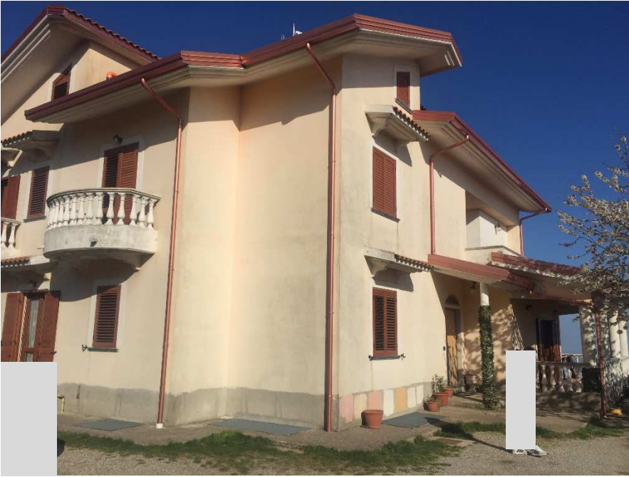
Foto 1- Veduta esterna villino