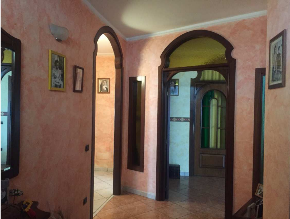
Foto 3- Interno appartamento livello piano terra