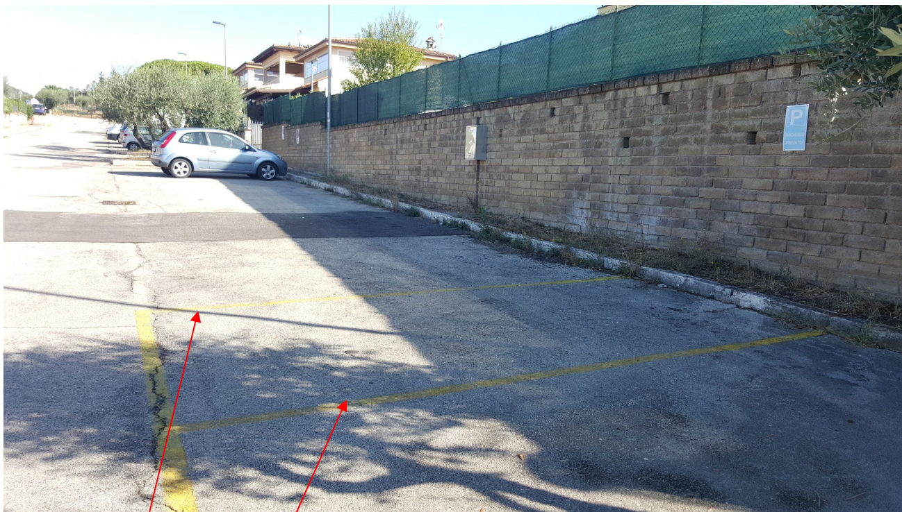
FOTO POSTI AUTO N. 38-39