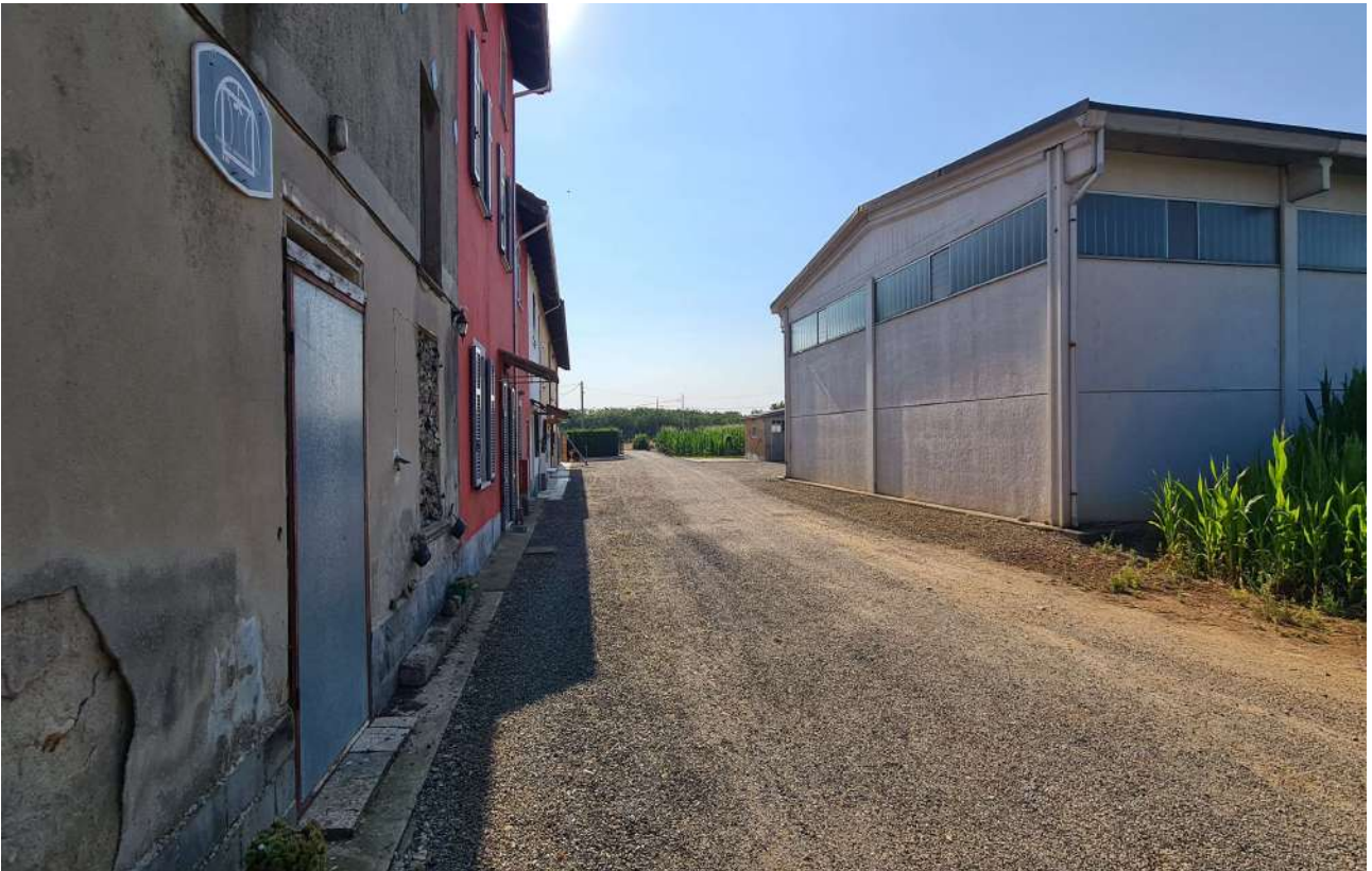
Fotografia 5: prospetto Nord casa e corte di pertinenza gravata da servitù di passaggio ai fondi agricoli più a Est