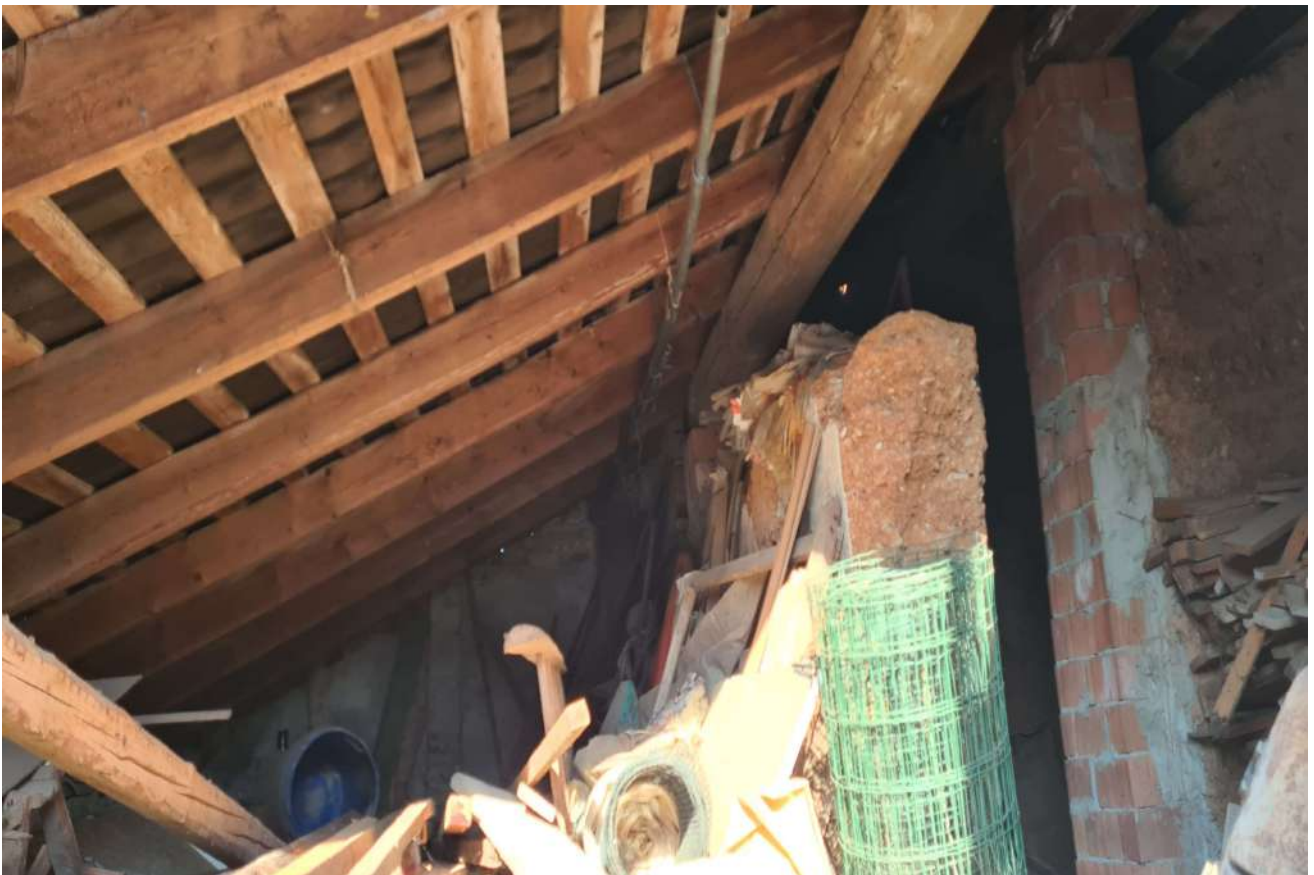
Fotografia 22: stralcio sottotetto non censito sub. 4