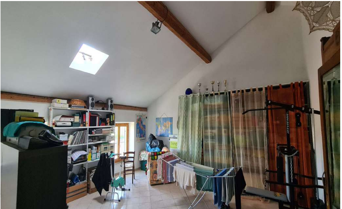
Fotografia 15: stralcio sottotetto Sud