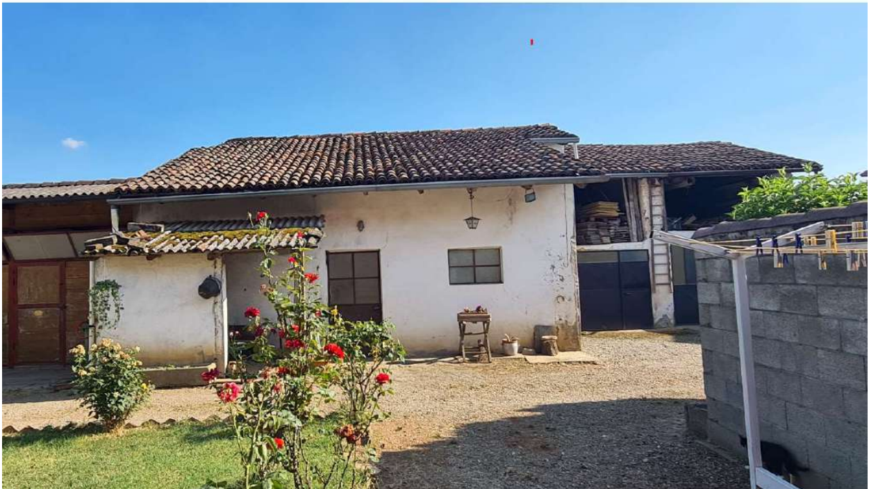
Fotografia 6: area di corte Sud gravata da servitù di passaggio – a sx visibile tettoia non licenziata a livello edilizio