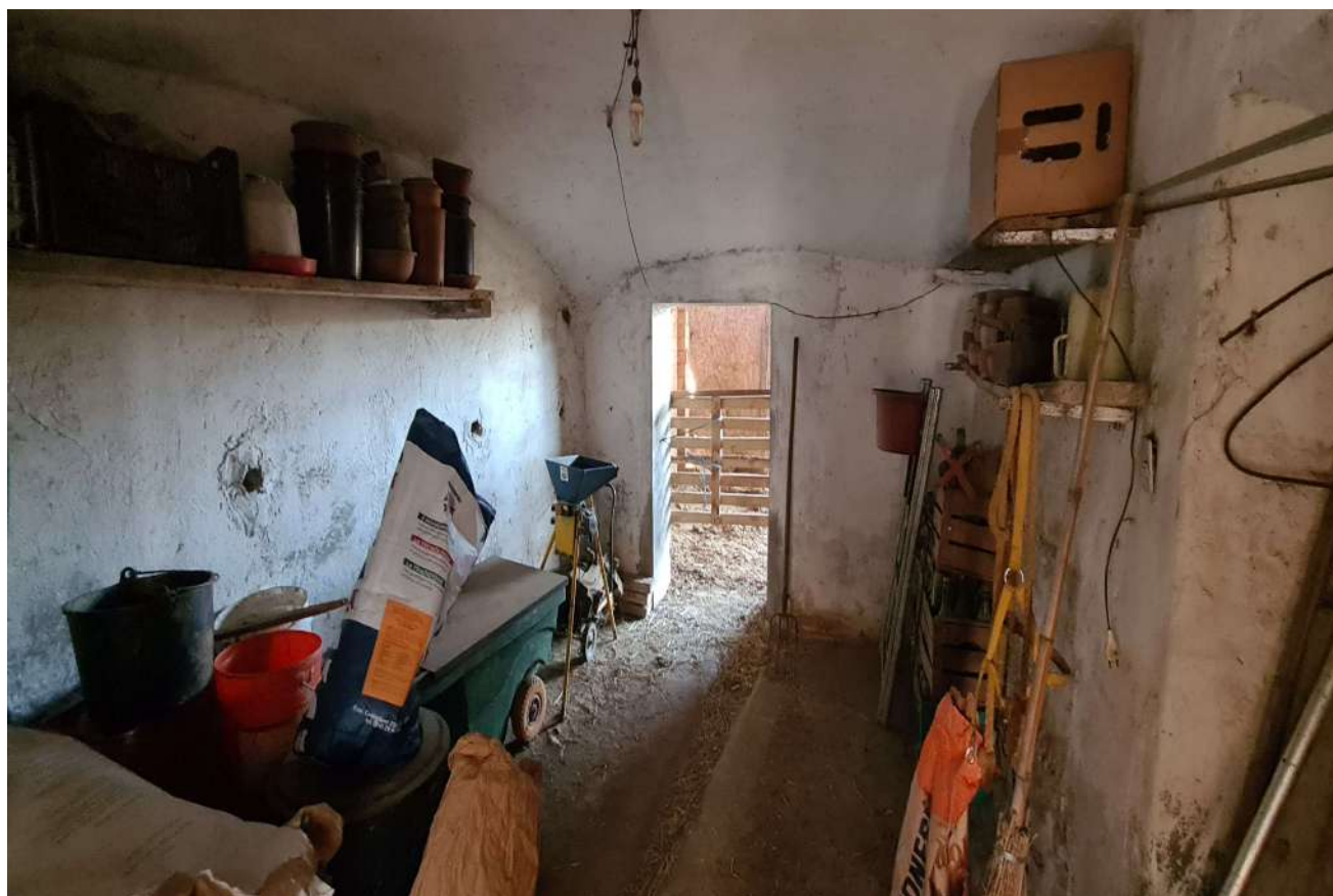
Fotografia 18: magazzino sub. 4 ex stalla