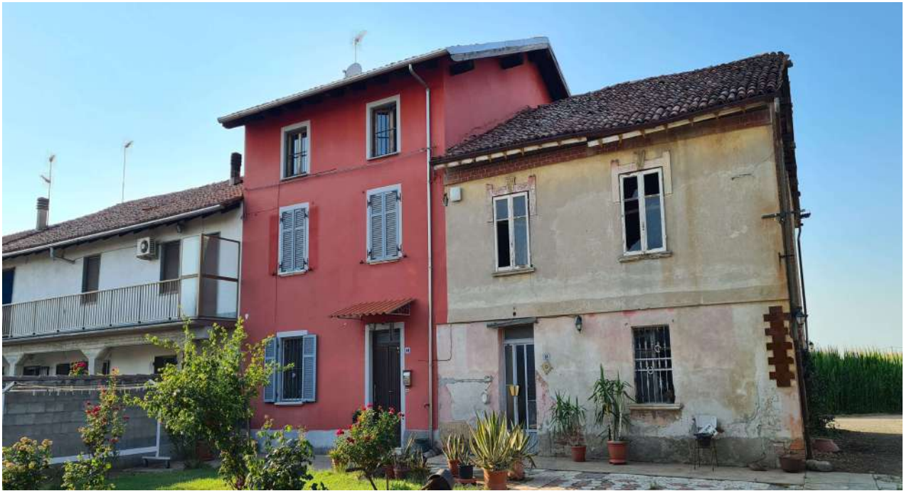
Fotografia 1: prospetto sud (solo casa tinteggiata in colore amaranto)