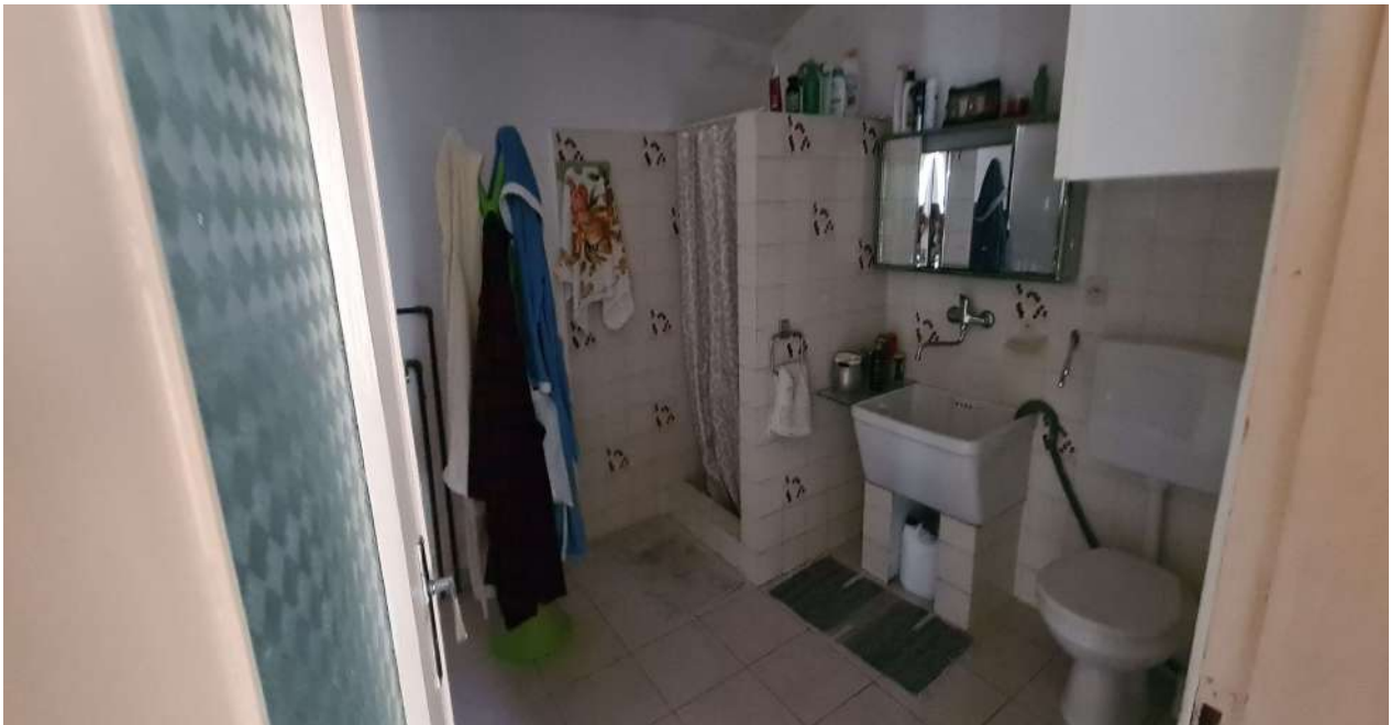
Fotografia 10: stralcio bagno P.T.