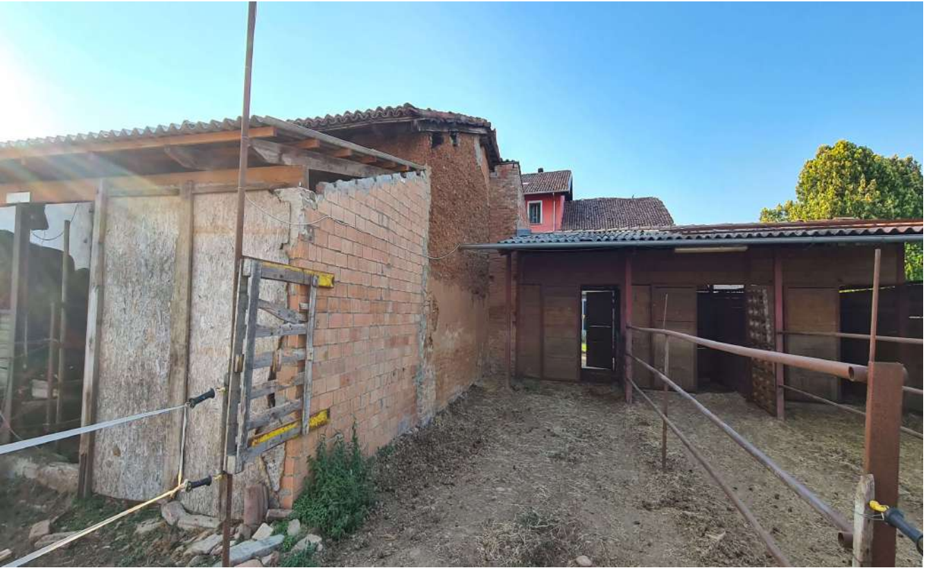
Fotografia 19: prospetto Est Corpo B