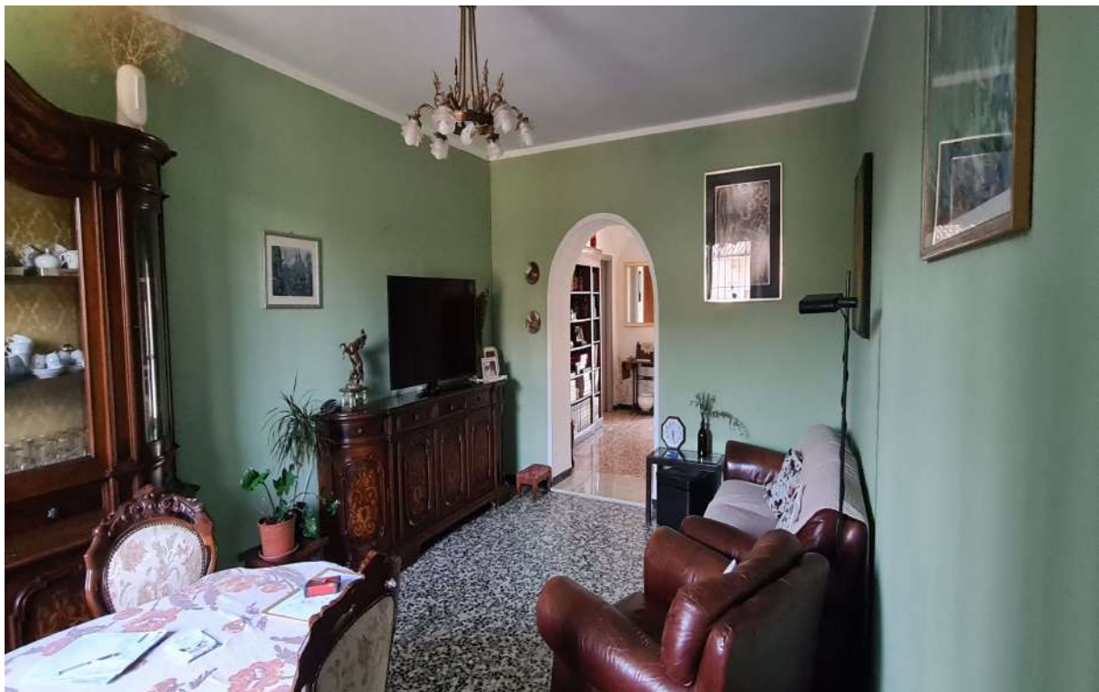
Fotografia 8: stralcio sala