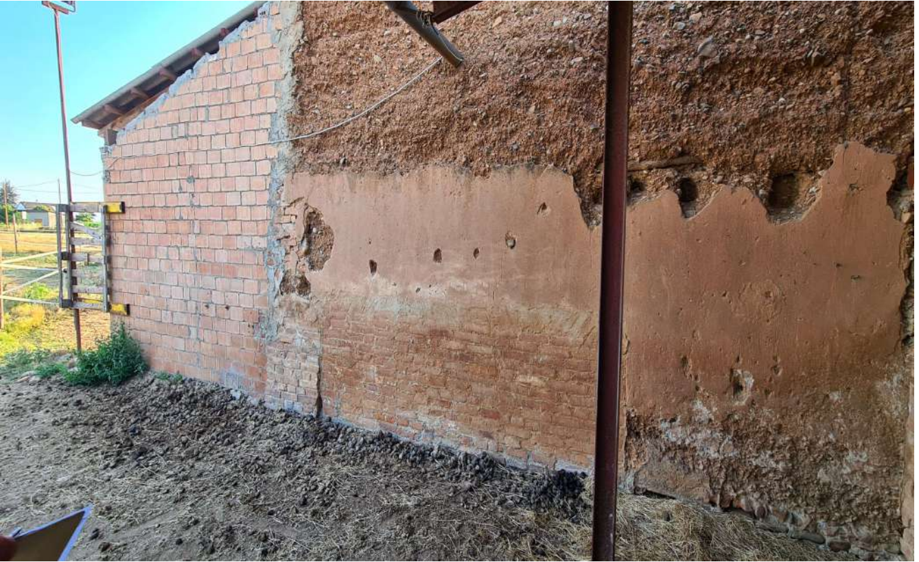
Fotografia 21: prospetto Est Corpo B