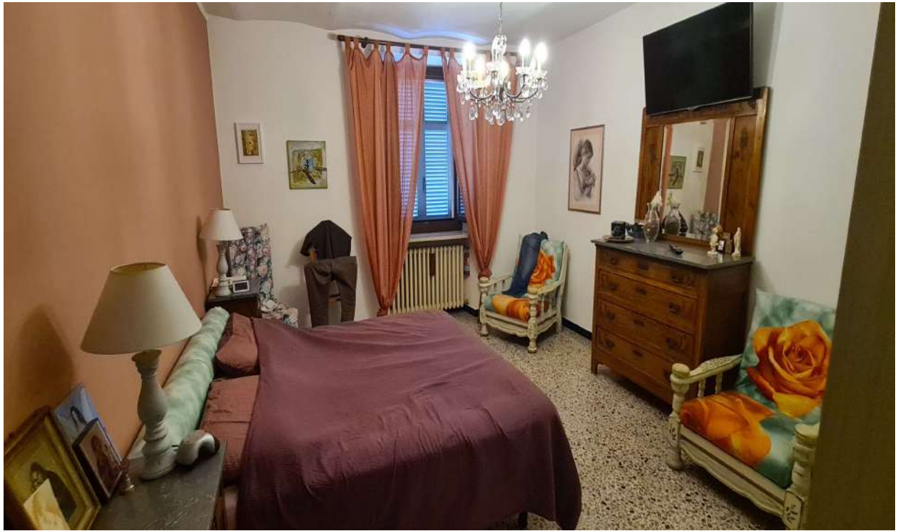
Fotografia 13: stralcio camera al piano primo