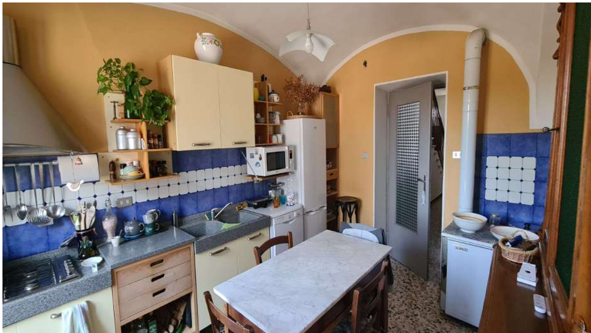
Fotografia 11: stralcio cucina