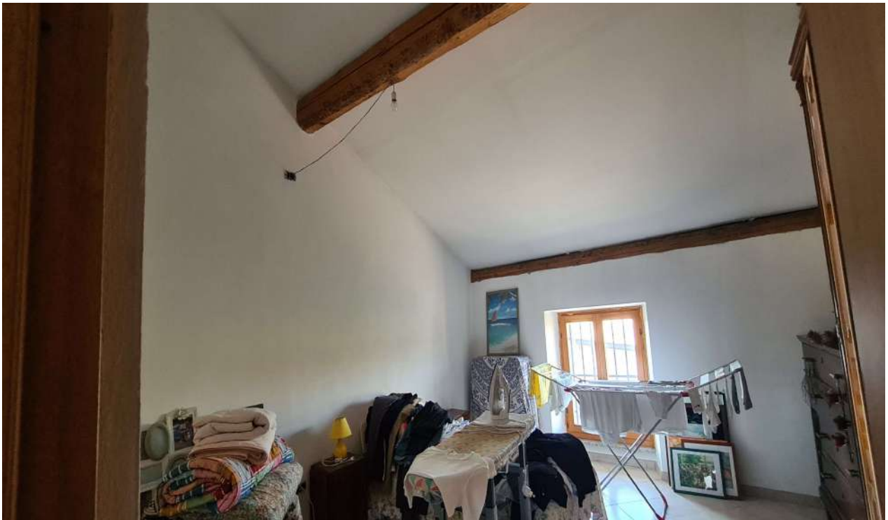
Fotografia 14: stralcio sottotetto Nord