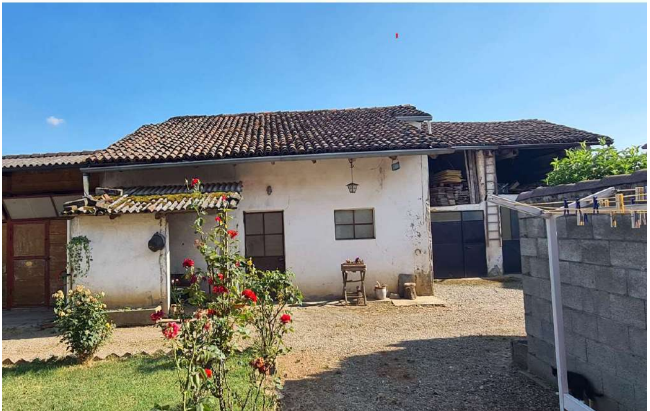
Fotografia 16: Prospetto sud magazzini sub. 4