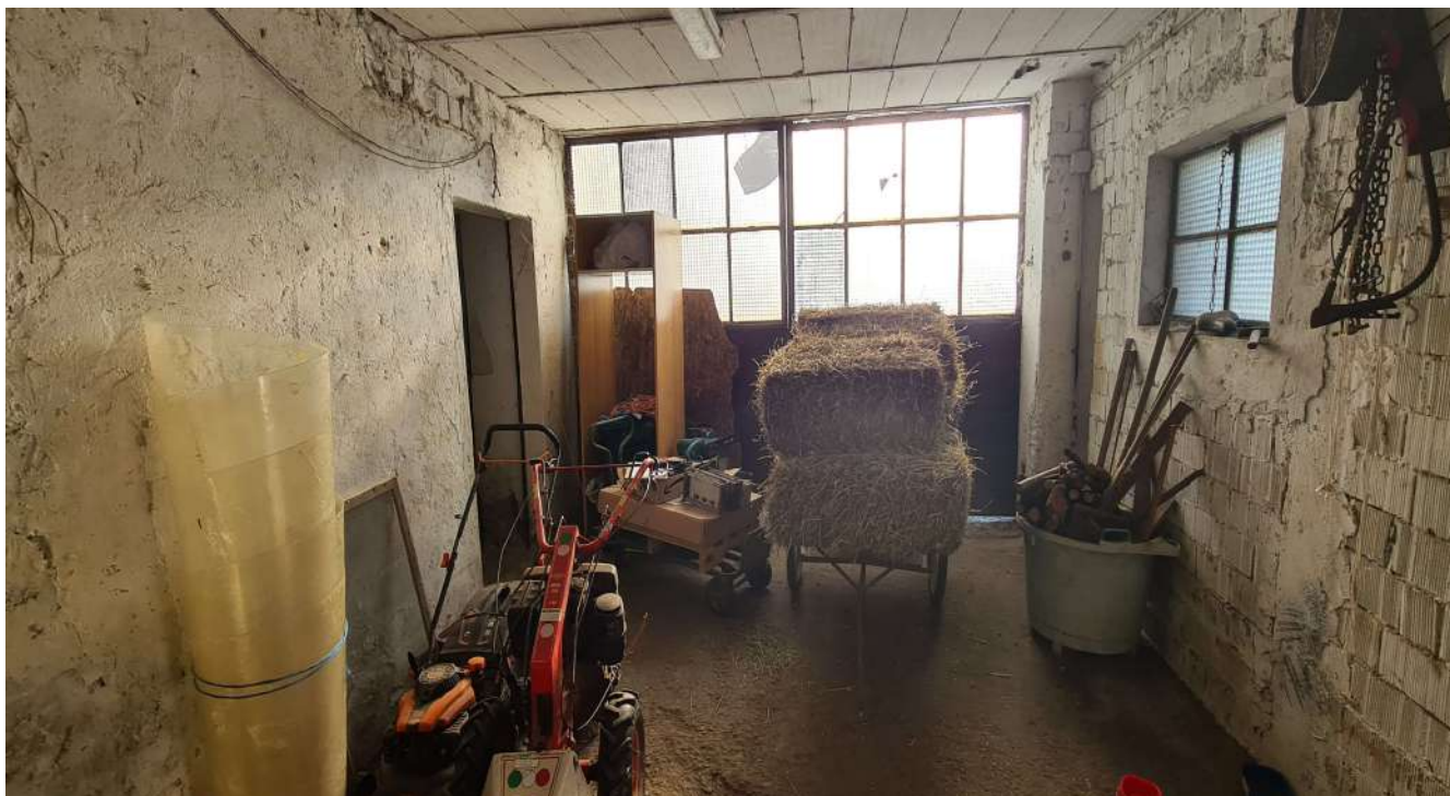
Fotografia 17: magazzino più a nord sub. 4