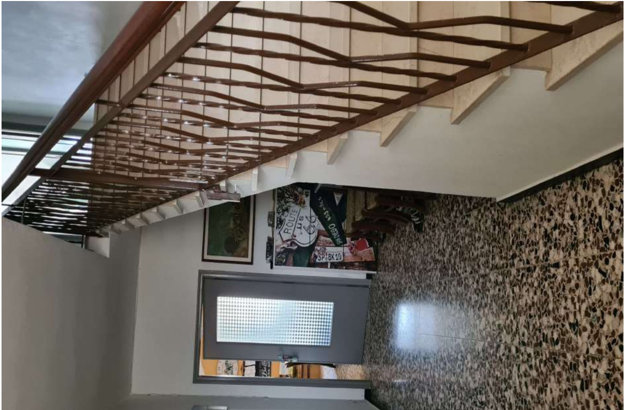
Fotografia 7: ingresso abitazione e scala di accesso ai piani superiori