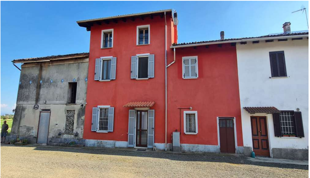
Fotografia 3: prospetto Nord (casa tinteggiata in colore amaranto)