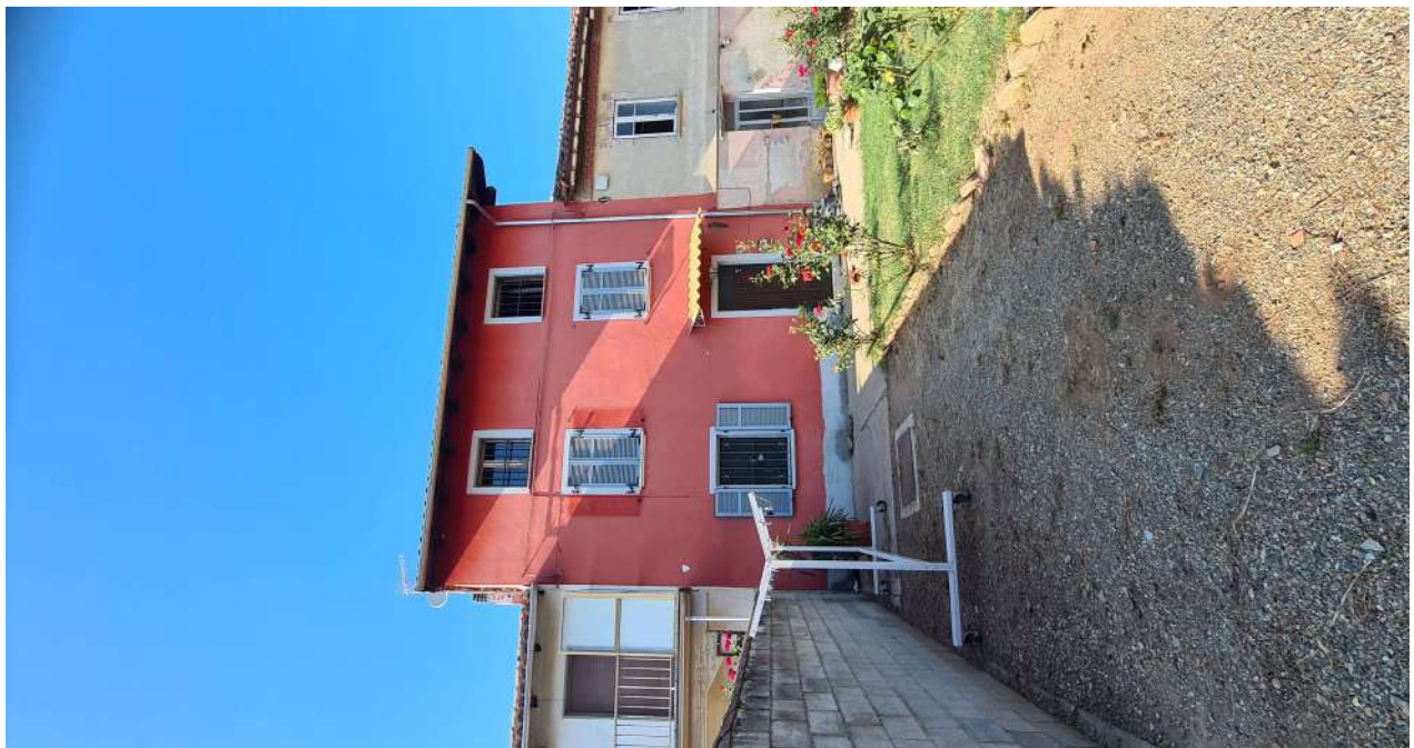
Fotografia 2: prospetto sud (casa tinteggiata in colore amaranto)