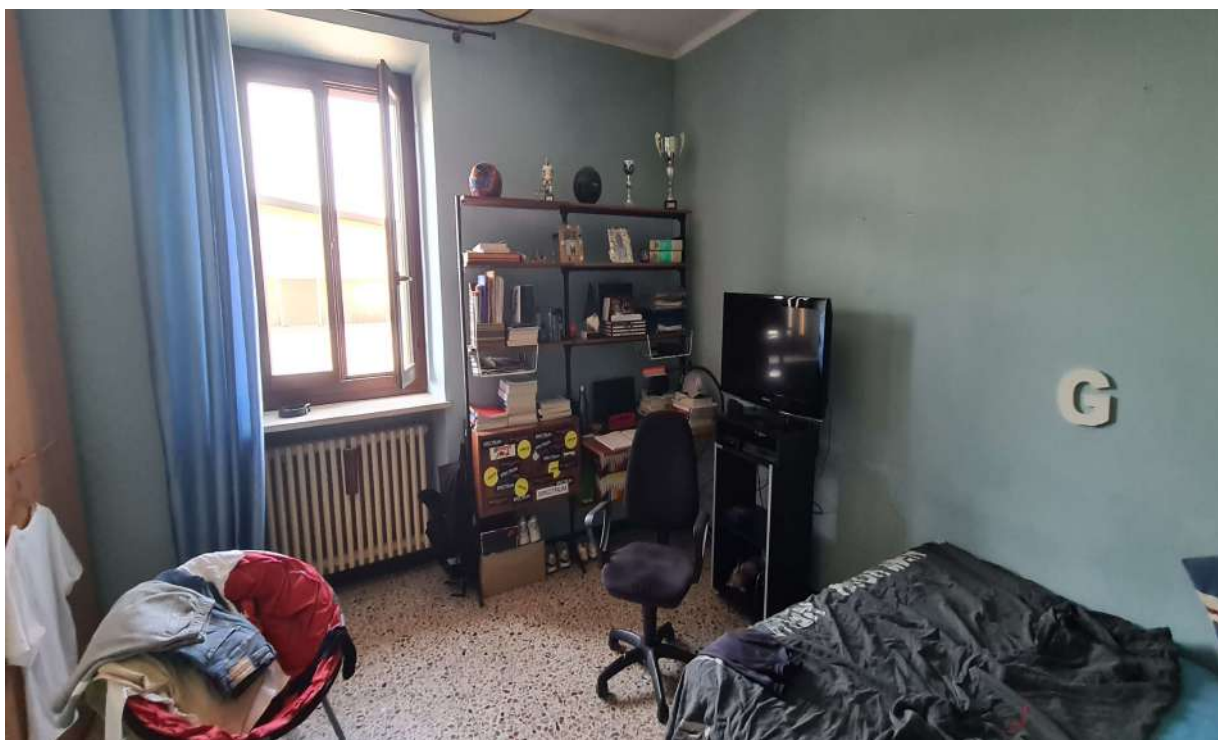
Fotografia 12: stralcio camera al piano primo