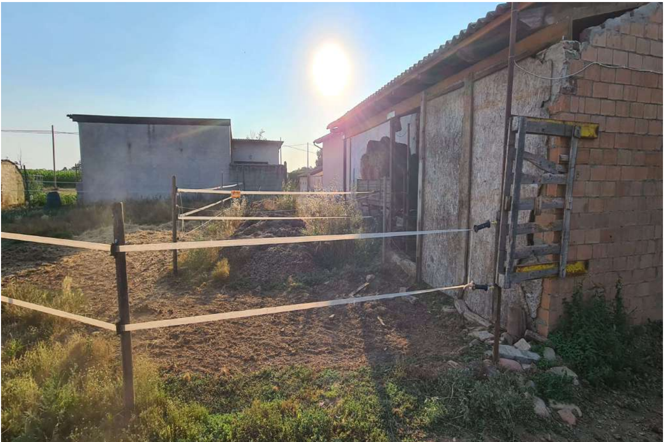
Fotografia 20: Prospetto sud Corpo B