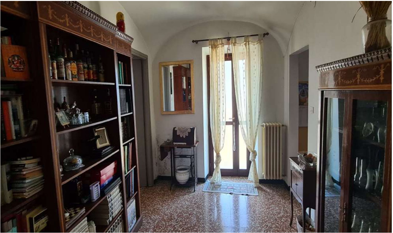
Fotografia 9: stralcio soggiorno