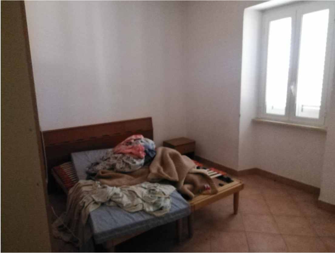
Foto 7 camera letto 2