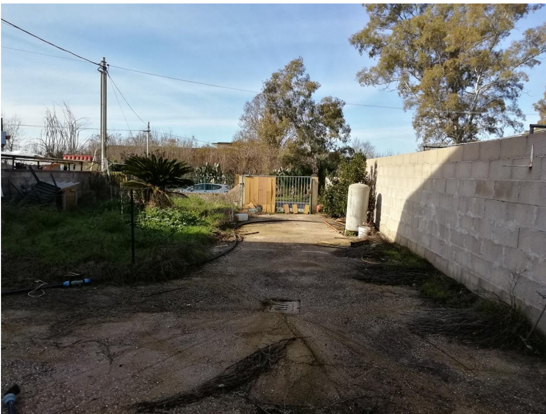
Foto 2 corte di pertinenza