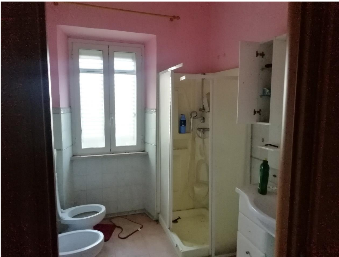
Foto 8 bagno 2