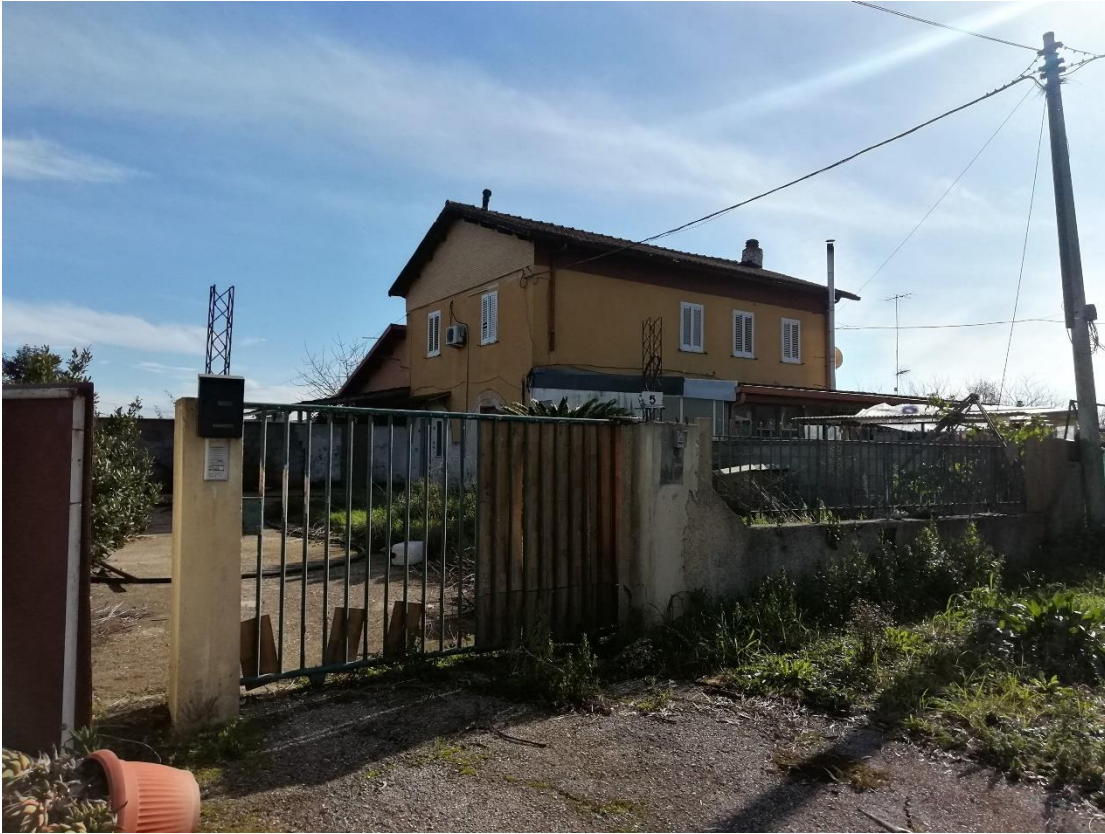
Foto 1 Ingresso dalla via del Valloncello n 5