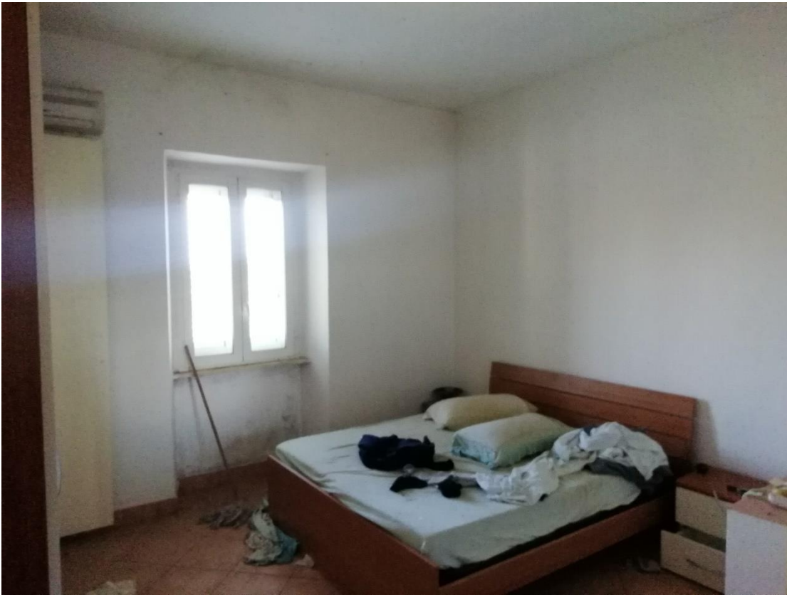
Foto 5 camera da letto 1