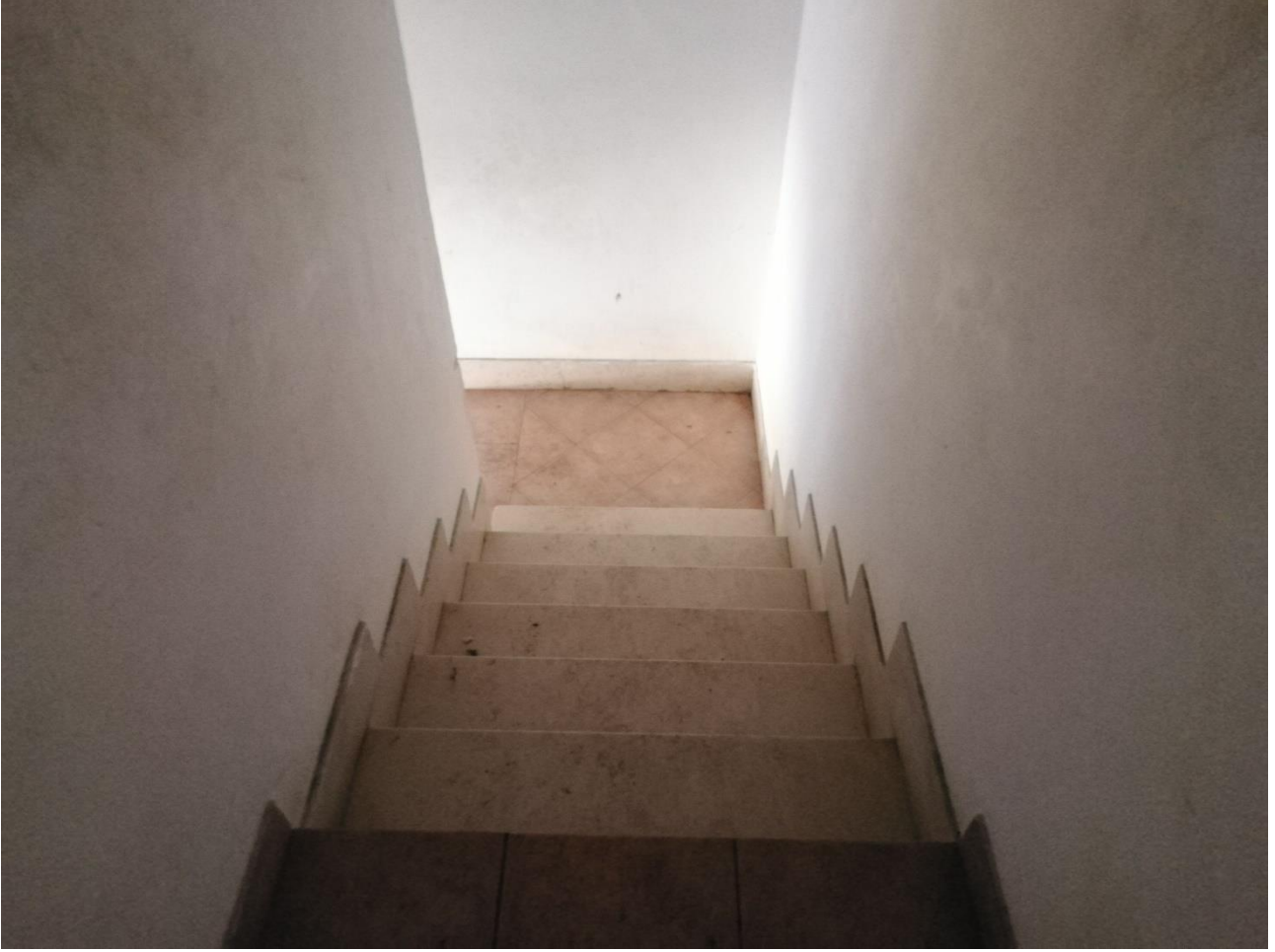
Foto 10 scala interna