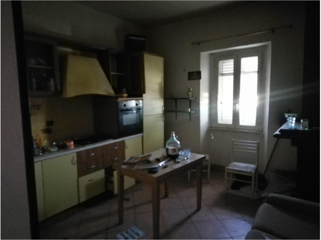
Foto 9 cucina 2