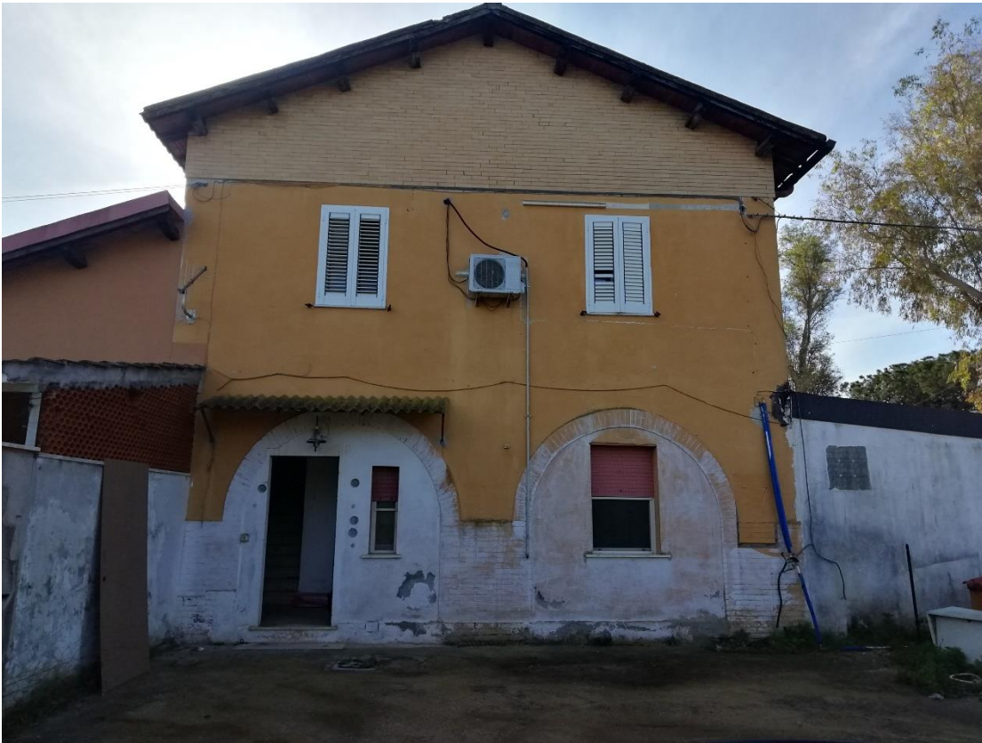
Foto 3 ingresso all'appartamento posto al primo piano