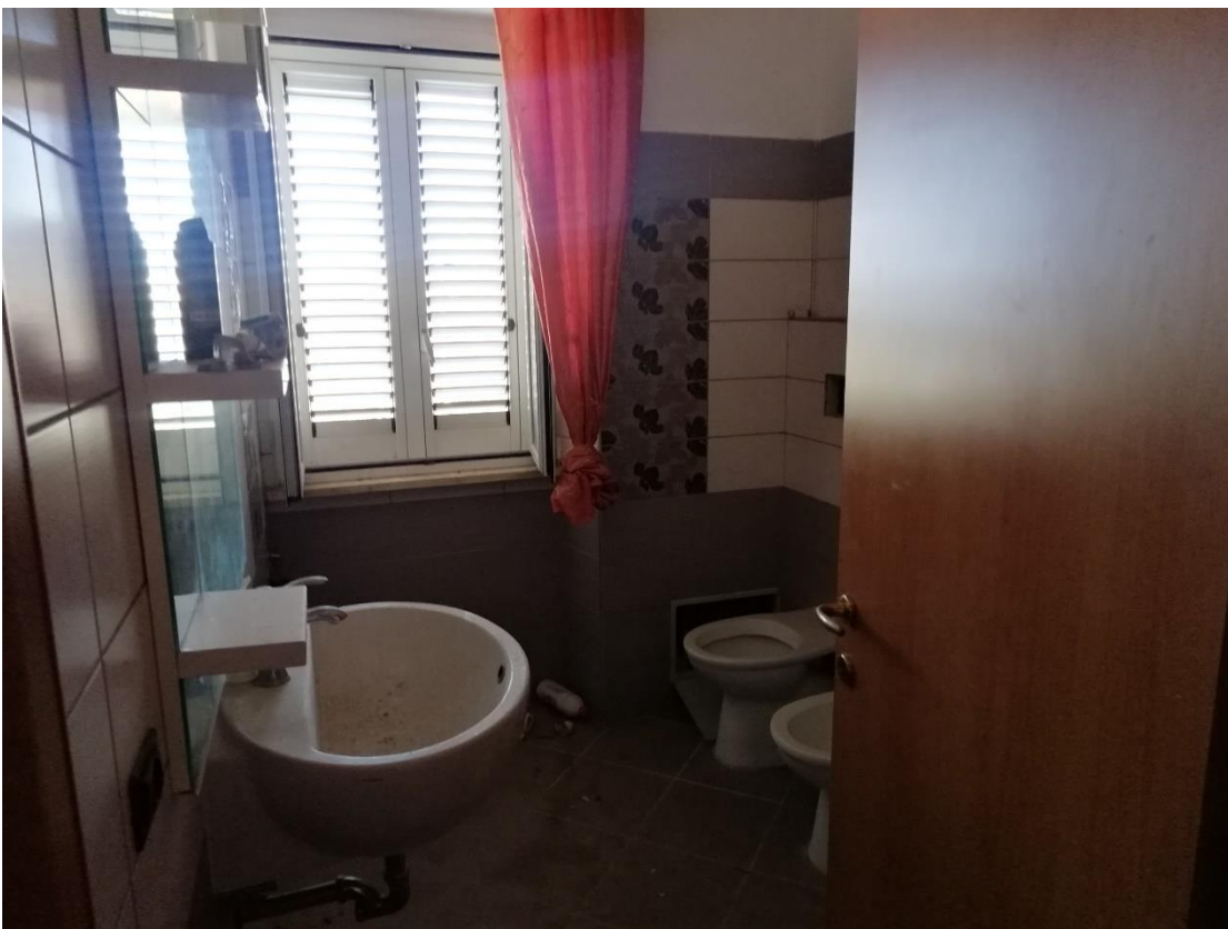
Foto 6 bagno 1