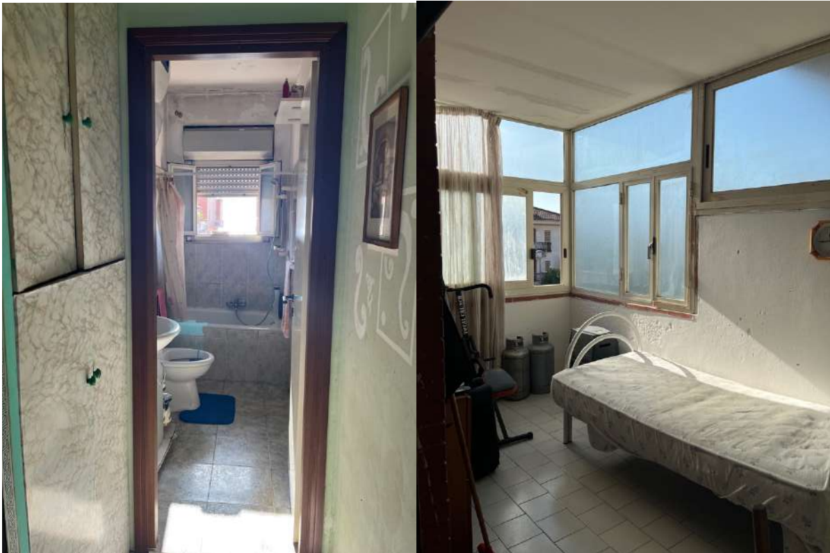
Foto 15_ Vista interna _bagno e balcone chiuso a veranda