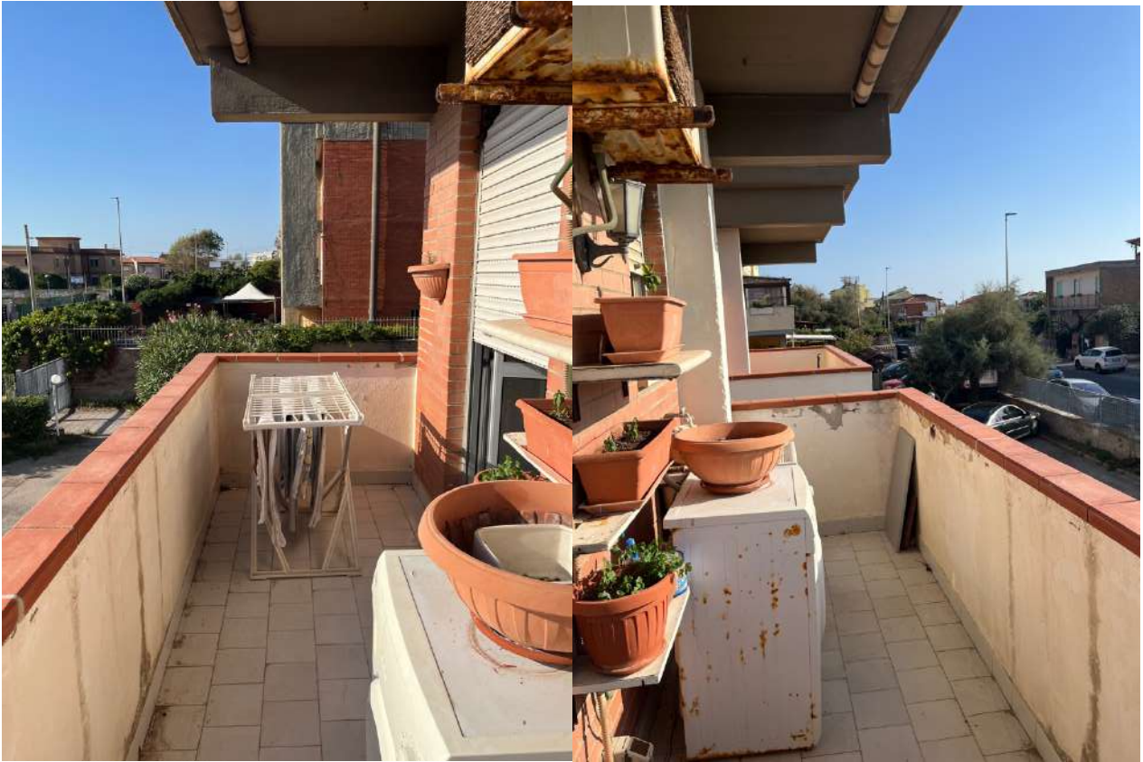
Foto 17 e 18 _ Balcone fronte mare