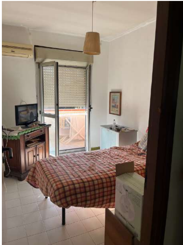
Foto 13 _ Vista interna, camera da letto