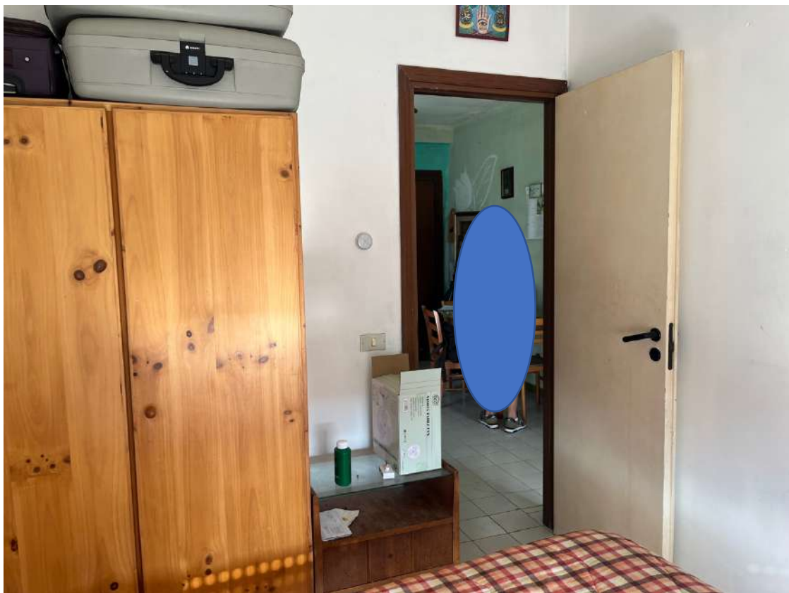
Foto 14 _ Vista interna_idem cs