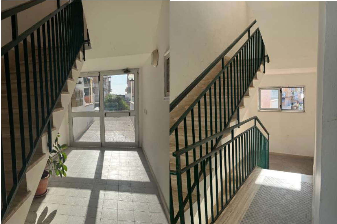
Foto 7 e 8_ Vista interna, androne e scale