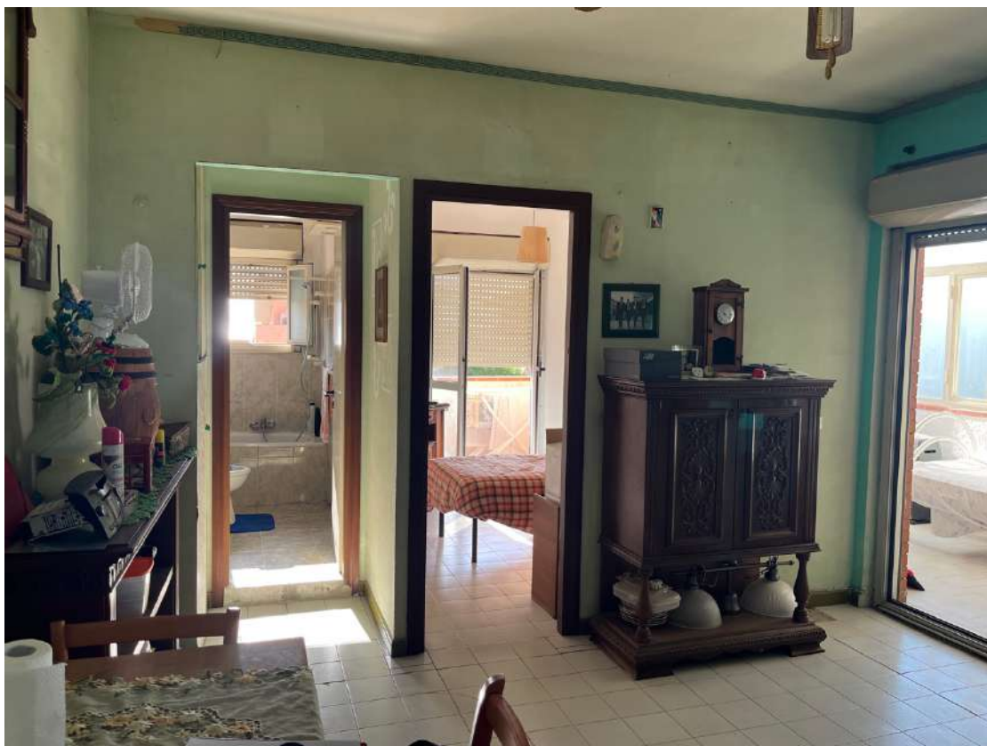
Foto 11 _ Vista interna _ soggiorno