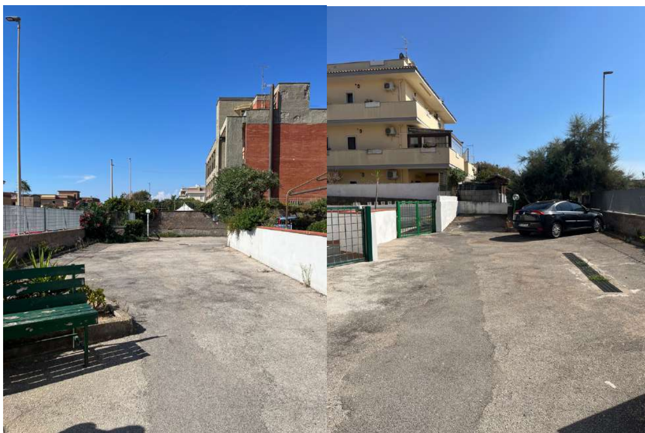
Foto 5 e 6 _ Vista esterna _ corte, aree comuni