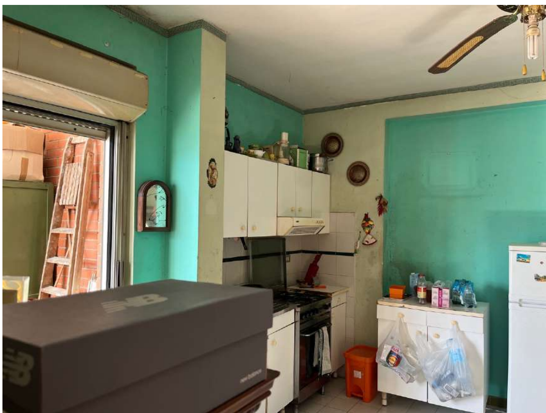
Foto 12 _ Vista interna _ soggiorno e angolo cottura