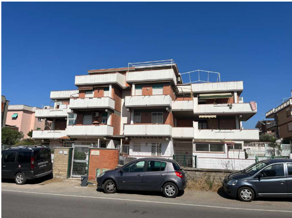
Foto 3 _ Vista esterna