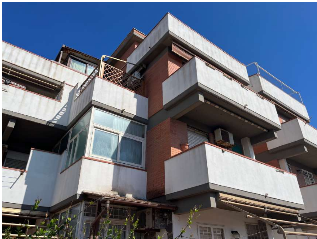
Foto 4 _ Vista esterna _ Appartamento int 7 Piano 1