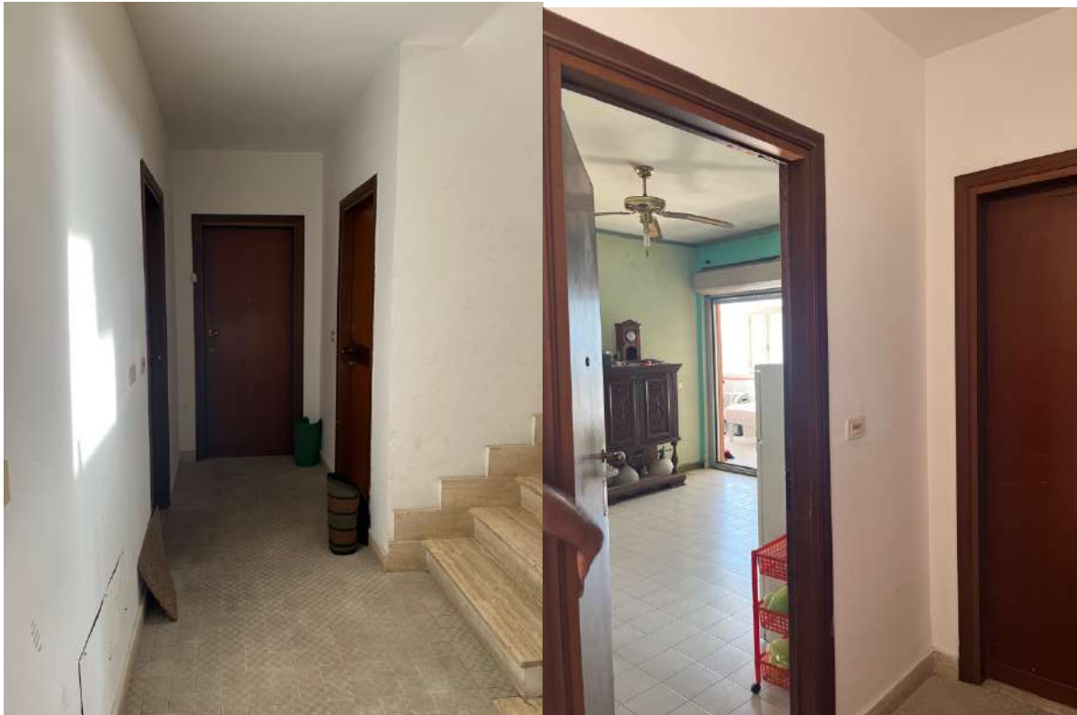
Foto 9 e 10_ Vista interna, pianerottolo e ingresso int 7