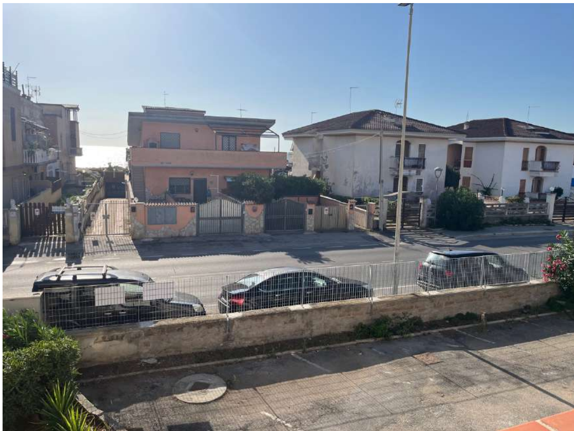
Foto 19 _ Affaccio su via Lungomare degli Ardeatini