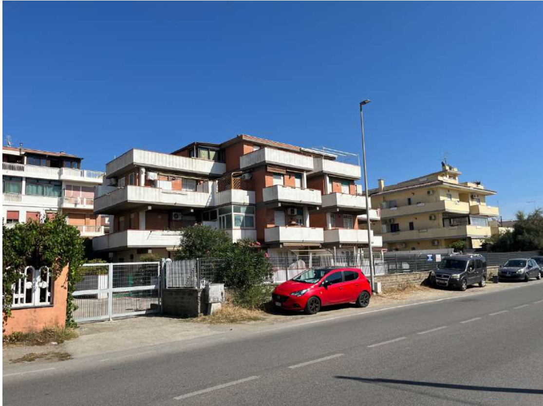
Foto 2 _ Vista esterna _ della palazzina