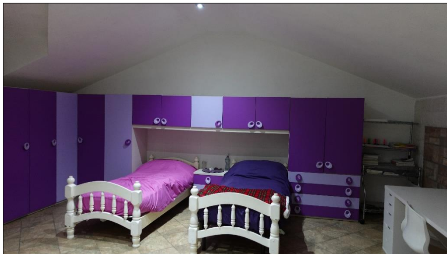
Camera da letto 2