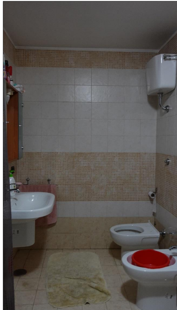
Bagno WC 1