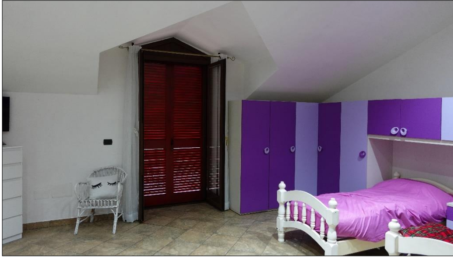
Camera da letto 2