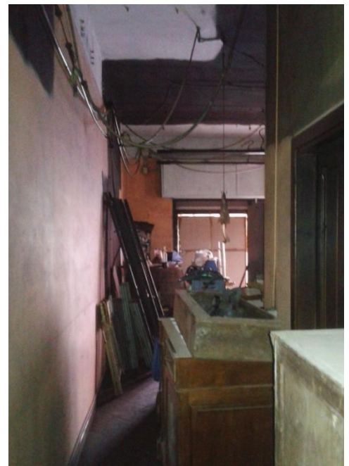
Foto 7 Scatto dall'interno verso la porta d'ingresso