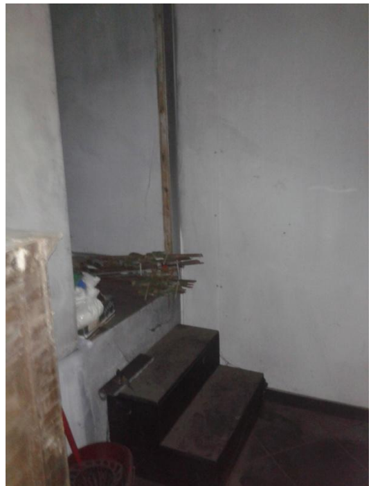
Foto 13 Manufatto in legno per scalini