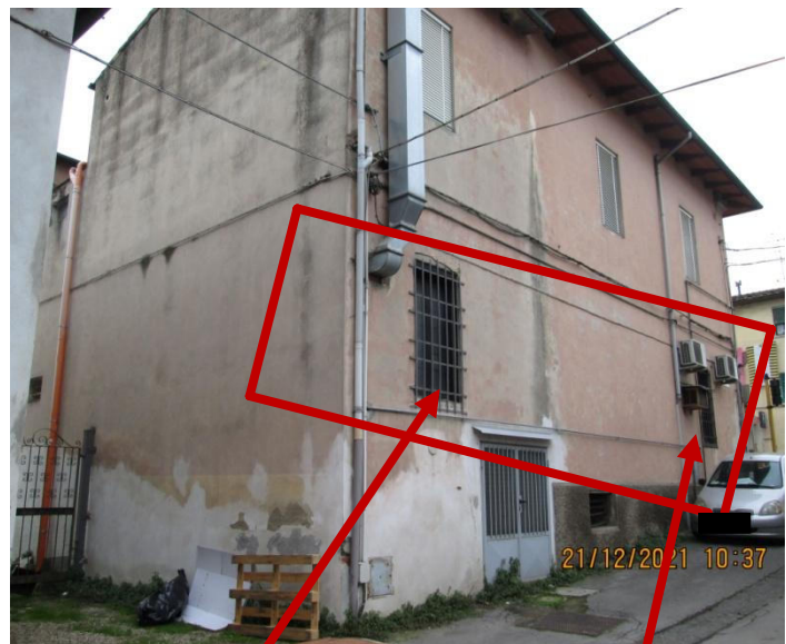
Foto 2 -La porzione dell'immobile in oggetto. Foto 3 - Finestra del magazzino. Finestra della bottega. Laterale dell'immobile