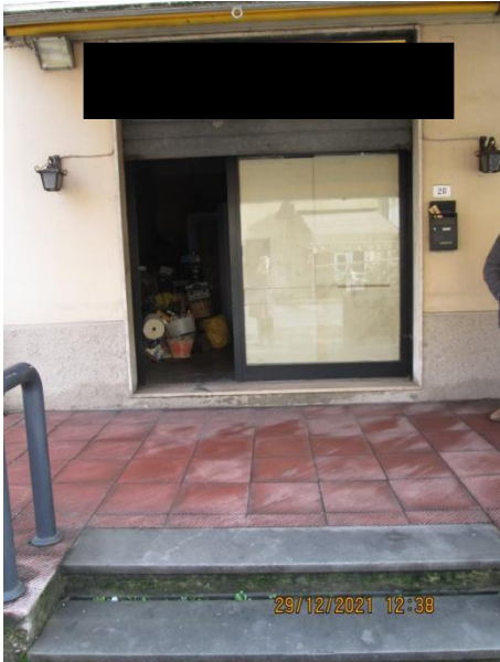
Foto 4 Ingresso su via del Porcellino