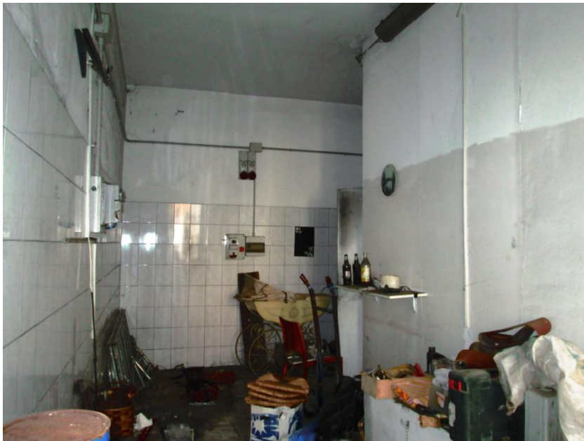
Foto 10 – Il magazzino piastrellato. A destra pareti in tamburato di legno