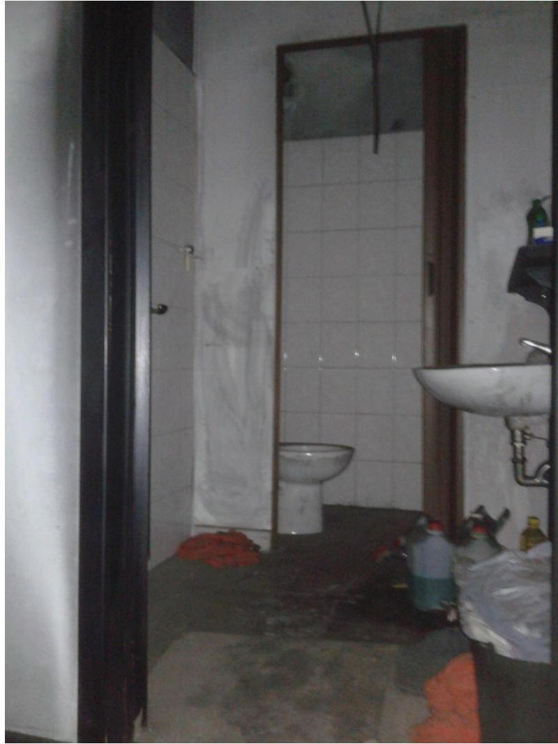
Foto 14 Bagno