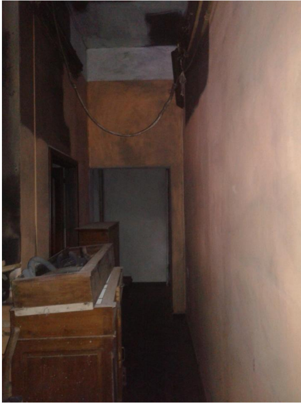
Foto 8 – Dalla bottega al magazzino a sinistra pareti in tamburato di legno (tamburato e/o multistrato di cm 5) senza licenza edilizia