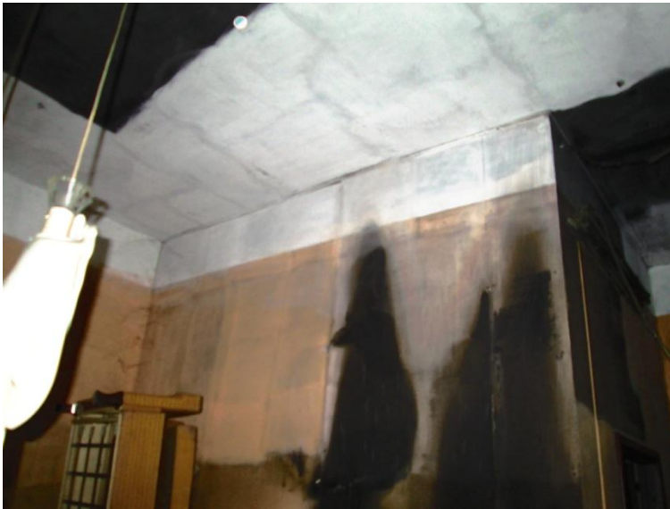
Foto 6 Tracce dell'incendio nella bottega