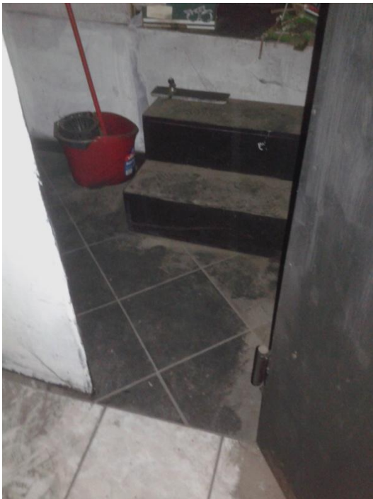
Foto 12 – Dal magazzino al vano del servizio igienico sopraelevato