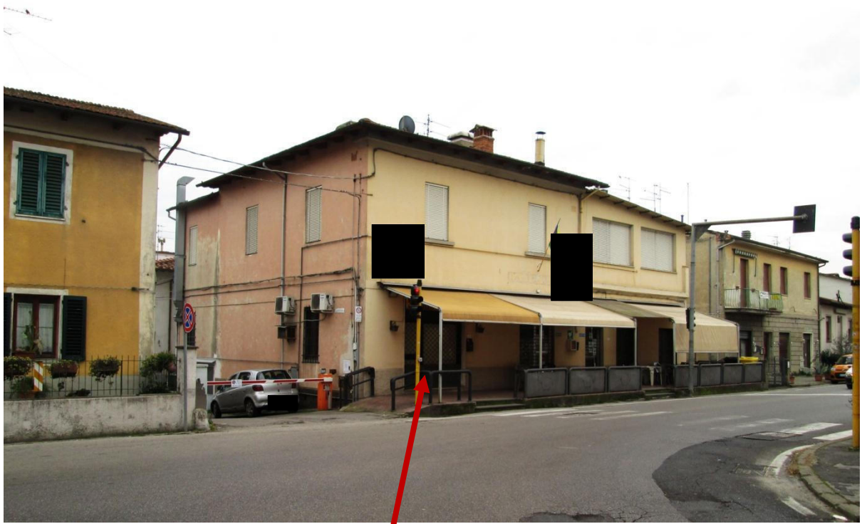
Foto 1 - Edifici in via del Porcellino. A sinistra l'ingresso alla bottega.