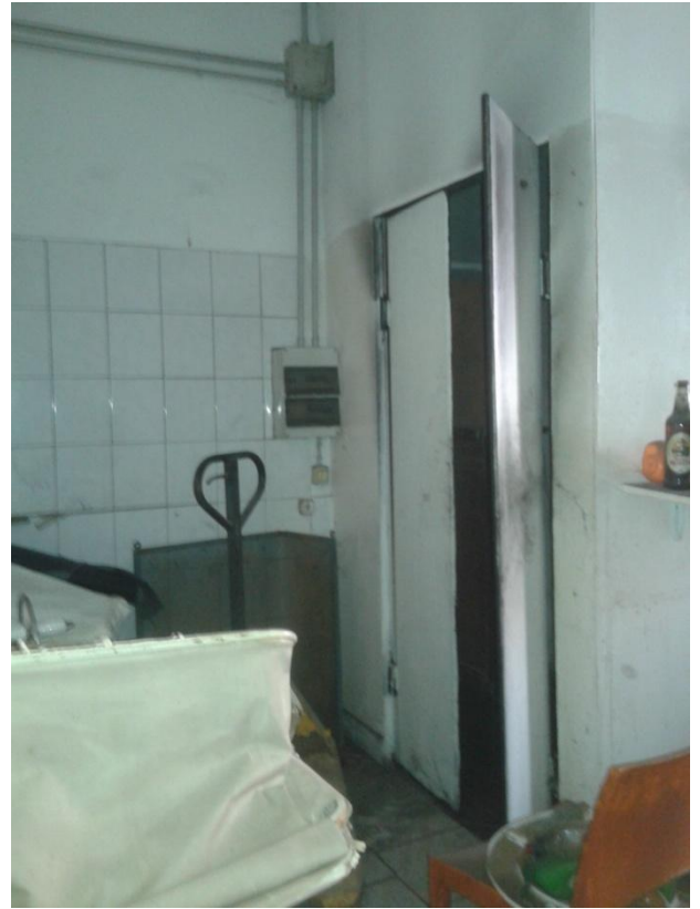
Foto 9 - Il magazzino piastrellato; a destra pareti in tamburato di legno (tamburato e/o multistrato di cm 5) senza licenza edilizia