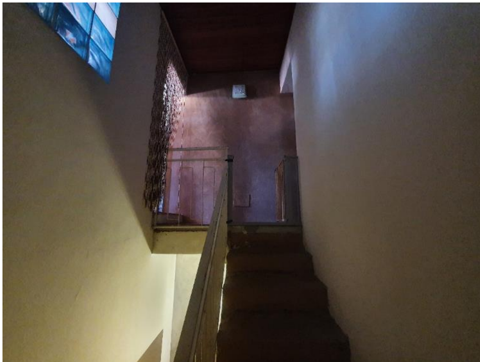
Foto n.10 - Scala