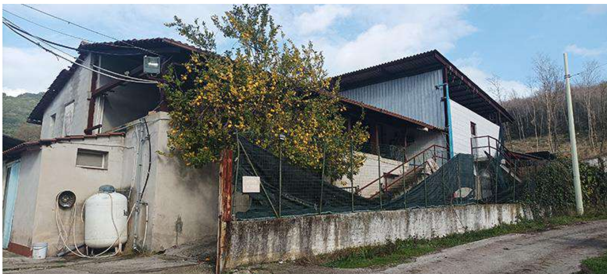
VISTA DALLA STRADA, DA SUD-OVEST