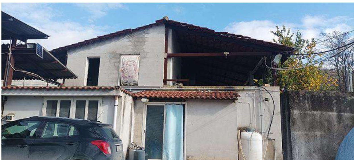
VISTA DA OVEST