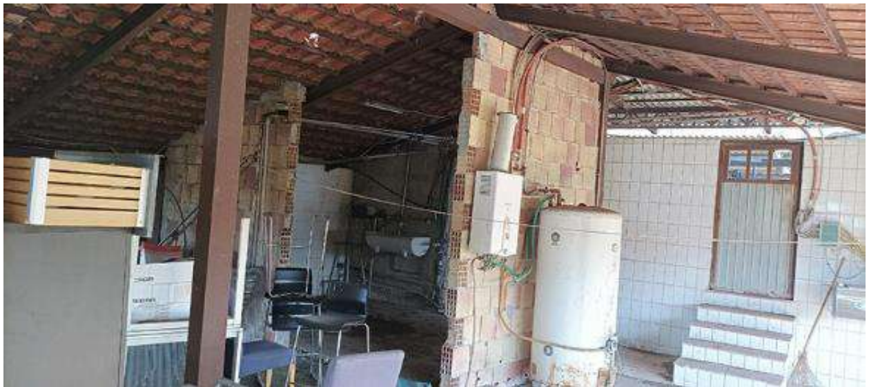
SOTTOTETTO CON OPERE IN CORSO DI REALIZZAZIONE