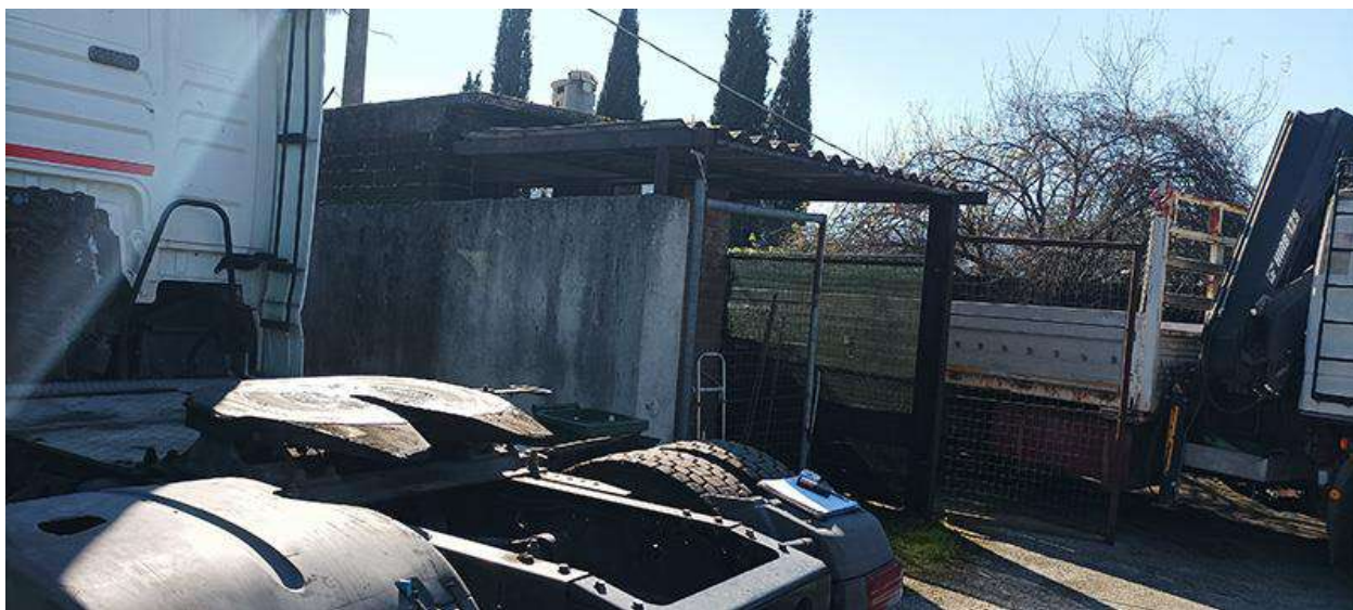
VISTA DA NORD-EST