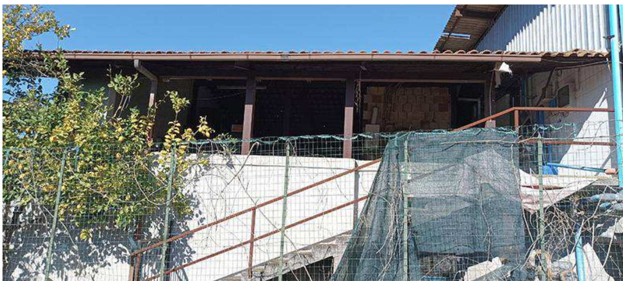
VISTA DALLA STRADA, DA SUD