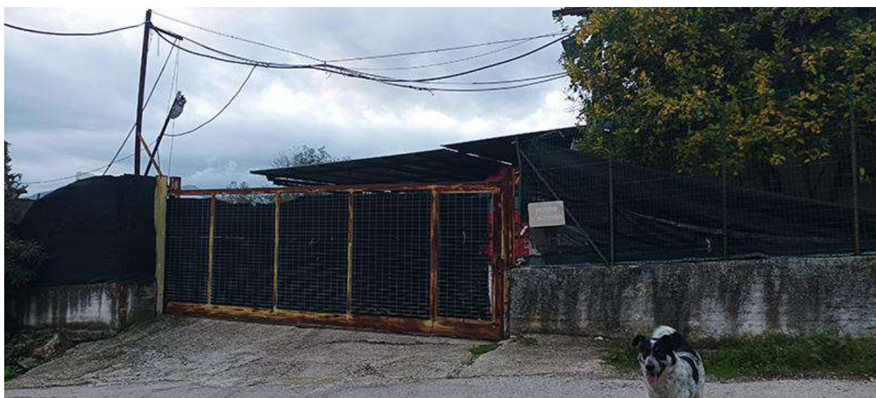
ACCESSO DALLA STRADA