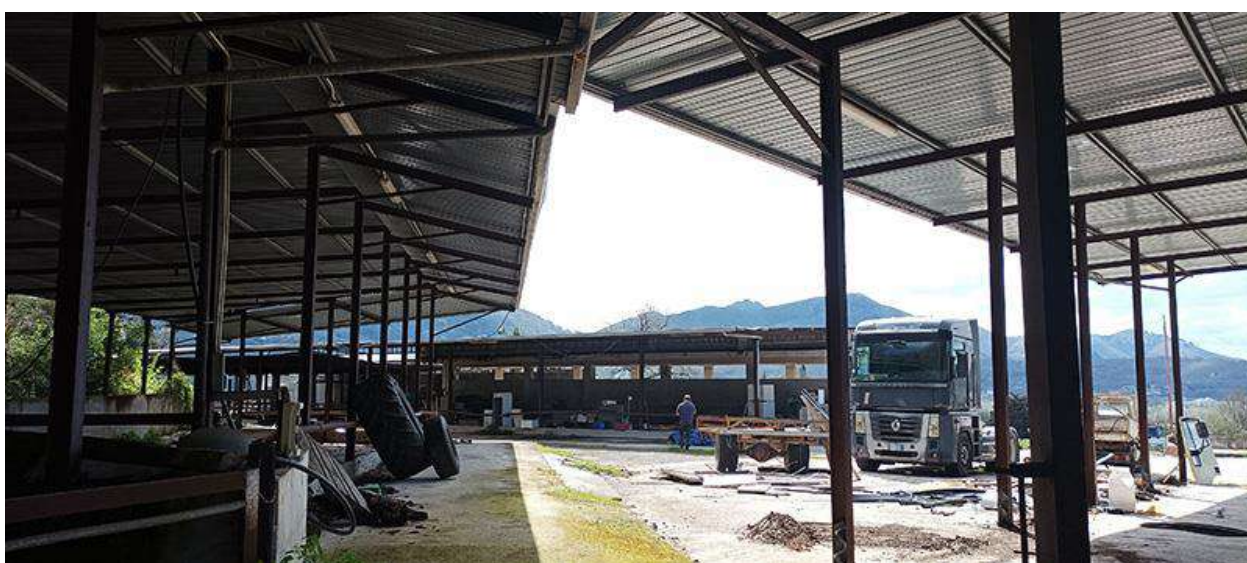
VISTE DELLE TETTOIE LATO EST