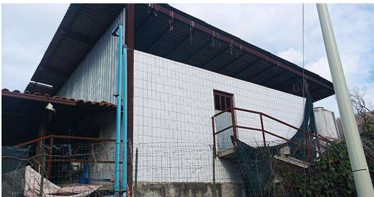
VISTA DA SUD, DALLA STRADA