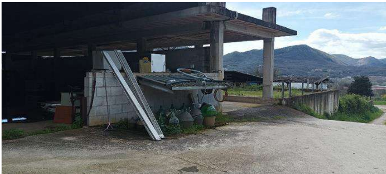
VISTA DA NORD-EST