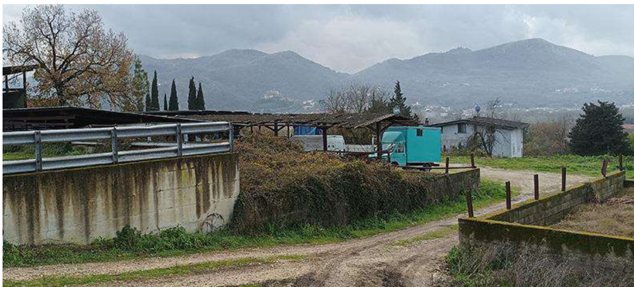
VISTE DA NORD