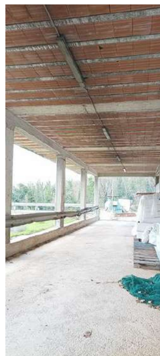
VISTA DA NORD E VISTA INTERNA