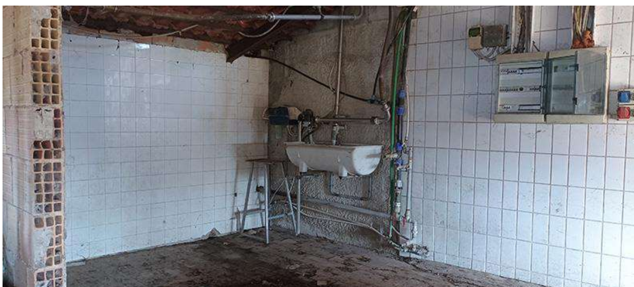
SOTTOTETTO CON OPERE IN CORSO DI REALIZZAZIONE