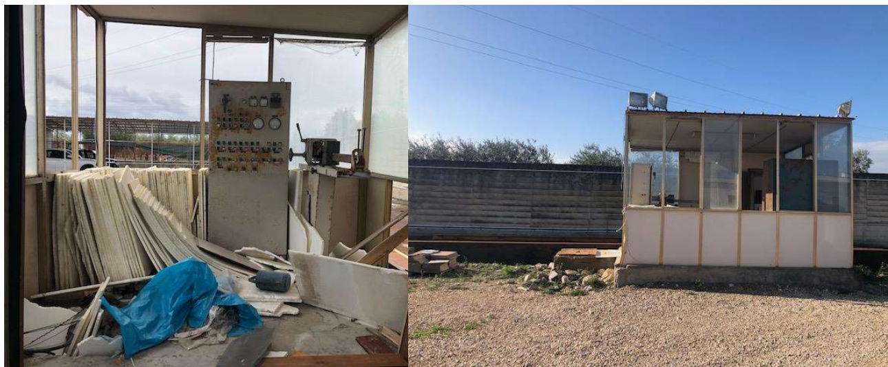
Pesa abbandonata presente lungo il confine ovest

c.f. FRZNN81R57A471W - Partita I.V.A. 04284360288