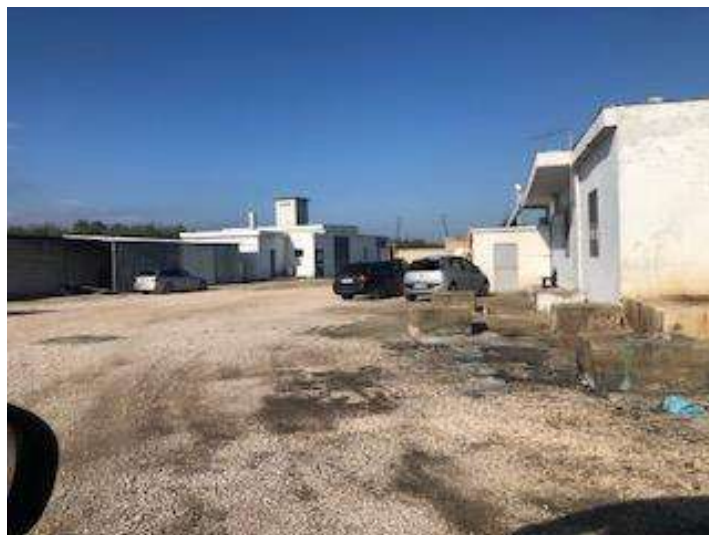
Vista da est e da sud ovest dell'edificio abusivo posto centralmente al lotto. Nella foto di destra si vede sulla sinistra anche l'edificio abusivo posto al vertice nord ovest.