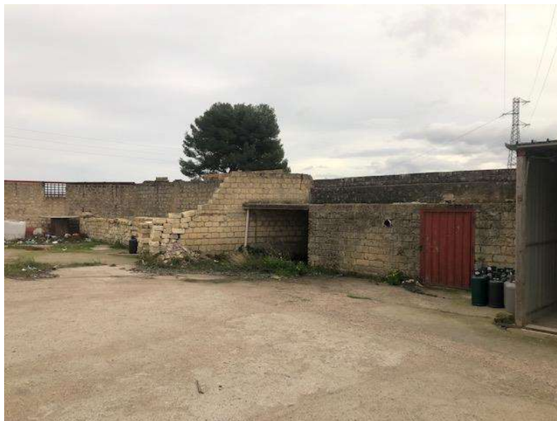
Manufatti diruti presenti all'estremità est del lotto