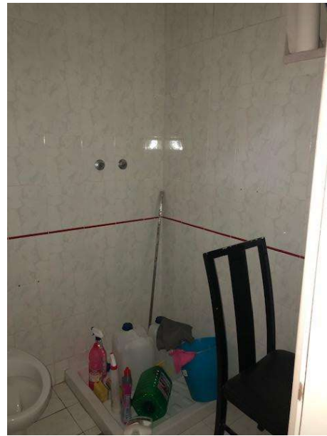
Servizi igienici del fabbricato abusivo posto centralmente al lotto