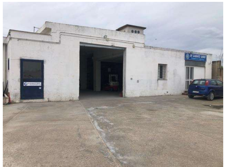
Edificio abusivo posto sul vertice nord ovest della proprietà