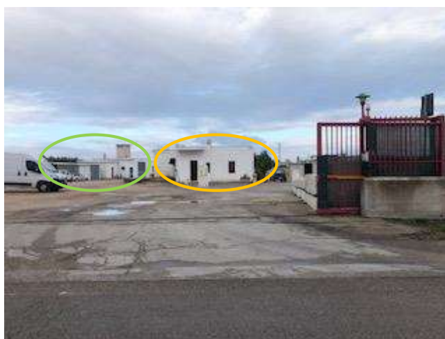
Vista da sud ovest dell'edificio abusivo posto centralmente al lotto. Nella foto si vede sulla sinistra anche l'edificio abusivo posto al vertice nord ovest