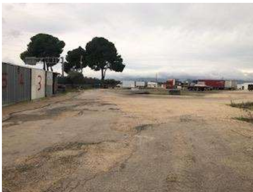
Container presenti lungo il confine sud