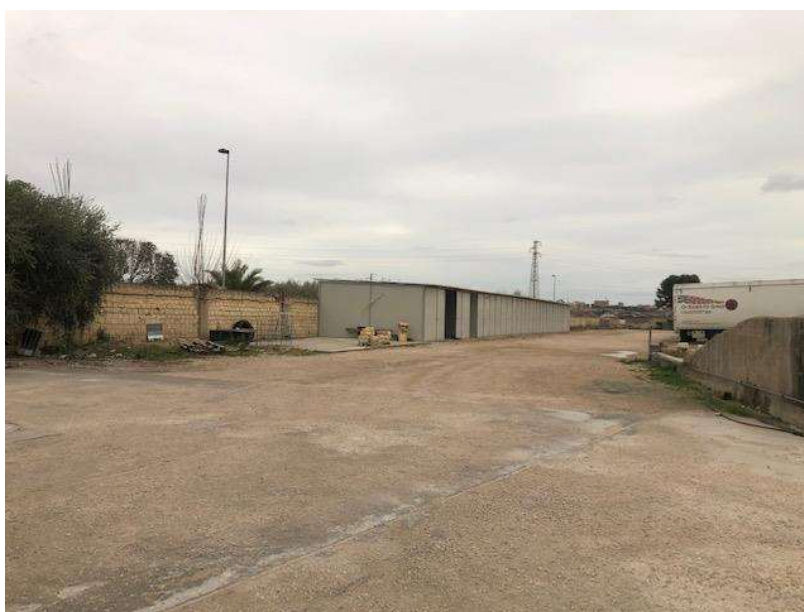
Container presenti lungo il confine nord