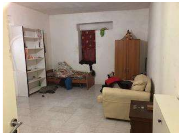
Ambienti interni del fabbricato abusivo posto centralmente al lotto