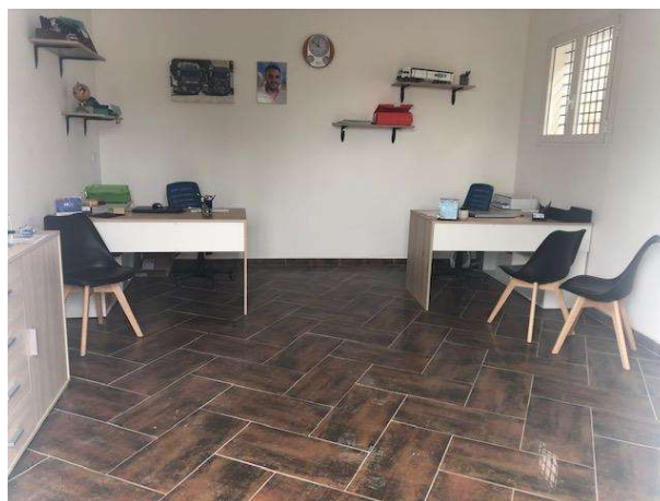
Ambienti del fabbricato abusivo posto sul vertice nord ovest del lotto