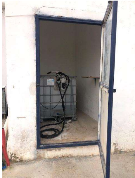
Ambienti del fabbricato abusivo posto sul vertice nord ovest del lotto