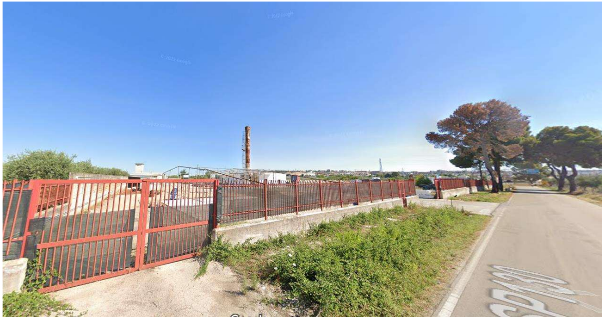
Vista dalla SP 130

c.f. FRZNN81R57A471W - Partita I.V.A. 04284360288