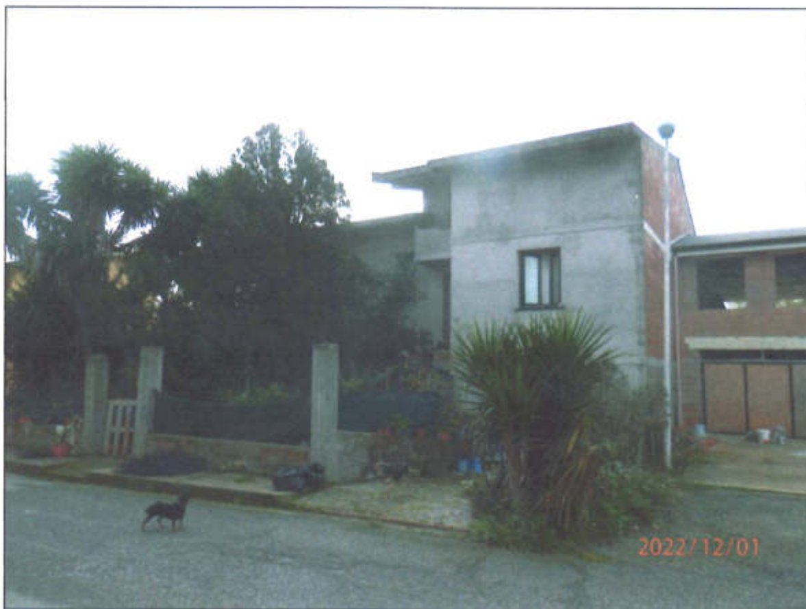
Fabbricato sito in Ghilarza (OR) - Via Campidano, s.n.c. - Foglio 6 Mappale 4367

C.T.U. Incaricato: Geom. Massimo SOLINAS