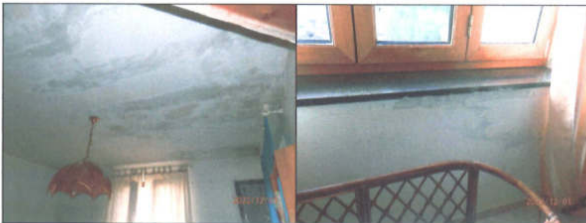
intradosso solaio studio - Piano Rialzato

Altre infiltrazioni si sono riscontrate nelle finestre ubicate a sud-ovest; di seguito si riportano alcune fotografie di tale situazione :