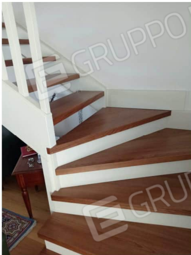
vista soggiorno terzo piano sottotetto