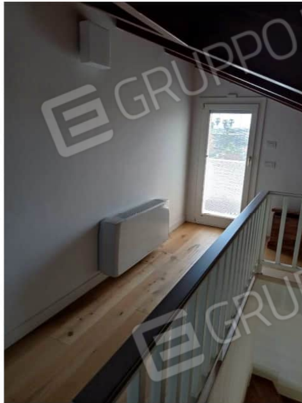
wc terzo piano sottotetto